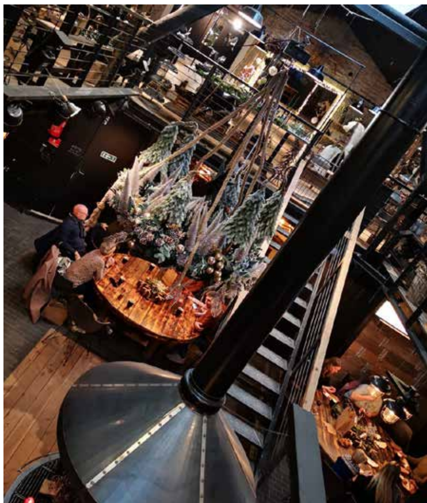
Fotografen havde øjensynligt også nydt lidt af hvert – efter det skæve format at domme.