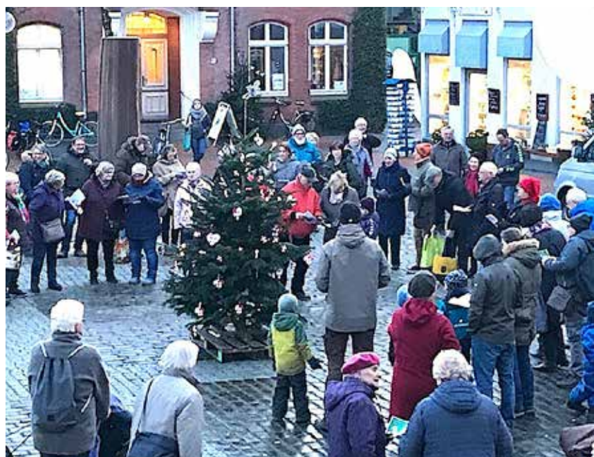
For anden gang indbød SSF Egernførde til "syng julen ind" på byens Rådhusplads, hvor både medlemmer fra mindretallet og flertalsbefolkningen sang julen ind på dansk og tysk. Senior-luciapiger (tidligere elever fra Jes Kruse-Skolen) og duoen Frehr & Nissen underholdt de henvendte 150 deltagere.