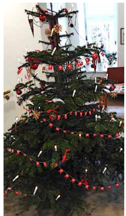
Juletræet i Flensborghus-foyeren.