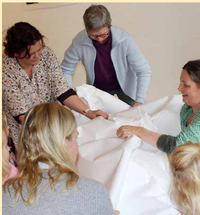
Når man krosser og prosler et stort stykke papir, bliver det til et snelandskab.