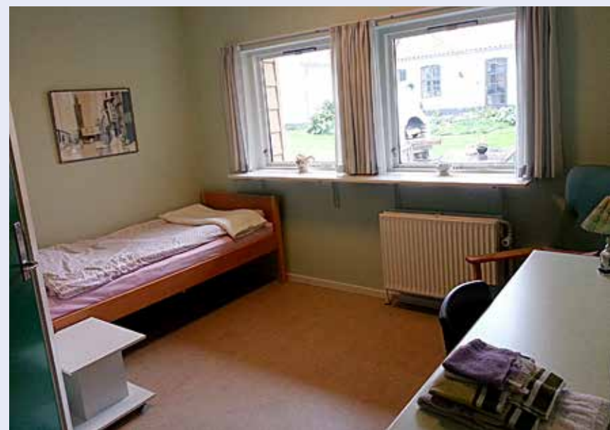
Takket være en donation fra A.P. Møller-Fonden for nogle år siden er værelserne nyrenoverede.

Omtalen af tilbuddene m.h.t. Bennetgaard på sidste uges KONTAKT har tilsyneladende skræmt en del interesserede ældre sydslesvigere: Redaktionen kom nemlig til at skrive, at et ophold dér koster 200 euro. Det er heldigvis ikke tilfældet. Et 10 dages ophold på hvile- og rekreationshjemmet Bennetgaard i Københoved (ikke Skovshoved) nær Vejen koster nemlig kun 138 euro i delt dobbeltværelse. Eneværelse koster 50 € ekstra. Til udflugter m.m. må påregnes 150 dkr. Tilhører man det danske mindretal i Sydslesvig, og har man lyst eller trænger til et pusterum, kan man tilmelde sig til et gæsteophold på Bennetgaard via Dansk Sundheds-tjeneste på 0461-570580. Startdatoer: 2/4, 23/4, 7/5, 21/5, 11/6, 25/6, 6/8, 20/8, 10/9, 5/11, 26/11.