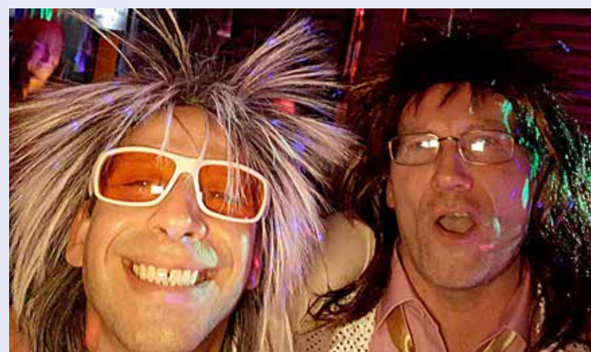
To i godt humør.