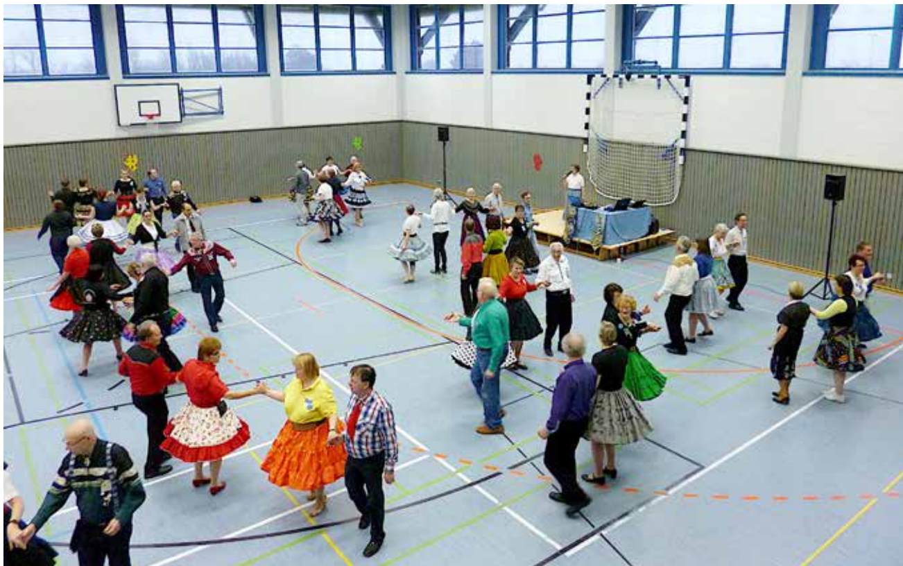
Squaredance-special på Sild.