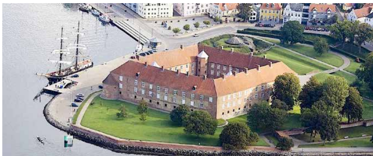
Og i Sønderborg venter slottet på gæsterne fra Gottorp amt.