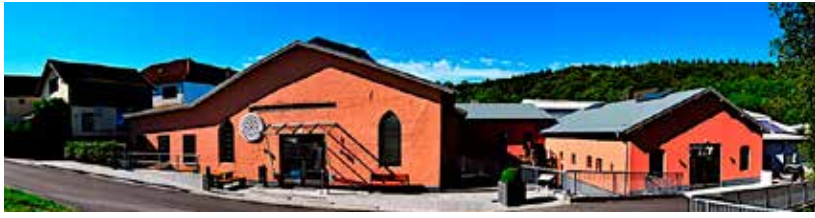
Kobbermølle Industrimuseum danner også i år rammen om en scenisk læsning, denne gang omkring Agatha Christie og Hercule Poirot.