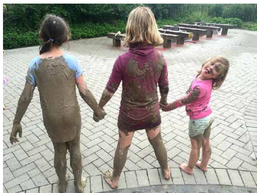
Børnene er bestemt ikke bange for mudderet, men vælger de helkrops-dukkerne, bør forældrene have skiiftetøj med.