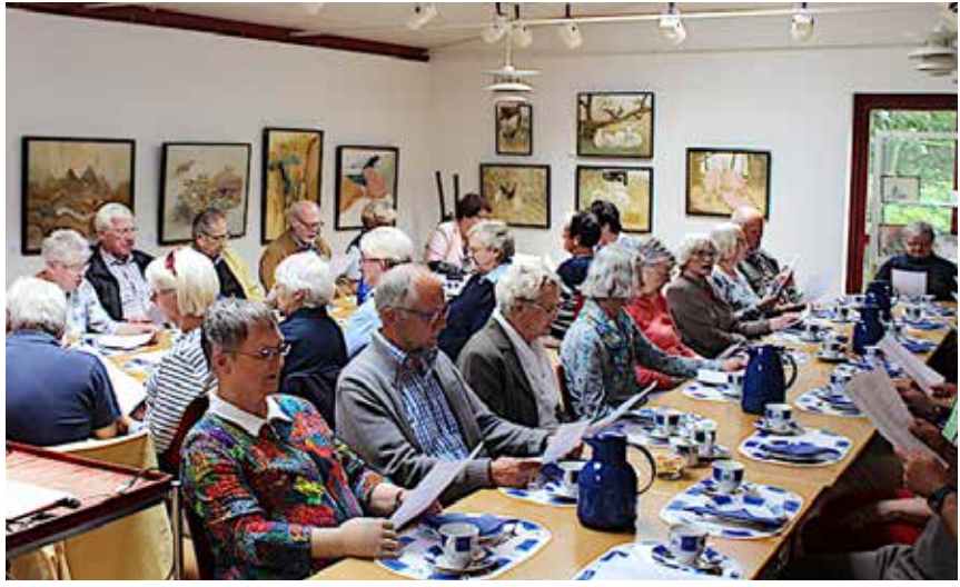
Synges skal der, når de danske samles.