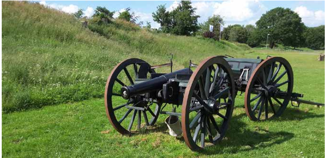
Danevirke har blandt andet en kanon som dem, fæstningen var bestykket med i 1864. En rekonstrueret Skanse 14 kan også ses på Danevirke den lørdag, dog uden kanoner.