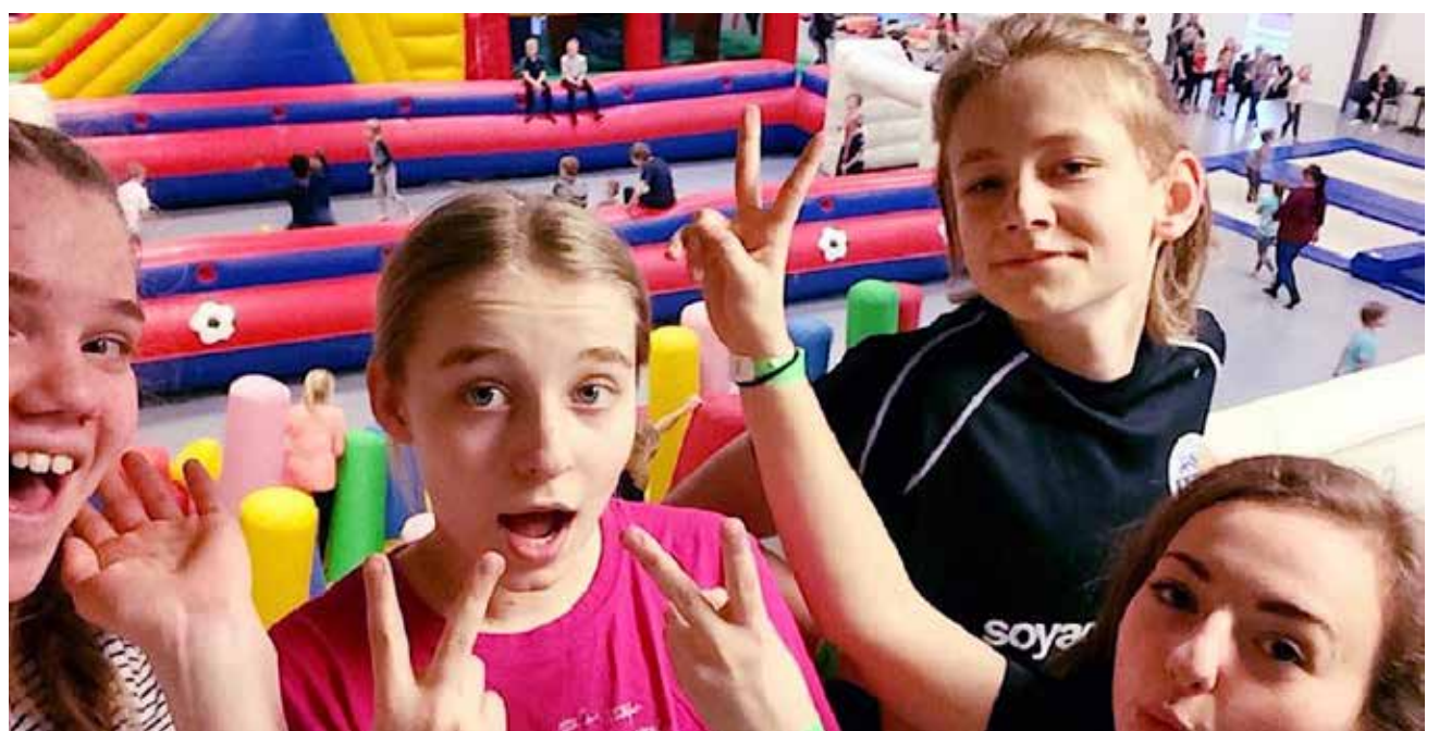
Jump – det er sagen.