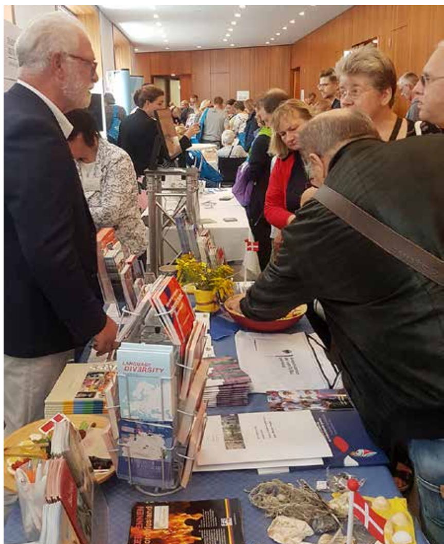
Am Stand des Minderheitensekretariats beim Tag der offenen Tür des BMI 2019.