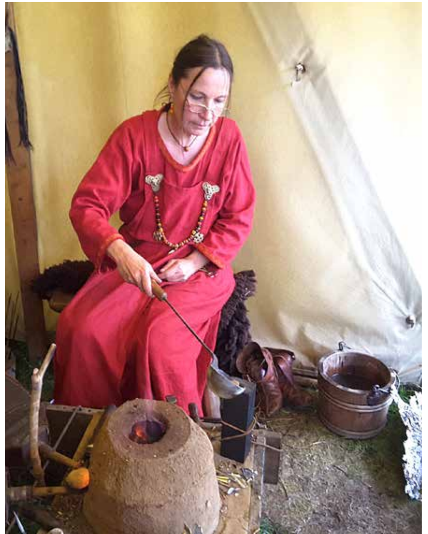
ph Håndværk som i vikingetiden.

Lørdag den 7. september byder SSF Husum og Omegn på en tur til Danevirke, Europas ældste forsvarsværk. Danevirke er hen ved 1600 år gammelt og var en gang grænsen mellem Danernes rige og Frankerriget. Siden var det grænsen mellem Danmark og de tyske lande. Deltagerne kører fra p-pladsen ved Neue Freiheit klokken 10 og når frem cirka tre kvarter efter. Når de er ankommet, får de en rundvisning på Danevirke Museum, hvorefter de spiser deres medbragte mad. Maden er ikke inkluderet i prisen – tag selv mad med. Derefter kan de lære at lave thorshammer. Thor var en af de gamle nordiske guder, som man tilbad den gang. Danevirke blev bygget. Når han kastede sin hammer, ramte han altid, og hammeren kom altid tilbage til ham. Turen koster 10 euro for voksne og 5 for børn. Tilmelding senest 29. august til Daniela Caspersen, 015201351285, caspersen.dany@gmail.com Tilmelding er først gyldig, når deltagerprisen er indbetalt på IBAN DE25 2175 0000 0106 0196 07, BIC: NO-LADE21NOS