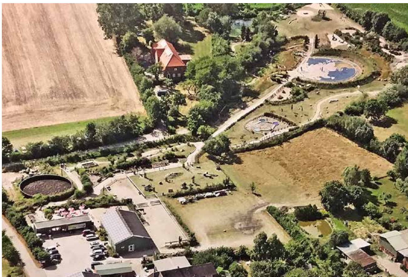
Barfußparken er naturskønt beliggende.