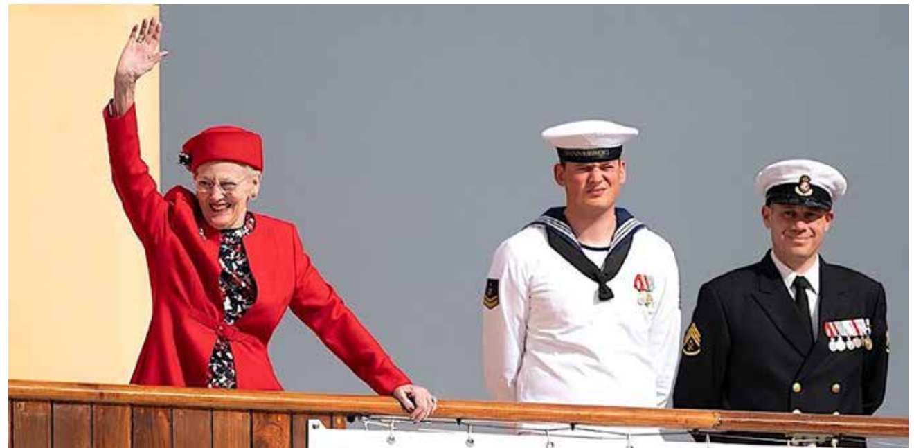
H.M. Dronningen ombord på Dannebrog.

til Danmark. Flere informationer på www.tyskland.um.dk