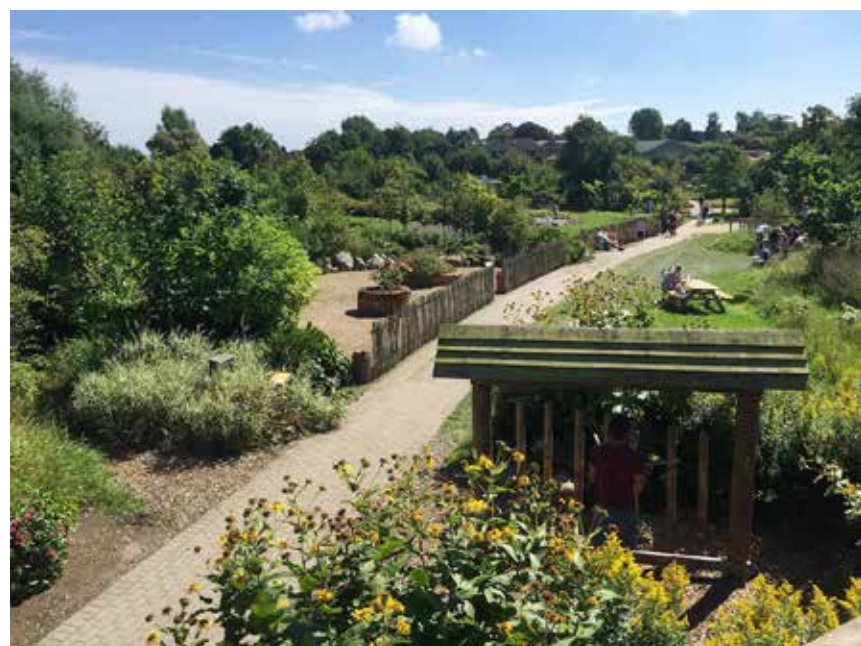
Flot anlagt, velegnet til action og/ eller gåture.

Søndag den 8. september arrangerer SSF Flensborg By en udflugt for hele Flensborg, ikke mindst for børnefamilier. Der er ikke lang kørsel forbundet med udflugten men masser af sjov for dem, der gerne vil, og mere stille sightseeing for dem, der er til det. Turen går til den angelske veteranbane "Angeler Dampfeisenbahn" med udgangspunkt i Sønder Brarup og Kappel som mål; og derfra videre til Barfußpark/ barfodsparken i Schwackentorp/ Schwackendorf nær Kappel. Sidstnævnte sted er der masser af action for alle dem, der vil det, og muligheder for rolige gåture i en flot park for dem, der kan lide den måde at bruge fritiden på. Kl. 10.45 bliver der afgang fra Ansgar Kirke i Flensborg Nord, lidt senere fra Skibbroen/ Schiffbrücke/ museumsværftet, senere igen fra Jens Jessen-Skolen og derpå fra Sct. Jørgens Plads, og henad kl. 11 fra hjørnet Adelby Kirkevej/ Lyksborggade/ Glücksburger Strasse. Deltagerne samles op de nævnte steder. Sig til ved tilmelding, hvor man vil stige på bussen. Man kan forvente at være hjemme igen omkring kl. 16.30. Deltagerne medbringer selv madpakke; SSF sørger for kaffe/ te, drikkevarer og kage. Medlemmer betaler 20 euro, børn 5 euro, under 12 år gratis. Gæster betaler 30 euro. Tilmelding på bysekretariatet, flby@syfo.de hhv. 0461 14408-125/125/127 senest mandag morgen den 26. august.