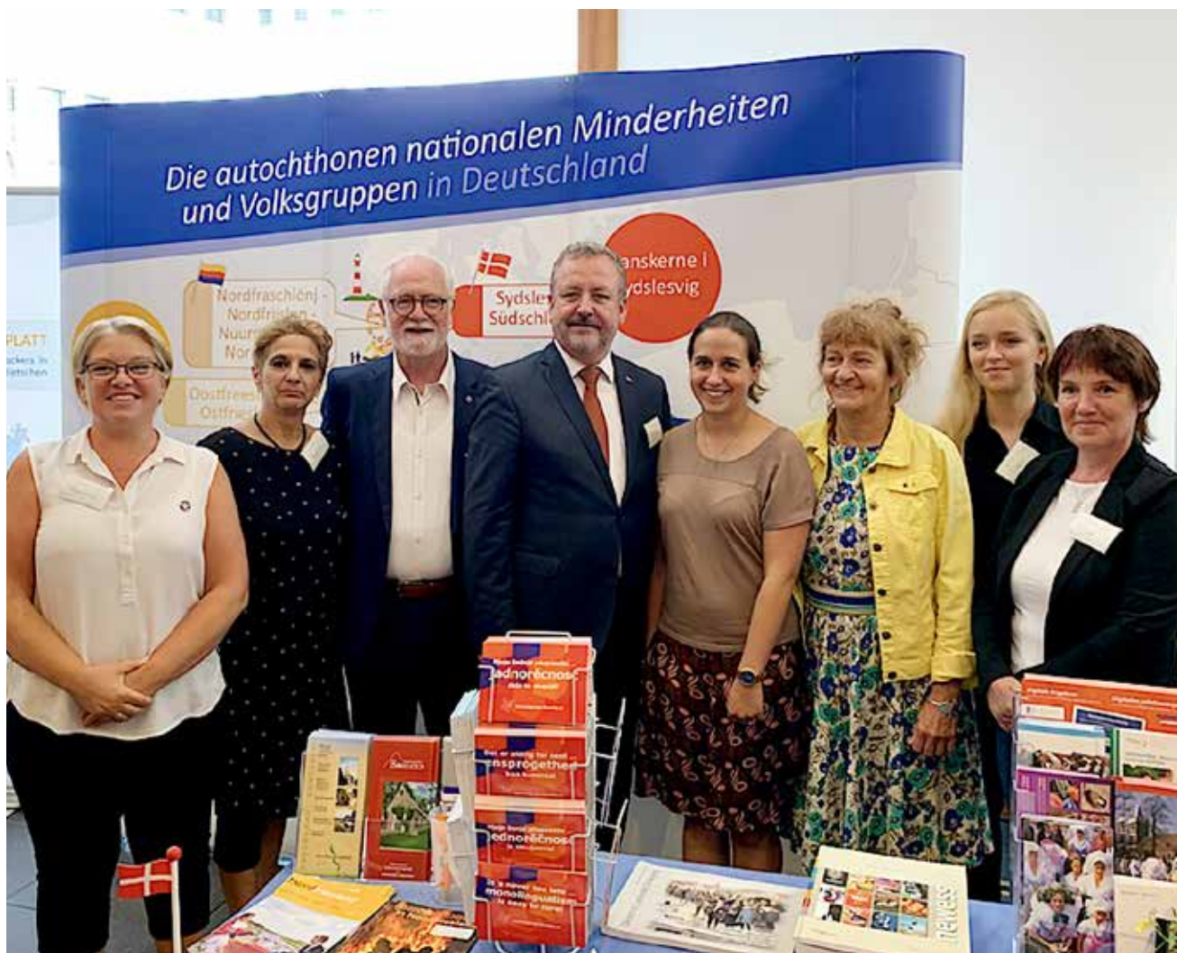
Vertreter der nationalen Minderheiten am Stand mit dem Beauftragten der Bundesregierung für Aussiedlerfragen und nationale Minderheiten, Bernd Fabritius.