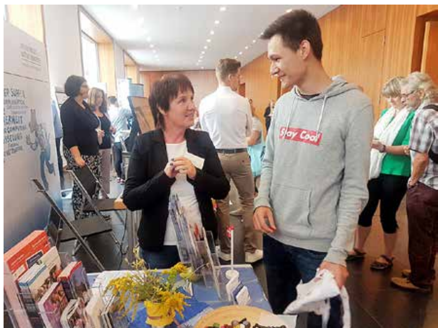
Gespräch am Stand der nationalen Minderheiten beim Tag der offenen Tür des BMI.