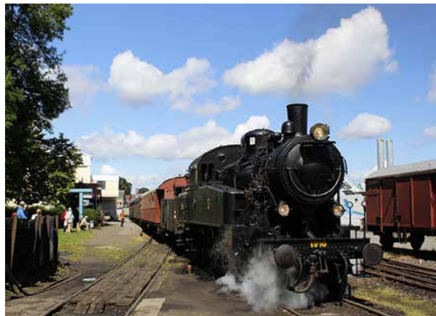
Det smukke svenske damplokomotiv S1916 spændes for vognene på turen fra Sønderbrarup til Kappel 8. september.