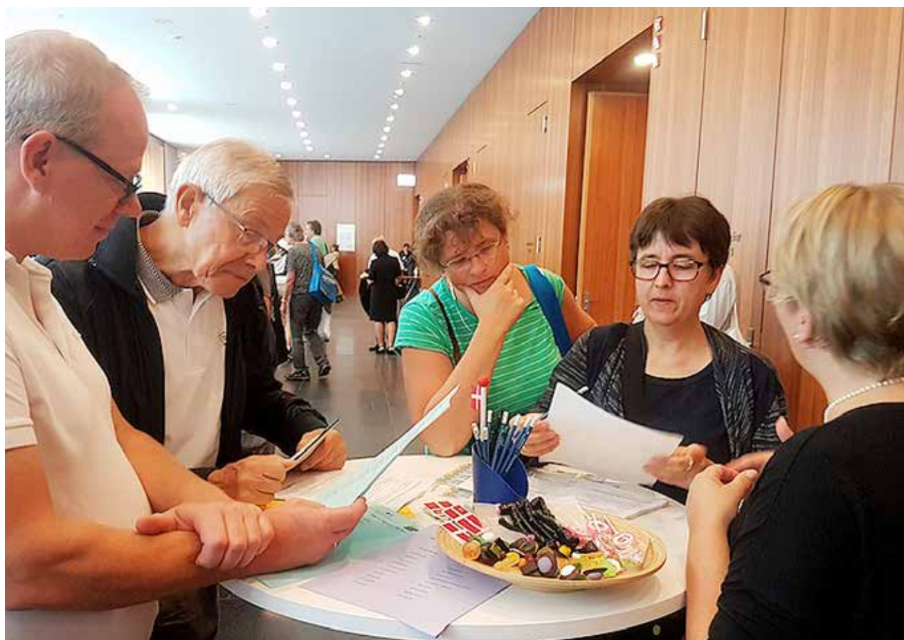
Besucher des Tages der offenen Tür beim Quiz bei der dänischen Minderheit.