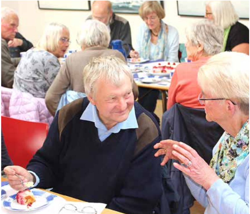
Under kaffen var der også tid til hyggesnak og skælmske smil.