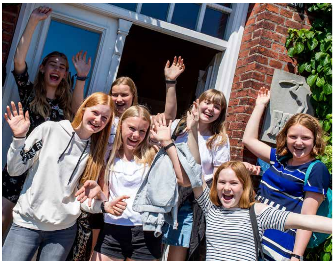
Også de unge oplevede det dansk-tyske grænseland på nært hold.

Mål: Fremme grænseregionens borgers interkulturelle forståelse med henblik på dansk og tysk levevis og kultur. AJ