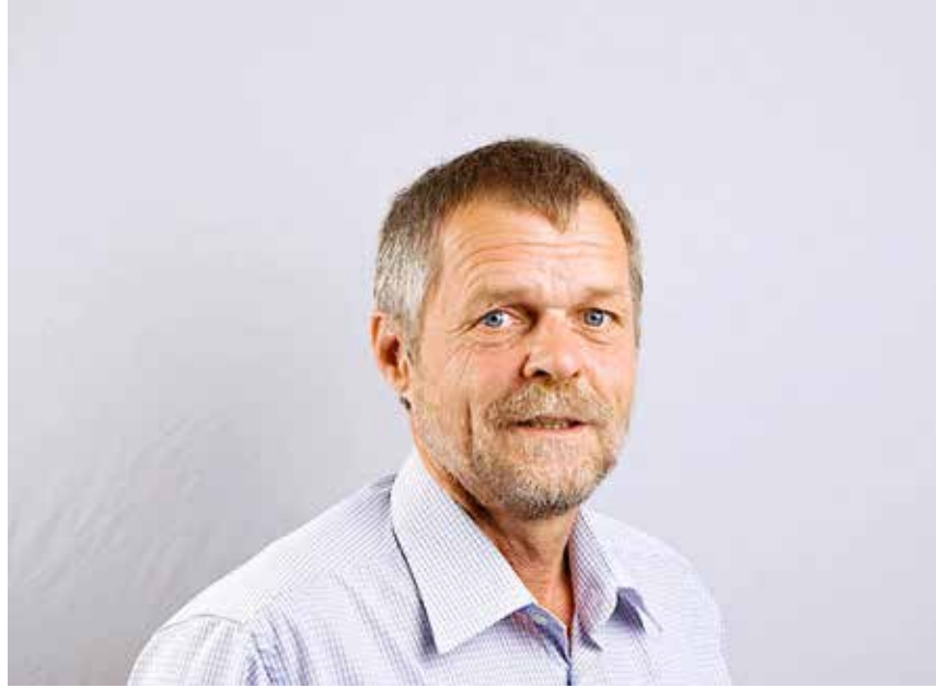
SSW-Landesvorsitzender empfiehlt dem SSW-Hauptausschuss die Annahme des Entschliessungsantrages „Wahlaussagen“.