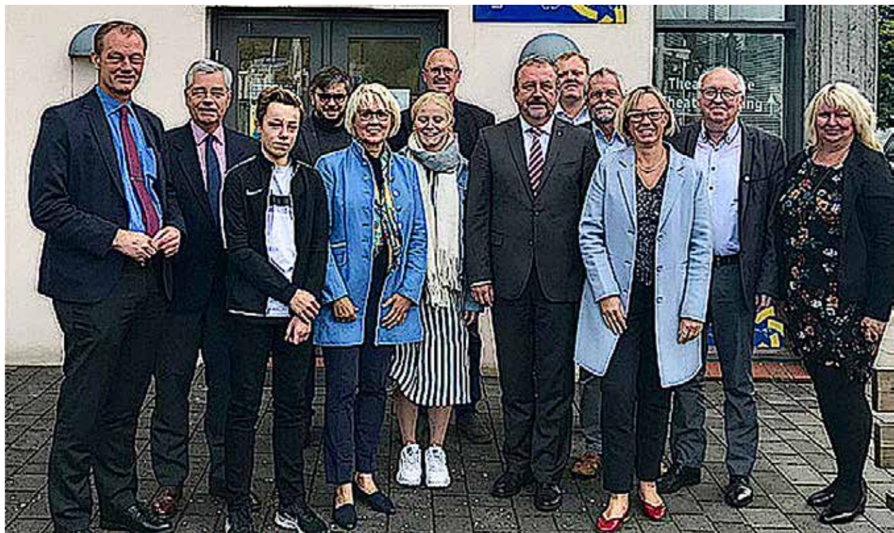
Vertreter und Gäste bei der Kontaktausschuss-Sitzung vorm Slesvighus in Schleswig.

Das deutsch-dänische Grenzgebiet gilt als Vorzeigeregion in Minderheitenfragen und ist ein Musterbeispiel der guten grenzüberschreitenden Zusammenarbeit und des positiven Miteinanders von unterschiedlichen Kulturen und Sprachen. In einer Welt, in der das politische Spektrum sich vor allem nach rechts außen verbreitert, ist es wichtig, den Menschen positive Alternativen zu Hass, Angst und