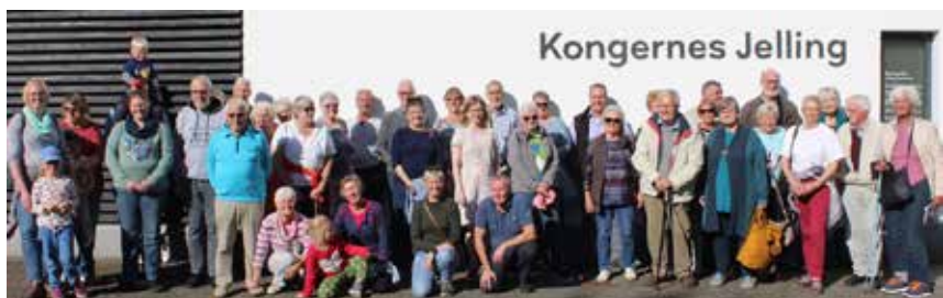
Deltagerne foran museet i Jelling.