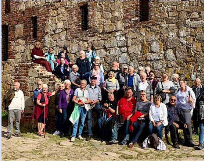
Deltagerne stiller an til fotografering.