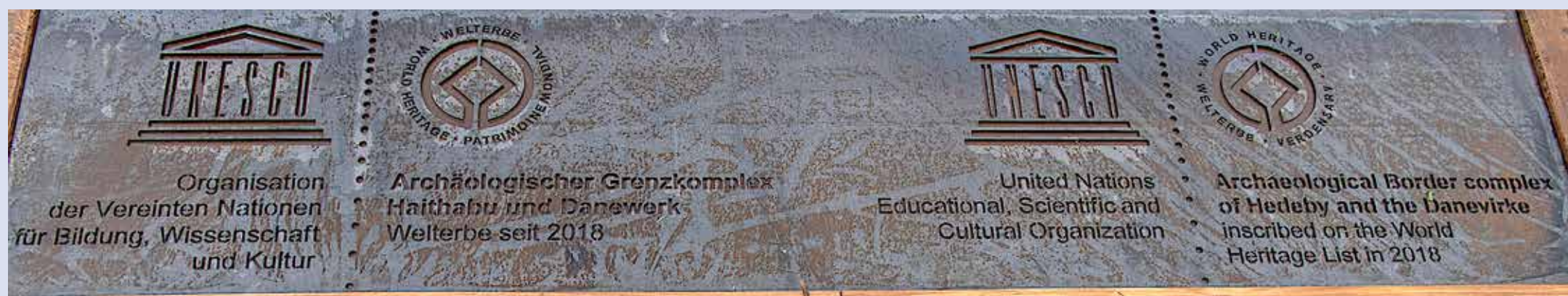
Verdensarv-plaketten, som Dronning Margrethe afslørede på Danevirke i sidste uge.