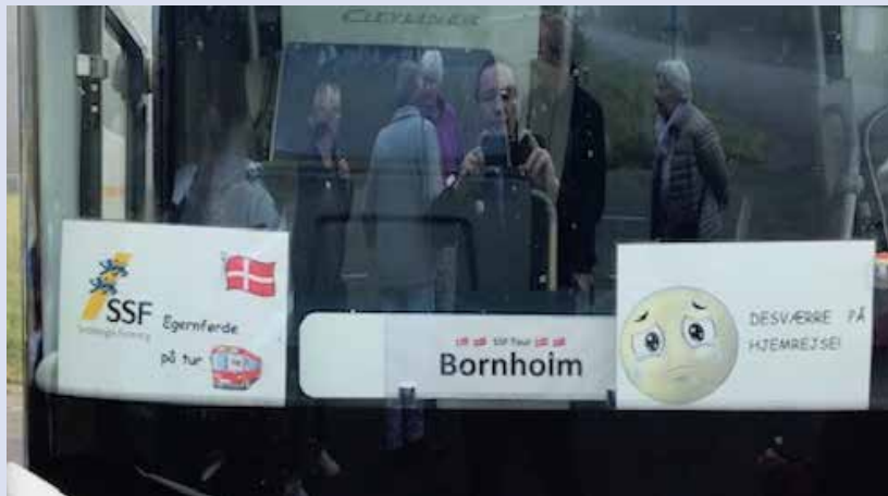
Tydeligt: Det er SSF Egernfærde, der er ude at rejse.

spændende byer, kirker, klippeformationer og ruiner, vandfald og søer, kunst og andet seværdigt. Programmet faldt tydeligvis i deltageres smag og afrundedes med en hylende morsom karaokefest på hotellet inden hjemturen.