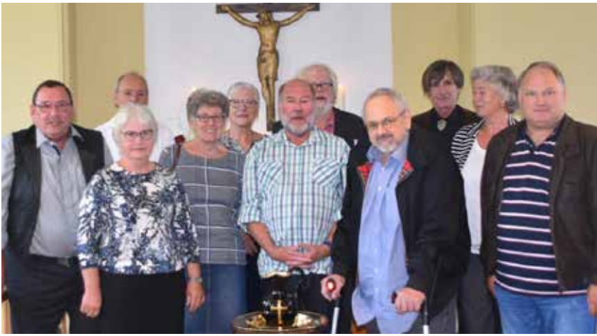
Guldkonfirmander i kirkesalen på Uffe-Skolen.