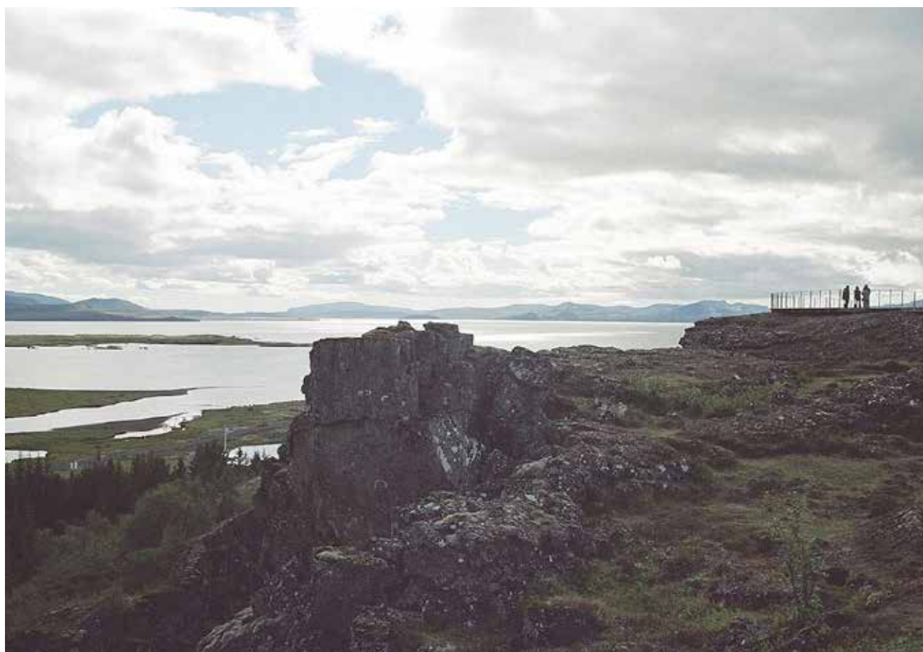
Et af mange programpunkter: Tingvallasøen og Tingvallasletten, den islandske nations fødested.