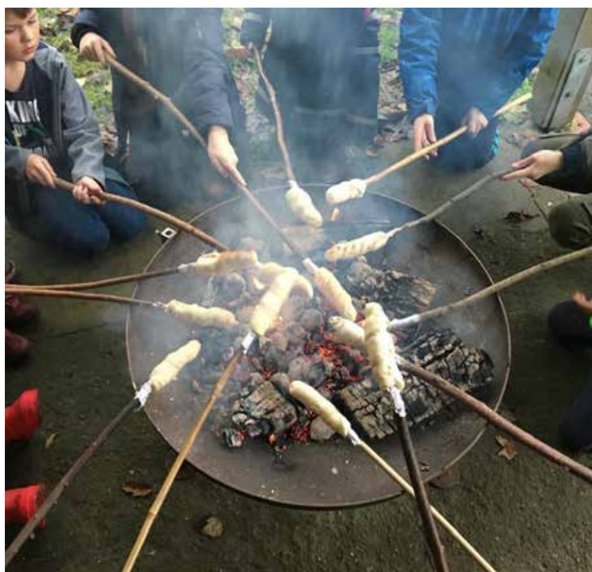
Bål med snobrød og marshmallows.