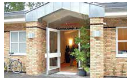
Det Danske Hus i Sporskifte.

Fredslyset fra Betlehem bæres ind, og det første lys i adventskransen tændes. Der serveres kaffe, æbleskiver m.m. Adventskollekten går til de hjemløse i Flensborg.