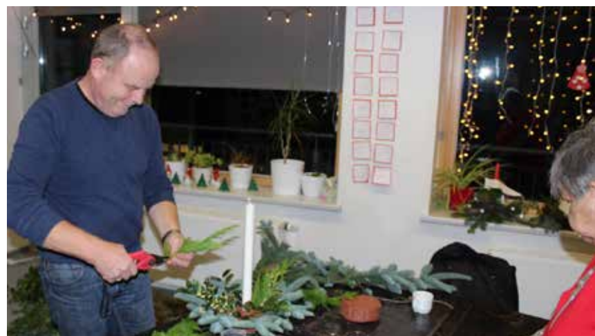
I Bredsted kan man lave sine egne juleting.