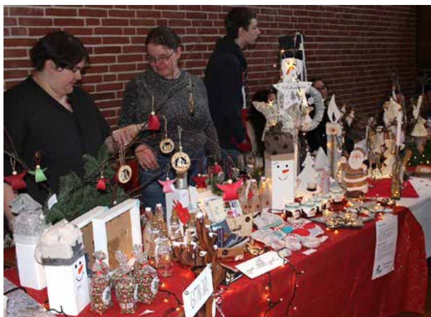
Der var fine ting at finde på bordene.