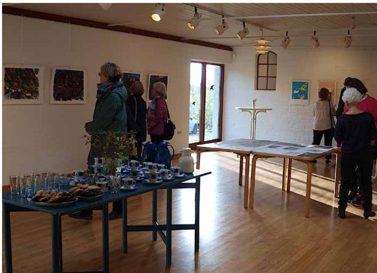
Mikkelberg sælger ud af dublet-beholdningen – i morgen med 10 pct. rabat.