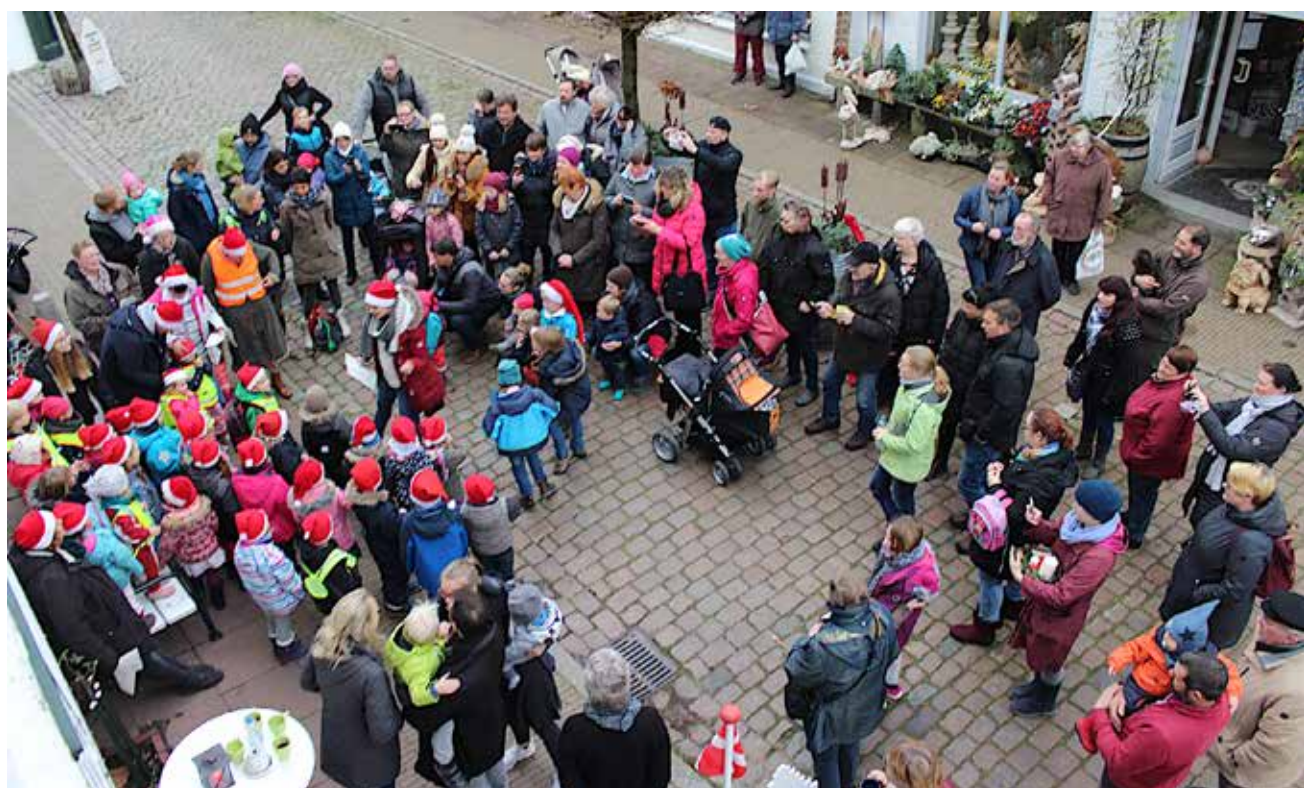
Det er altid et hit, når børnene synger ved Paludanushuset.