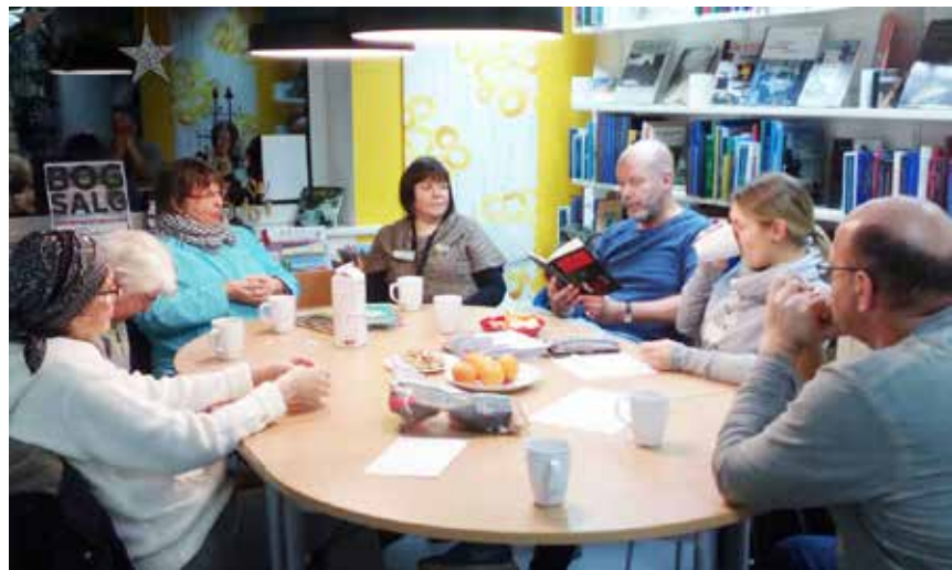
Der hygges, men på let forståeligt dansk.