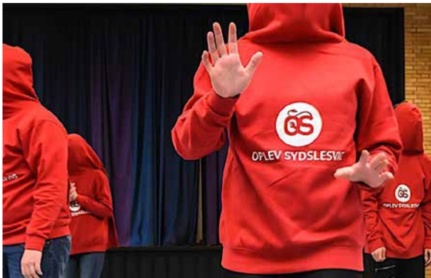
Fra SydslesvigCrew-workshoppen for nylig på Jaruplund Højskole.