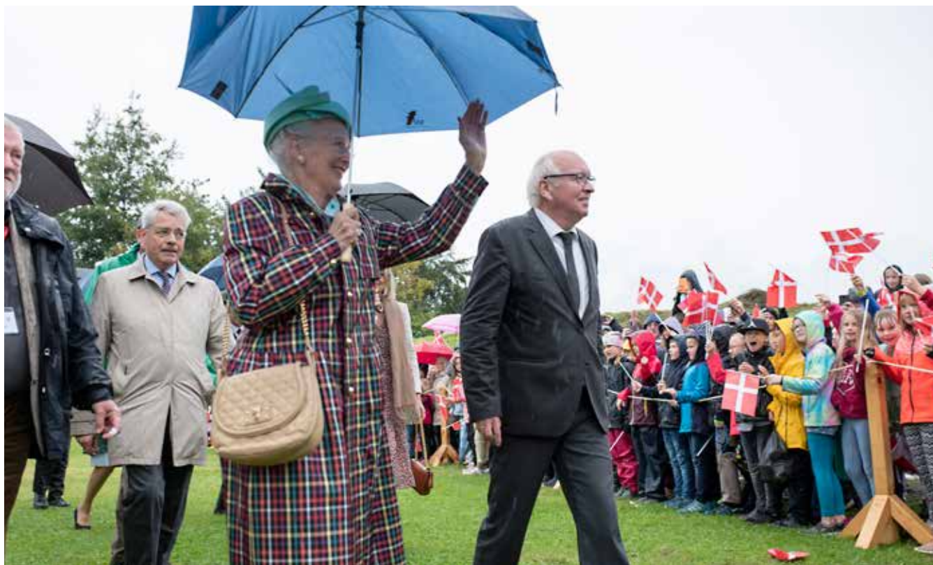
Besøget på Danevirke foregik i silende regnvejr.