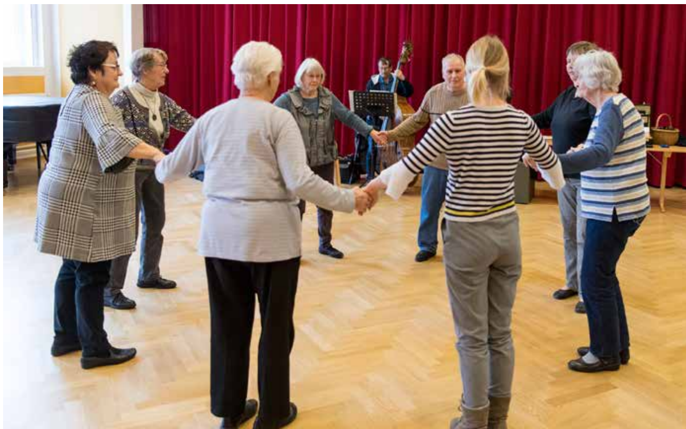
Folkedans er også kandidat til at blive immateriel kulturarv.