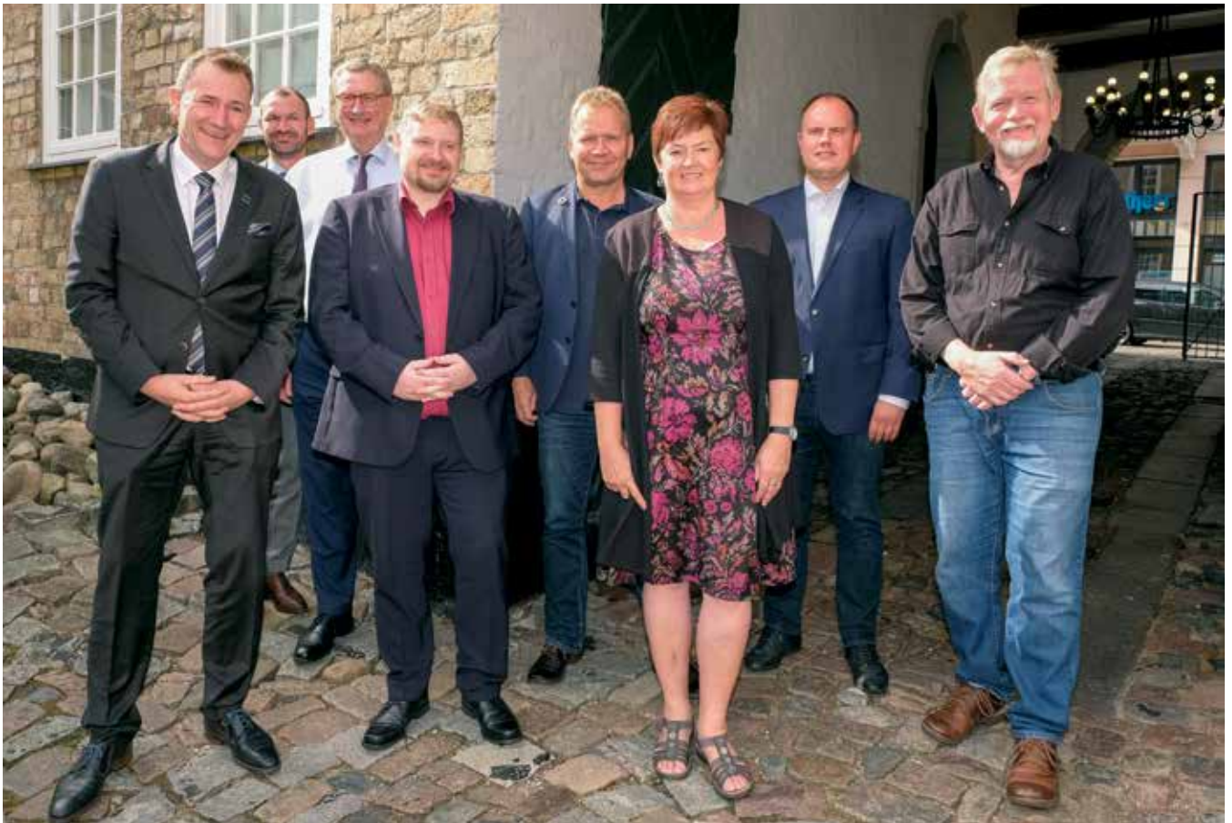
Det nye Sydslesvigudvalg var på tiltrædelsesbesøg i Sydslesvig i starten af november.

Da Folketinget efter valget bestemte det nye udvalg kunne man i starten af juli konstatere, at tre af de hidtidige udvalgsmedlemmer fortsætter, nemlig Anni Matthiesen (V), Christian Juhl (EL) og Martin Henriksen (DF). Nye i udvalget er MFFerne Troels Ravn (S), Karina Lorentzen Dehnhardt (SF) og Niels Flemming Hansen (K) samt folketingskandidat Rune Christiansen (RV). På nær Troels Ravn har de nye medlemmer ikke siddet i udvalget før. Som det har været tilfældet tidligere, omfatter Sydslesvigudvalget i denne omgang også medlemmer, der ikke er medlemmer af Folketinget, nemlig Henriksen og Christiansen.