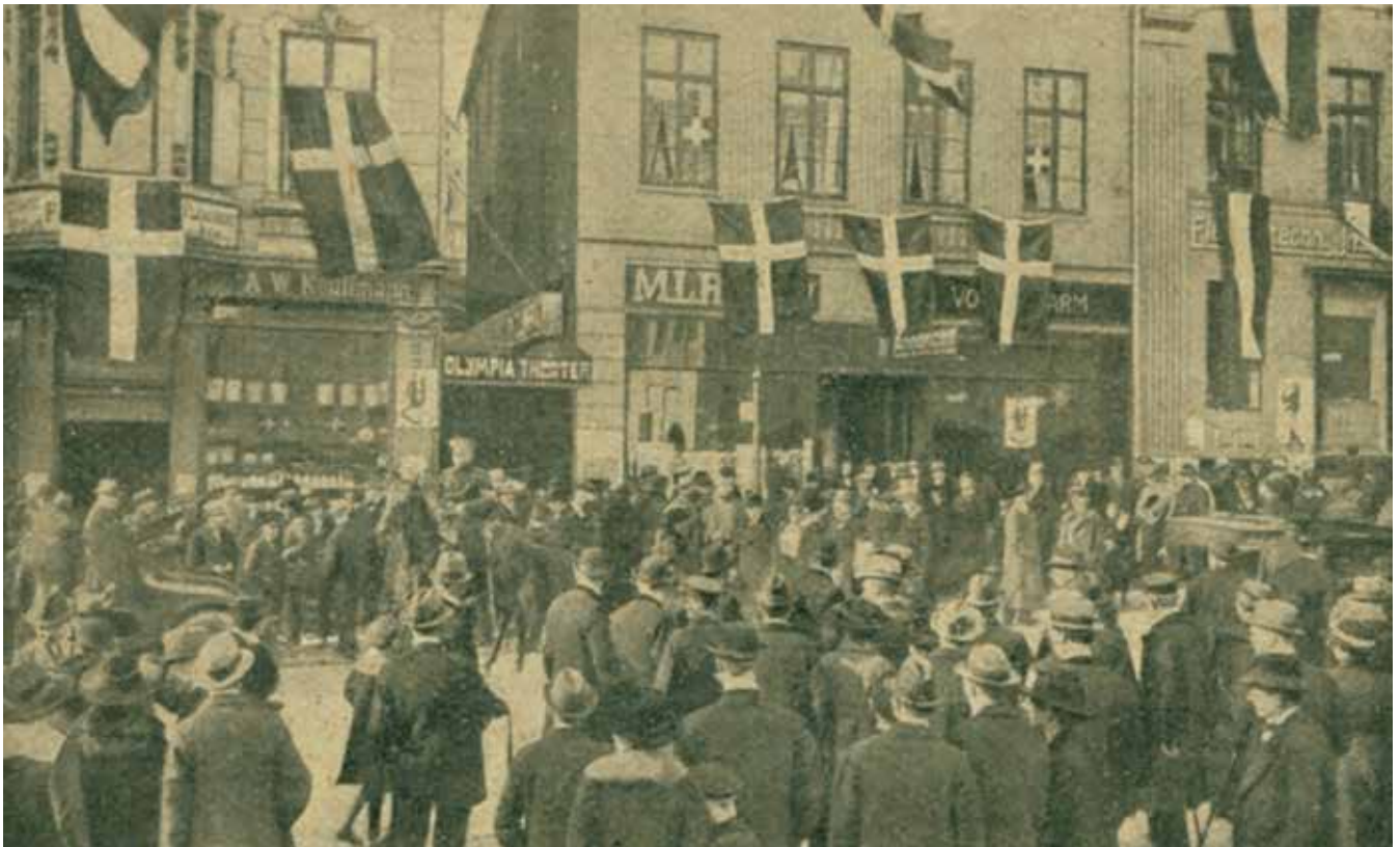
Flensborg Avis var den danske kommandocentral og samlingssted i forbindelse med afstemningerne i 1920.

i det område, de opererede i. Godt hjulpet af, at byens sprog altid helt overvejende havde været tysk, var den danske helstatspatriotisme langsomt ved at blive omdannet til en tysk nationalitet hos de fleste i Flensborg. Mange af de danske arbejdere gik over til det tyske Socialdemokrati.