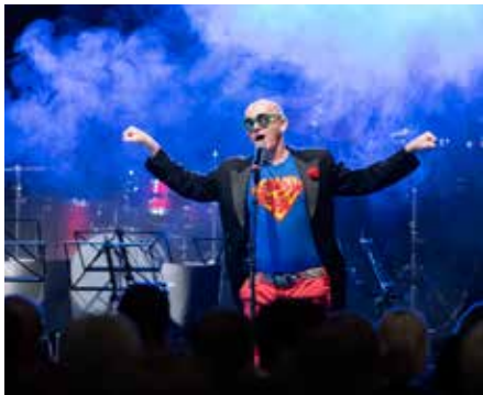
Ved festmiddagen på A. P. Møllerskolen var der underholdning ved Rødkål og Sauerkraut.

Landdagen i Kiel og en Jysk-butik i Flensborg, hvor de dog ikke hedder Jysk, men Dänisches Bettenlager. Besøget omfattede også en festmiddag på A.P. Møllerskolen i Slesvig