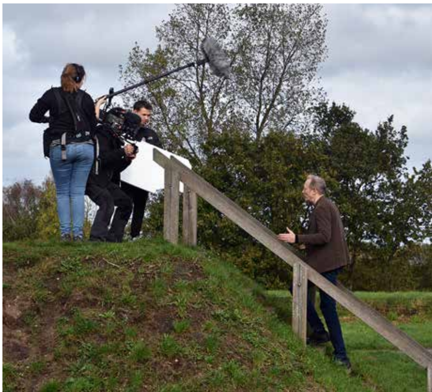
Her kommer Lars Mikkelsen fortællende op ad trappen.

14. oktober fik Danevirke besøg af skuespilleren Lars Mikkelsen og et kamerahold fra Danmarks Radio. Her optog de scener til dokumentarserien Grænselandet, som sendes næste år og som over fire afsnit fortæller om det dansk-tyske grænselands historie. Danevirke, som blev anlagt i år 400-500, og siden er blevet udbygget og forstærket i flere omgange, blev i mange år opfattet som Danmarks Sydgrænse. Den var også i 1864 den sydligste linje, der var bemanded af den danske hær – som dog tog benene på nakken, da preußiske og østrigske tropper nærmede sig. I forbindelse med diskussionerne om grænsedragningen efter første verdenskrig var en bevægelse kaldet