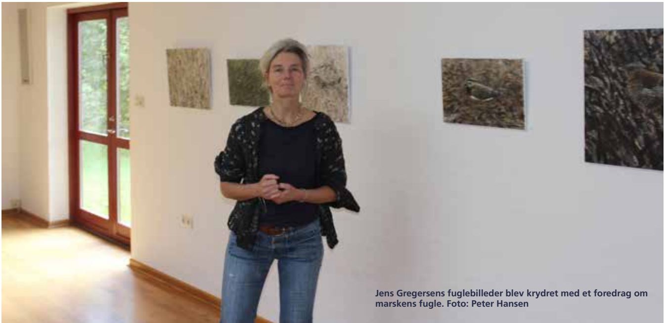
Jens Gregersens fuglebilleder blev krydret med et foredrag om marskens fugle.