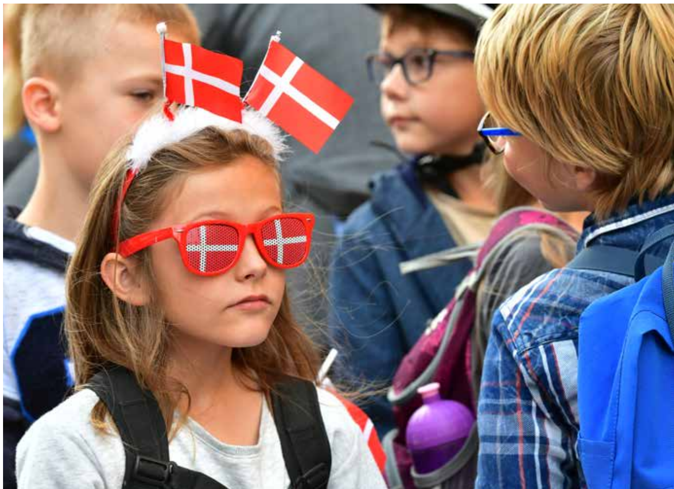
Nogle steder antog hyldesten samme fantasifulde former som ved fodboldmesterskaber.