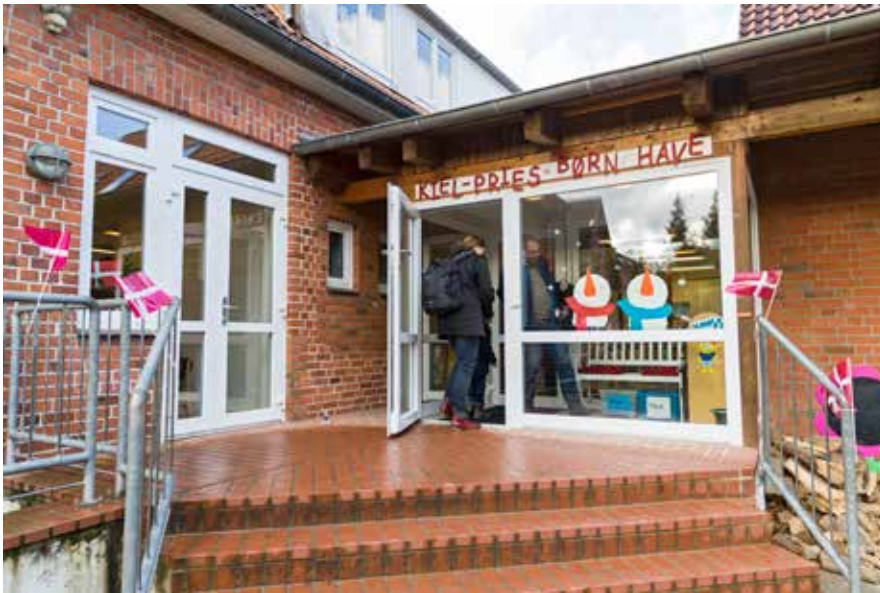
Også de danske skoler og børnehaver i Sydslesvig er en inspirationskilde for overborgmesteren i Slesvig-Holstens hovedstad.