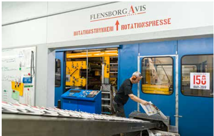
Flensborg Avis har sin egen rotation, der blandt trykker det daglige oplag på lidt under 5000 eksemplarer. Det skulle gerne blive til flere.

Offensiven lige inde i det nye år drejer sig især om de mange tusinde husstande syd for grænsen, der har børn i de danske skoler - men ikke holder avisen. De vil via Dansk Skoleforening få tilsendt informationer om det nye fremstød, og så vil de få tilsendt avisen gratis hver fredag og lørdag.