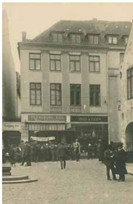
I 1923 erhvervede bladhuset ejendommen Storegade 83-85, der blev hjemstedet indtil 1986.