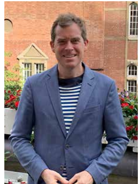
Ulf Kämpfer blev valgt med et komfortabelt flertal ved forrige borgmestervalg og er netop blevet genvalgt.

Ulf Kämpfer går til valg på tre politiske hovedmål, der alle afslører ham som en grøn socialdemokrat: Betalbare boliger, trafikale infrastruktur og klimabeskyttelse.