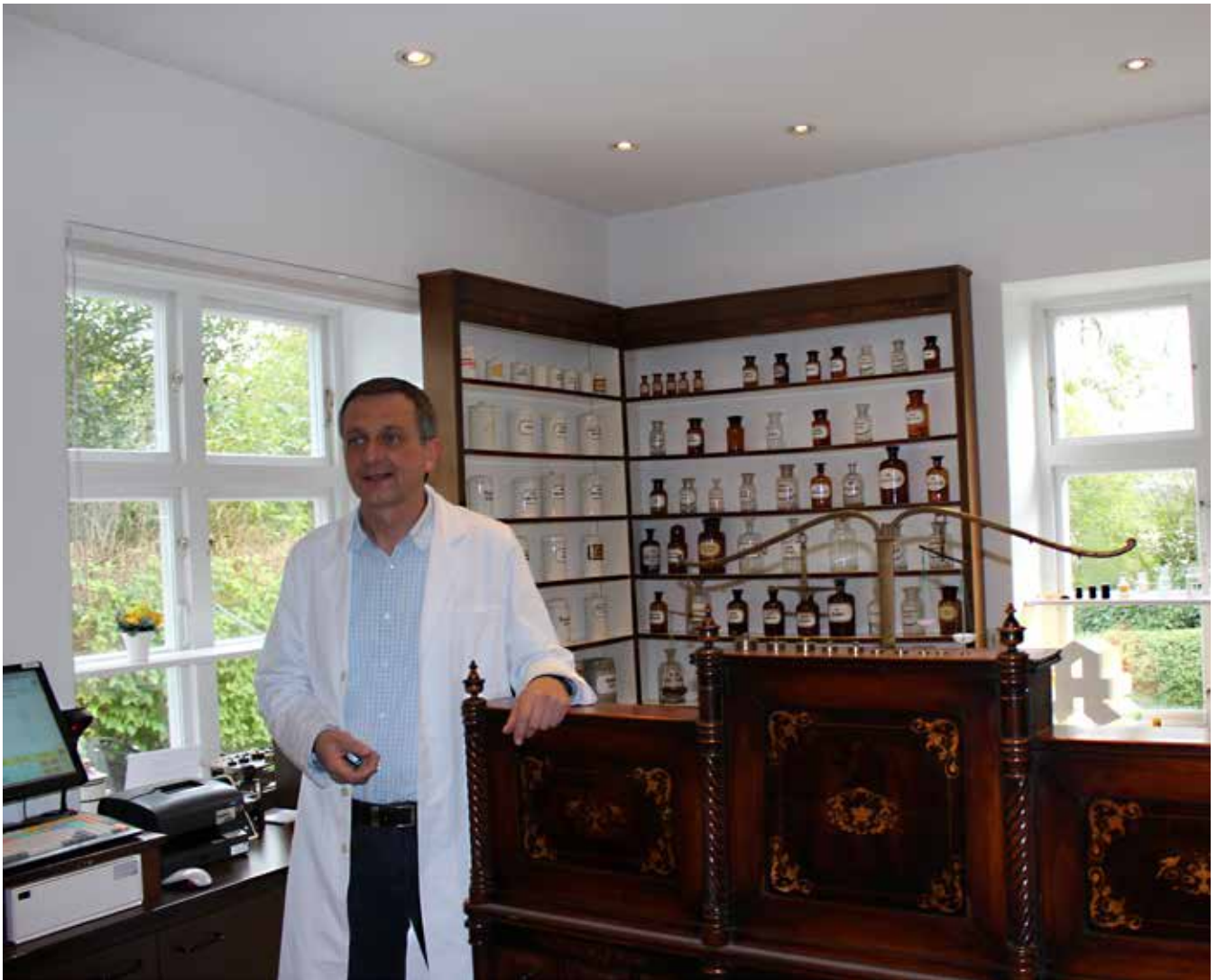
Apoteket står stadig med det oprindelige, håndbyggede interieur.

Notdurft gjorde besiddelsen af det også, at han glædede sig særligt til dronning Margrethes besøg i Sydslesvig for nylig.