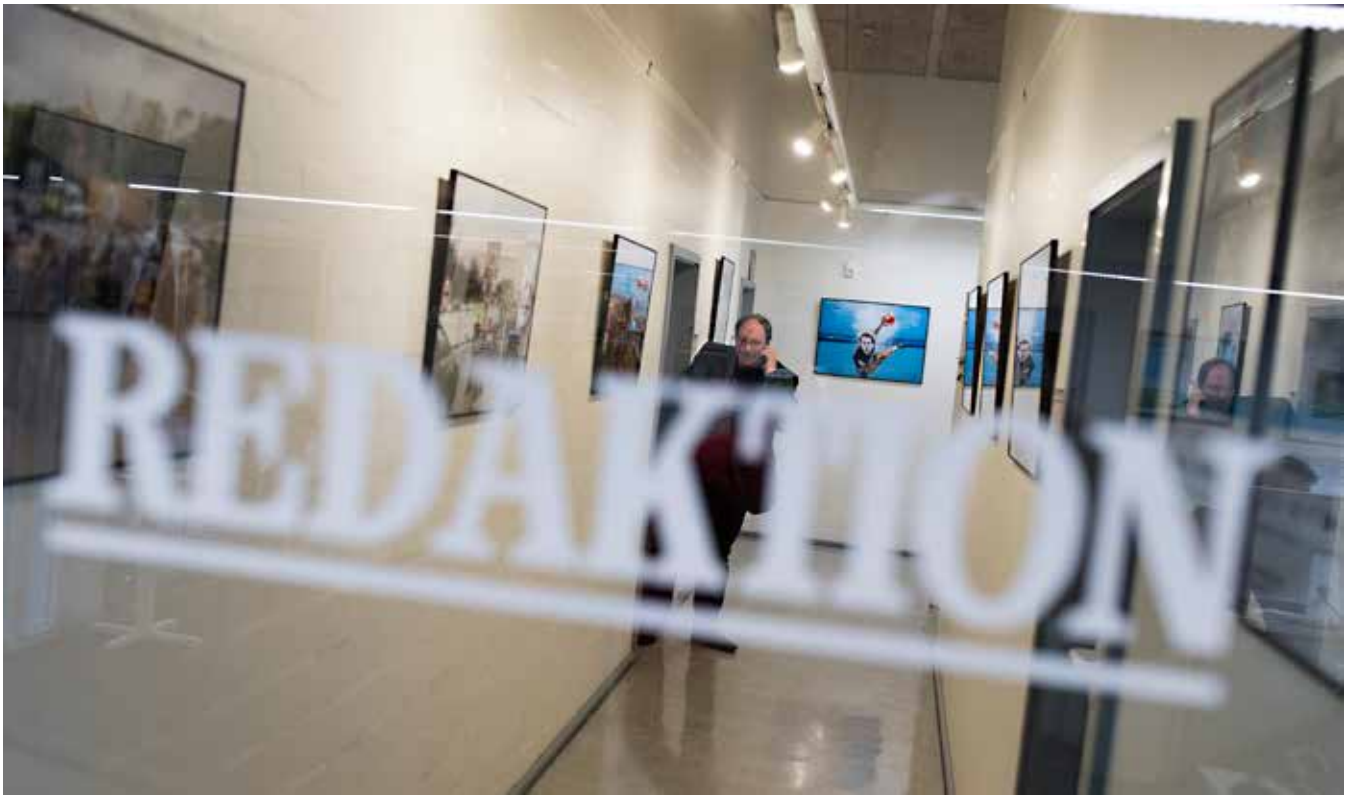
Den aldrende avis har i vore dage et moderne udseende.

og søgte ind i de danske rækker. En overgang nåede oplaget op på 40.000 daglige eksemplarer - men efterhånden som det tyske økonomiske mirakel udfoldede sig, fandt de fleste tilbage til de tyske rækker og læste heller ikke længere avisen. Og på trods af avisens agitation holdt den danske regering fast i, at grænsen lå fast.