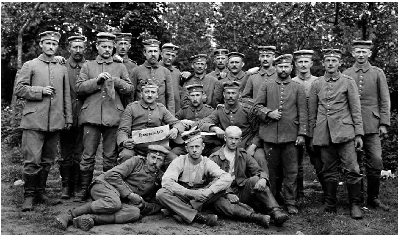
Under Første Verdenskrig havde avisen store problemer, men formåede stort set under hele krigen af få bladene på gaden - og sendt ud til de dansksindede soldater.

Jessen havde haft gode lærlinge, og de sørgede for, at avisen fortsat havde fremgang efter nestorens død. Men de havde ikke nogen let opgave