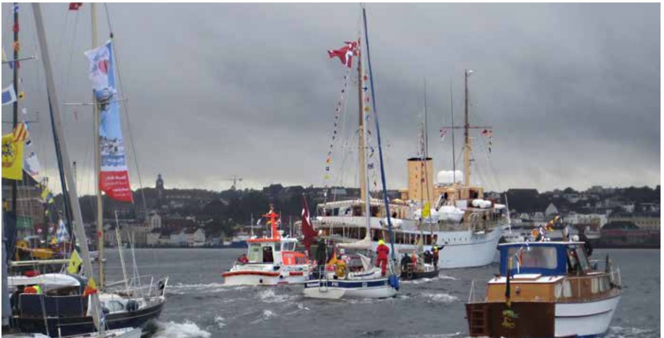
Dannebrog blev fulgt til kajen af en armada på 40-50 både. Mange flagede med Dannebrog, nogle med det sydslesvigske løvebanner. Andre igen havde blot alle signalflag oppe.