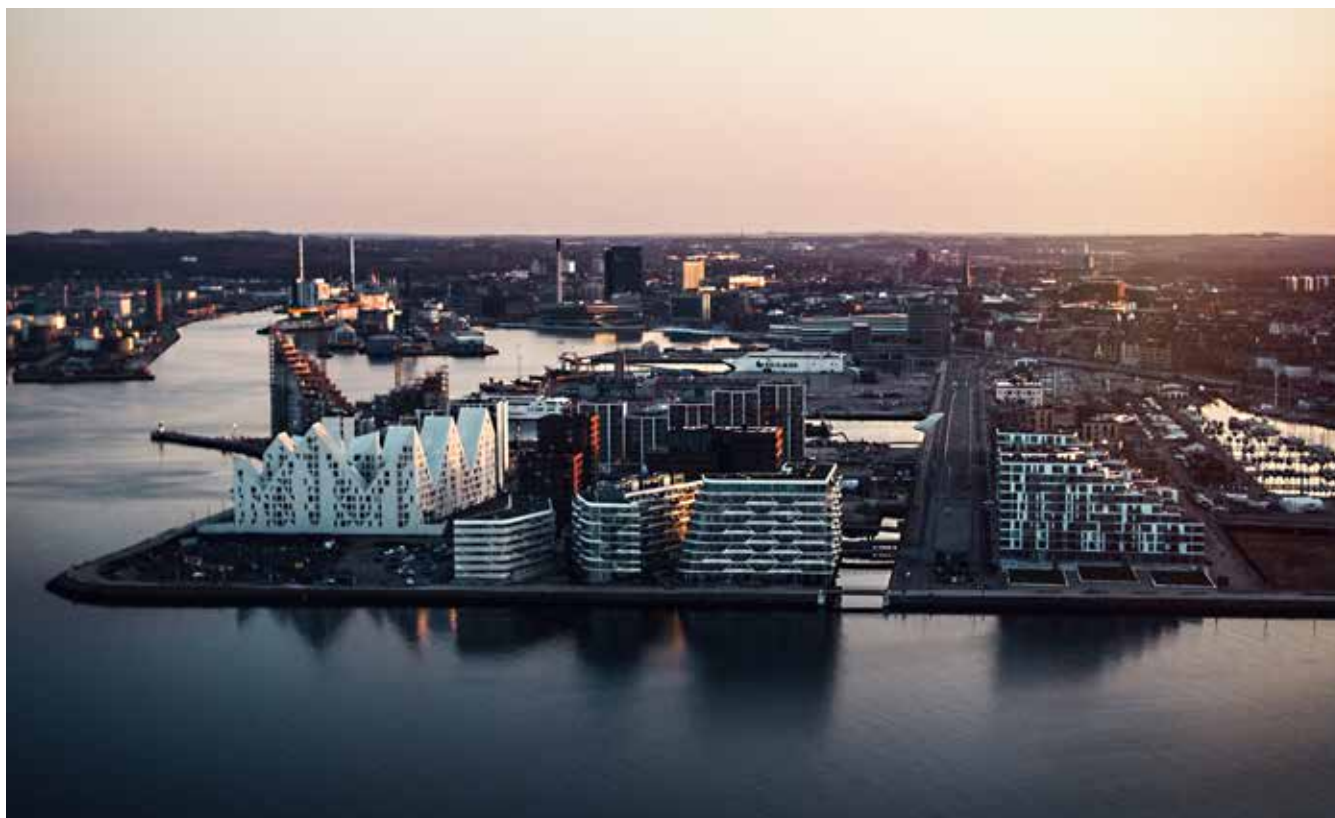
Aarhus er på mange måder 10-15 år foran Kiel, mener Kiels overborgmester.