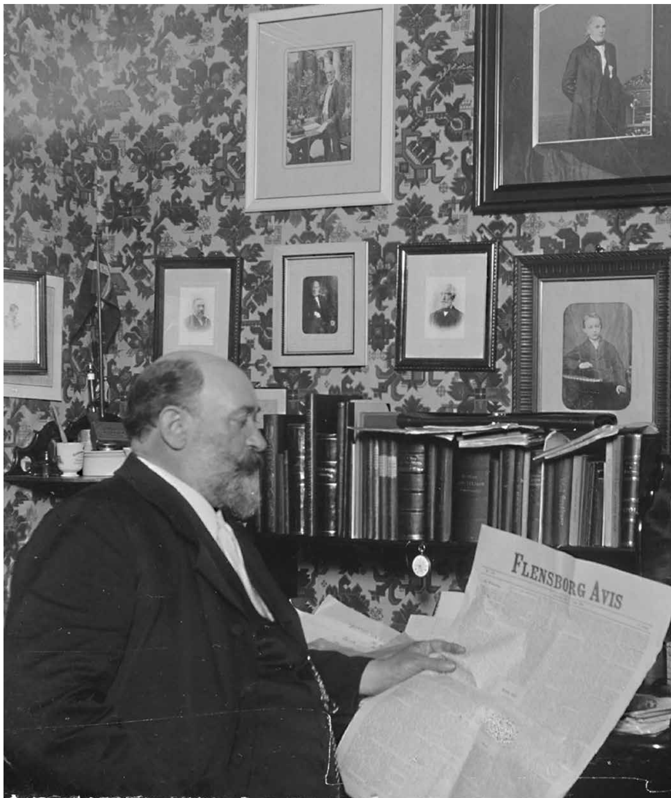
Gustav Johannsen var en af de danske frontfigurer i Flensborg i 1800-tallet og en af mændene bag den nye danske avis i byen i 1869.