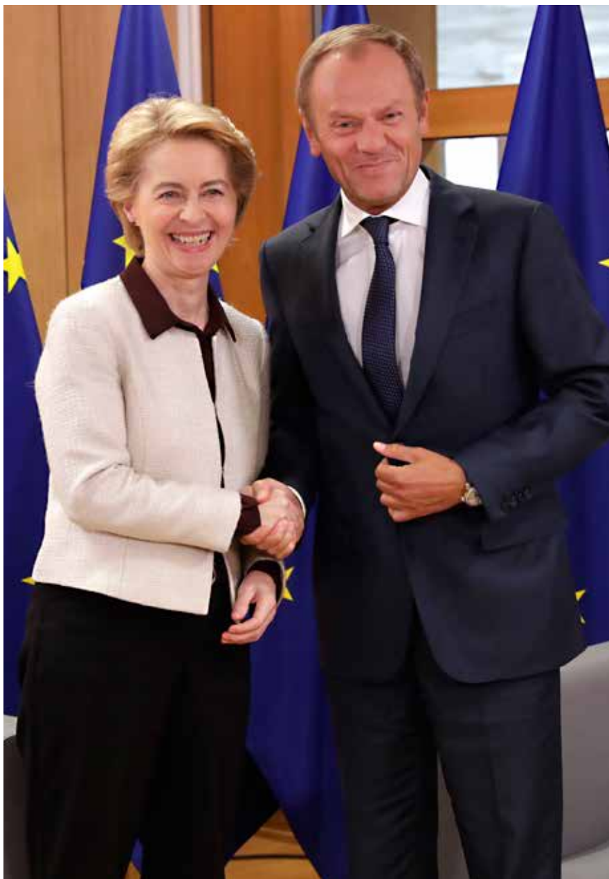
Mindretallene har store forhåbninger til den nye forkvinde for EU-Kommissionen, tyske Ursula von der Leyen, der her ses med den siddende EU-præsident Donald Tusk. Han er for øvrigt kashuber og dermed selv fra et mindretal.

Men det bliver der måske ændret på: Siden 2009 har EU haft en ordning med et »borgerinitiativ«. Her kan man indbringe temaer for