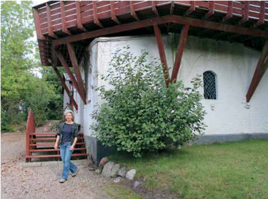
Kunstcentret har til huse i en gammel vindmølle.