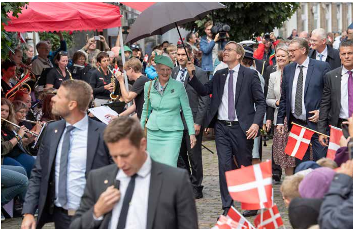
I Frederiksstad var gaderne tæt pakket med folk, der ville hylde monarken.

De fire dage dronningen tilbragte i Slesvig-Holsten havde et tætpakket program. Hun besøgte danske skoler,