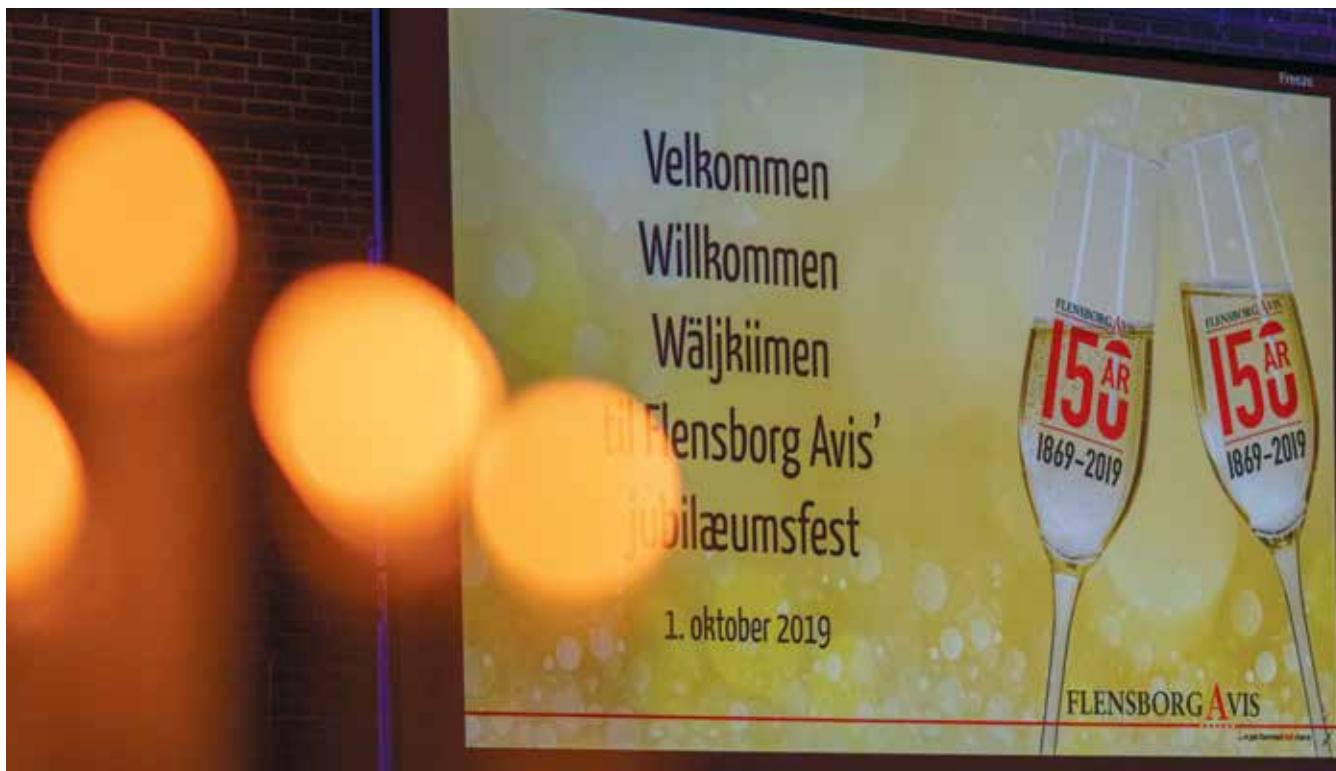
Flensborg Avis' 150 års fødselsdag blev blandt andet fejret med en stor fest, og fødselsdagen har vist, at der er stor opbakning til avisen.