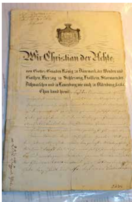
Bevillingen er skrevet på tysk og med gotiske bogstaver. Men underskrevet af den danske konge.

Bevillingen blev i 1855 forlænget af kong Frederik den 7., men hans efterfølger, Christian den niende, havde ingen myndighed at udøve på Stapelholm, som landskabet øst for Frederiksstad hedder.