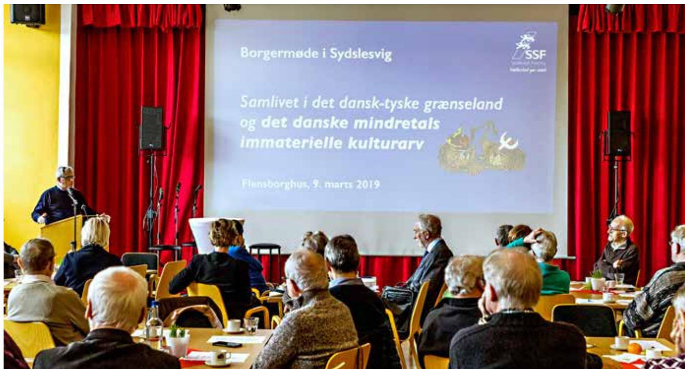
Vejen er målet: Det er en fast del af UNESCOs ansøgningsprocedure, at fællesskabet skal beskæftige sig med ansøgningen og dermed blive bevidst om sin kulturarv. Derfor blev der gennemført flere borgermøder, som her i Flensborg.

Ansøgningen og en ansøgningsvideo, der kort og kontant beretter om det særlige ved den dansk-tyske "model", skal være klar indtil udgangen af året, således at landene kan aflevere den til UNESCO i Paris i marts 2020.