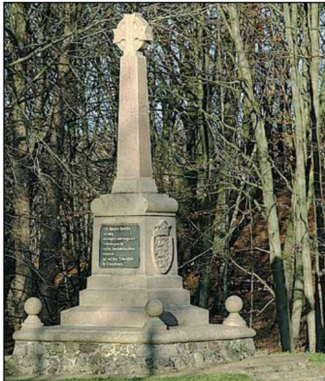
Den Danske Mindestøtte i Sankelmark