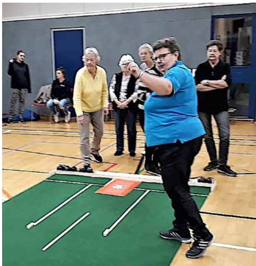
Bowls i Kejtum – 32 ældre var mødt op for at lære noget nyt.