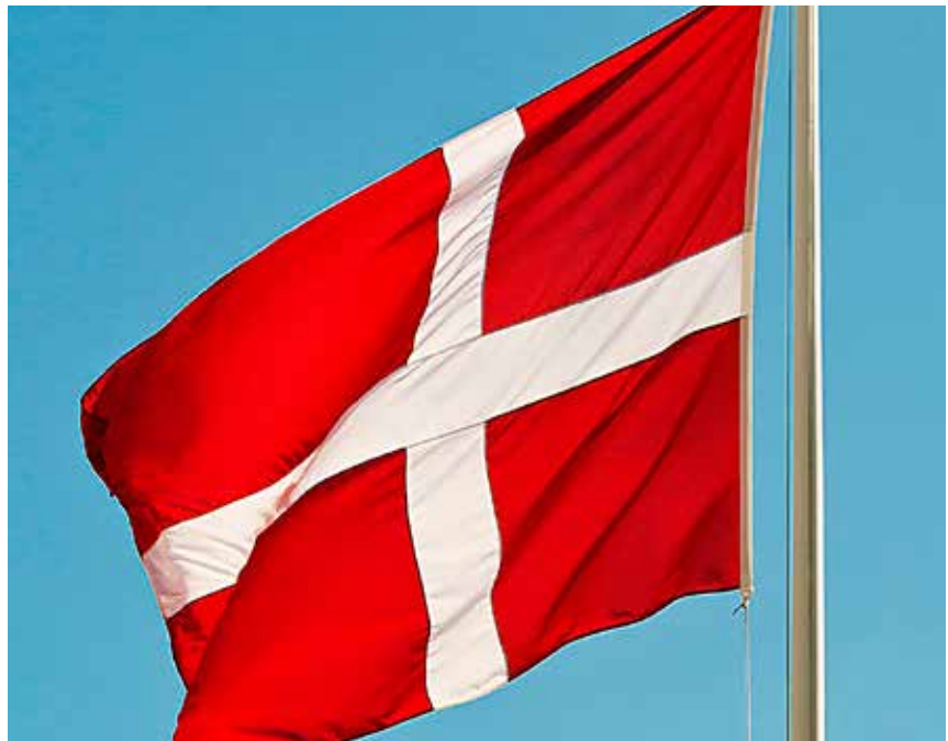
Dannebrogens rolle belyses på et åbent debatmøde 31. januar.