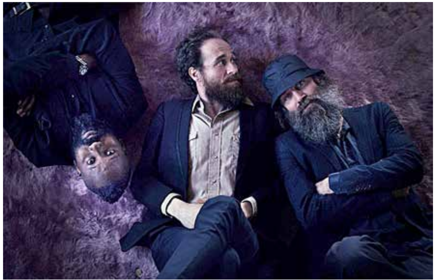
"Hodja" i Kühlhaus i Flensborg på lørdag.

Deres vilde blanding sprudler af kraft, ideer, hooks. Garage-rock, soul, blues og gospel møder hiphop und punkrock. Stilene skifter men bliver holdt sammen af Hodjas enestående sound og reducerede stil. Billetter i forsalg og ved døren. www.kuehlhaus.net