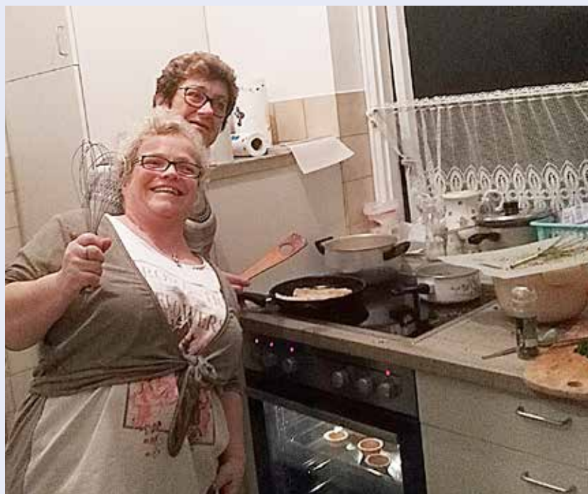
Højt humør – ikke mindst i køkkenet.

Der var stegte rødspætte-filetter med persillesovs, tarteletter med kylling og asparges, sprødt hakkekød fyldt med porre, og hakkebøf med bløde løg. Som dessert fik vi en ymerfromage, som var nem at lave og smagte fremragende. Alt smagte fantastisk, og der var næsten ingen rester tilbage. Tilbage var så blot opvask og oprydning. Nadine