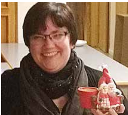
Smil og hygge: Til julkapp med "skrotpakker" i Isted Forsamlingshus.