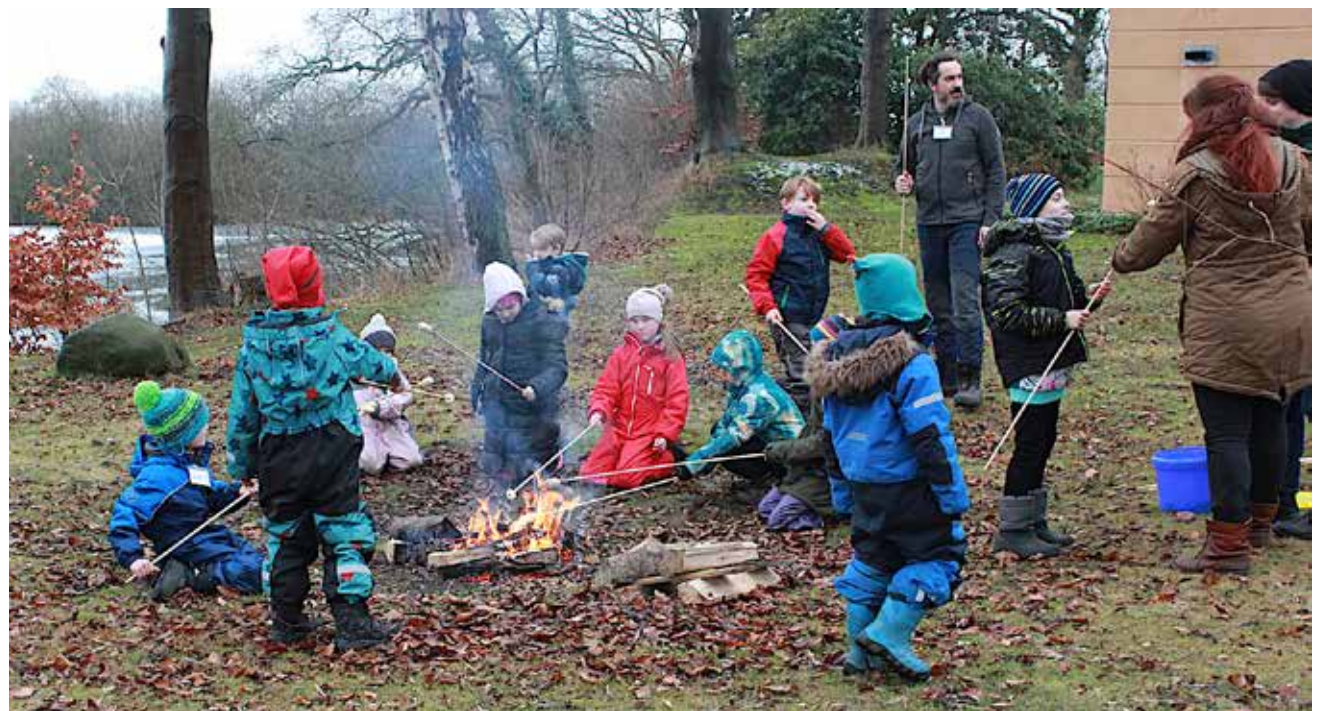
Temaet den 7.-8. marts er "forår", og det bliver bl.a. med lejrbrød.