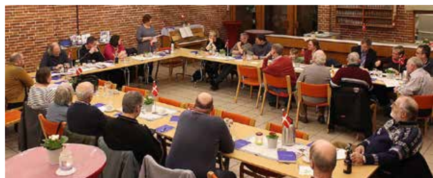
Generalforsamlingen var pænt besøgt, og efter dagsordenen blev folk og hyggede sig med hinanden.