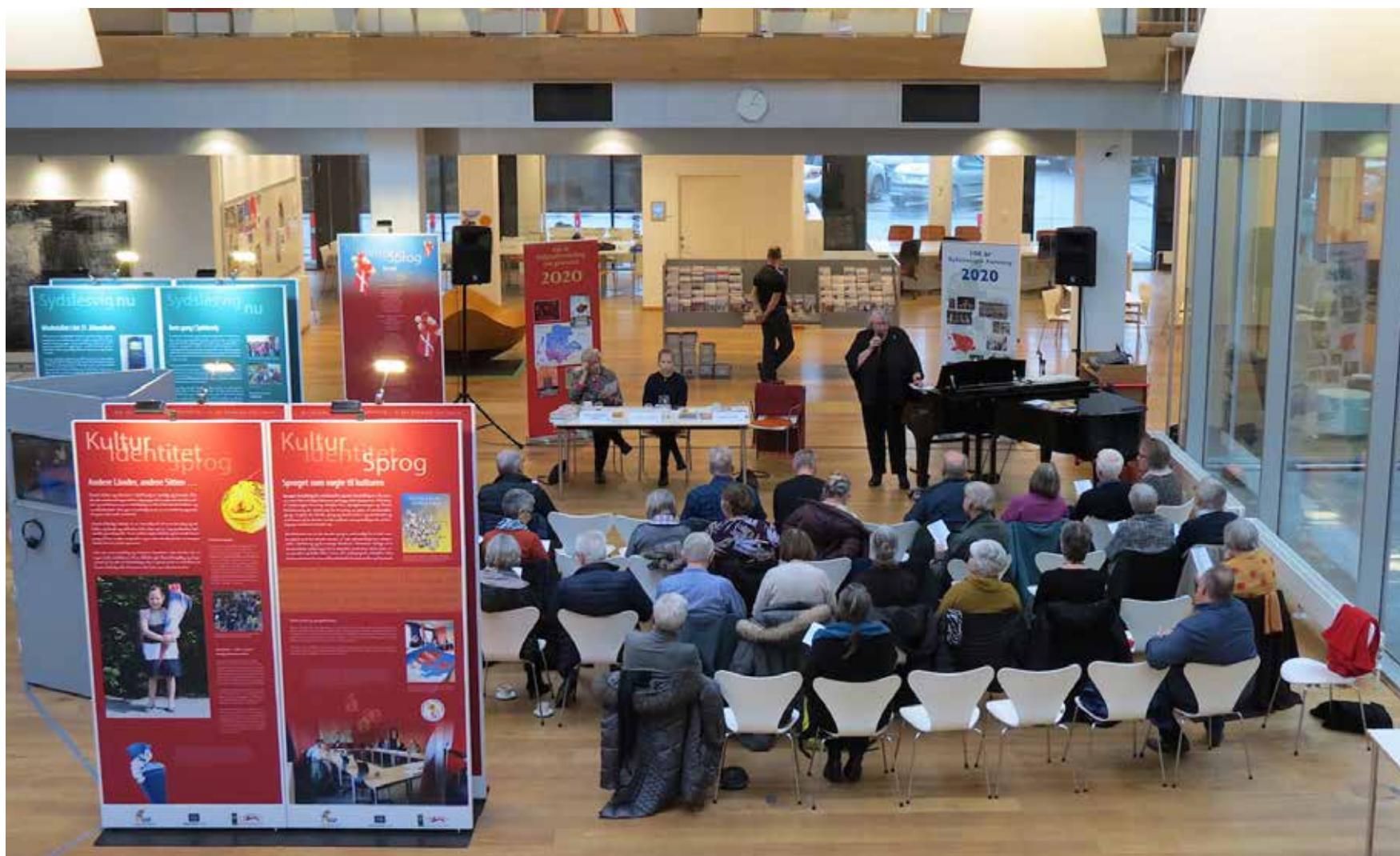
Kolding Bibliotek dannede en flot ramme om udstillingen og dialogmødet.