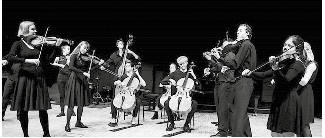
Syddansk Musikkonservatoriums kammerorkester giver koncert ved afstemningsfesten 10. februar på Jaruplund Højskole.