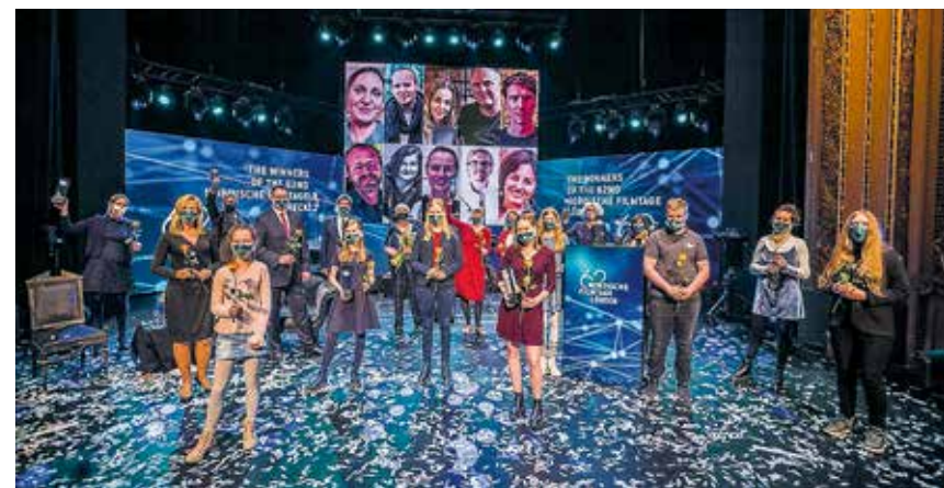
Award Ceremony 2020: Laudatoren und Jurymitglieder mit den zugeschalteten Preisträger:innen.

Eine Lobende Erwähnung geht an: SCHWESTERN – DER SOMMER, IN DEM WIR ALLEINE WAREN“ (Tottori – Sommeren vi var alene), Regie: Silje Salomonsen, Arild Østin Ommundsen, Norwegen