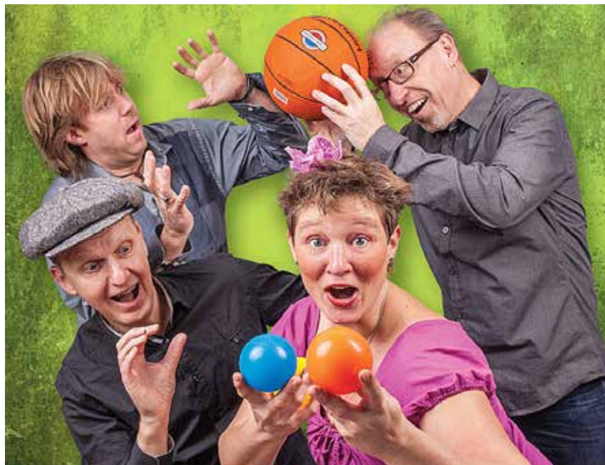
Ann og Aberne giver koncert.