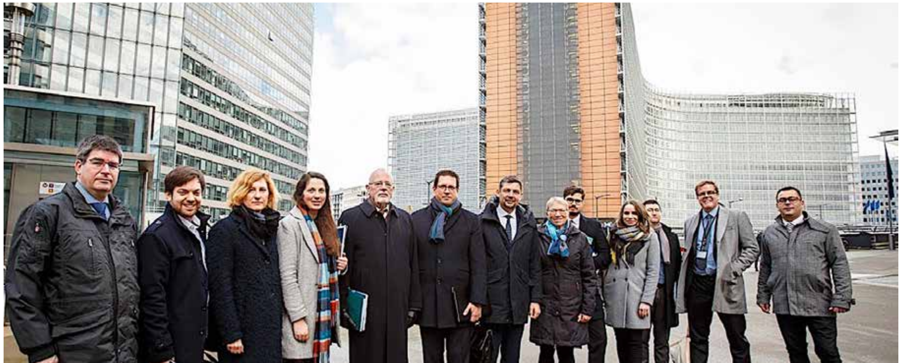
Minderheitenvertreter vorm europäischen Machtzentrum in Brüssel.