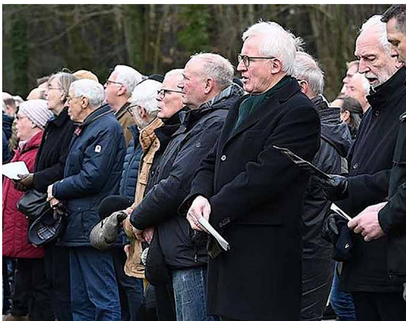
Der var stor interesse for Oversø-Marchen.