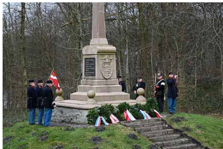
Kranse ved det danske mindesmærke i Sankelmark.