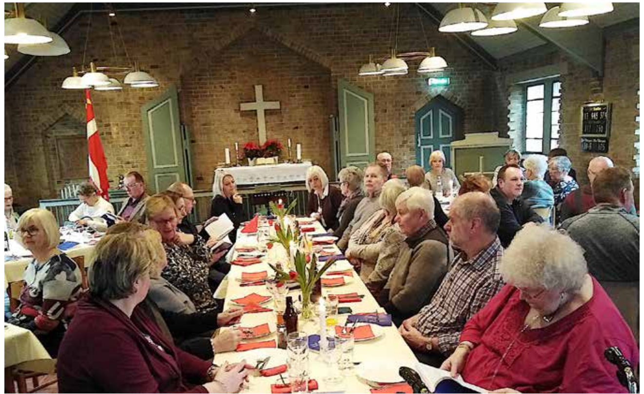
Nogle af deltagerne.