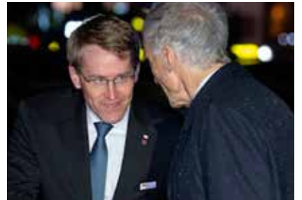
Fhv. minister og ny formand for Det Kgl. Teater, Bertel Haarder, hilser på ministerpræsident Daniel Günther.