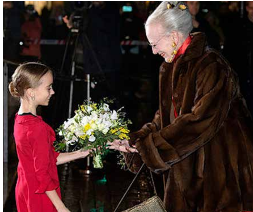
HM Dronningen modtages med blomster foran Det kgl. Teater.