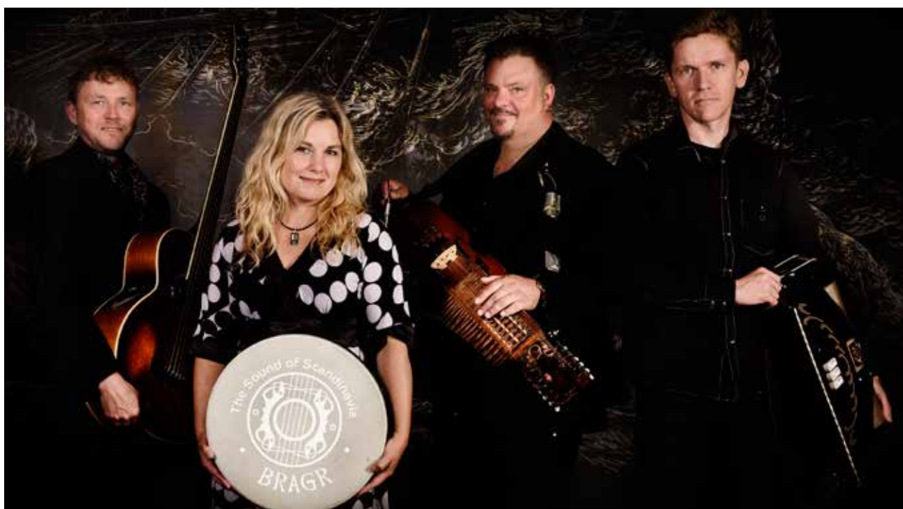
I den nordiske mytologi er Bragr (Brage) guden for skjaldekunst, musik og poesi, og det er det, det handler om for gruppen Bragr: skjaldekunst og musikalsk veltalenhed.