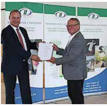
Bevillingen på 150.000 euro overrækkes.