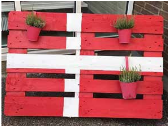
Dekorativ, praktisk og dansk; en palle med plads til flere småkrøker, set i Egernførde.