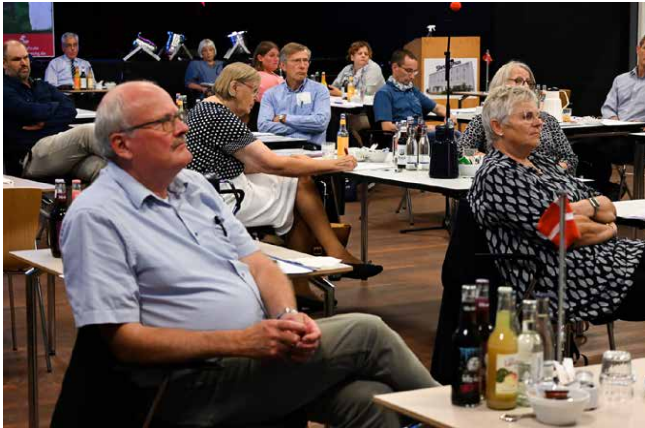
I hovedstyrelsen lyttes der intenst.