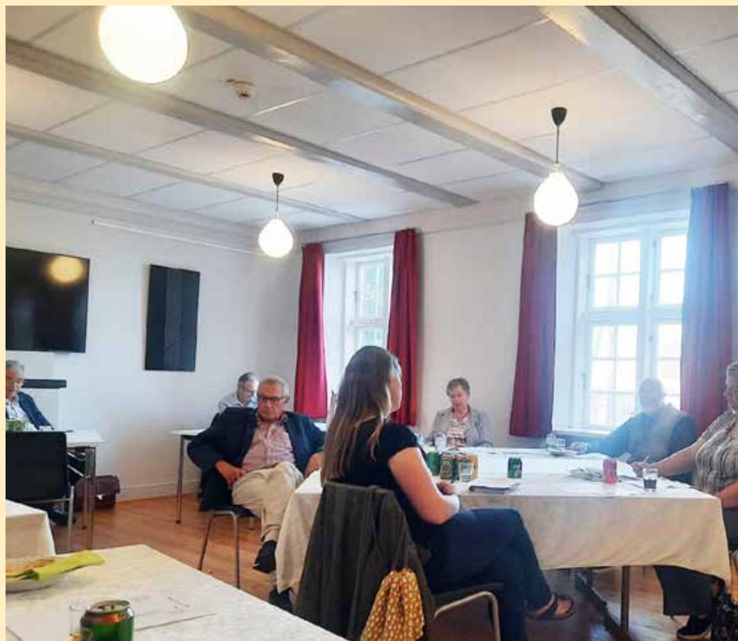
God afstand mellem deltagerne i SSF Ejderstedts amtsgeneralforsamling i Skipperhuset i Tønning forleden.