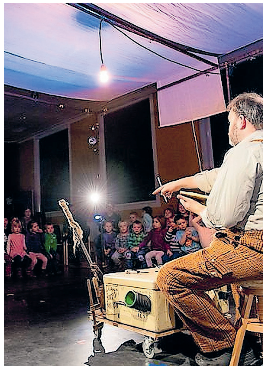
Fysisk børneteater aflyst indtil videre, men endnu i dag kan to forestillinger livestreames i børnehaver og skoler.