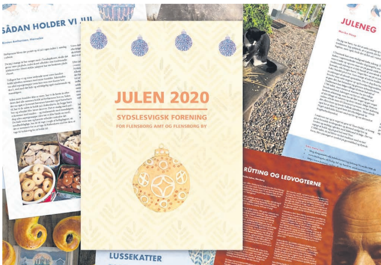
Julehæfte 2020 SSF