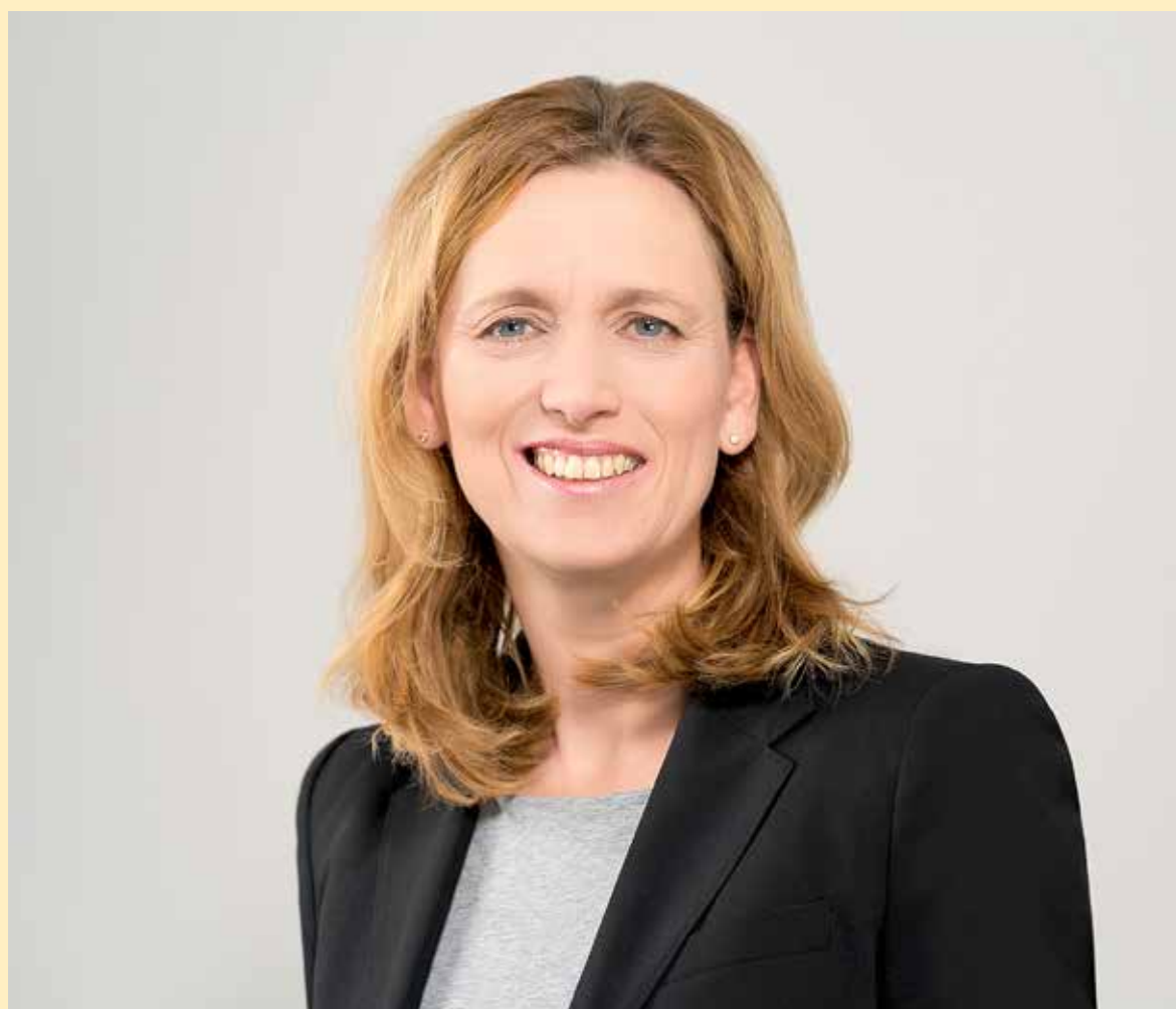
Karin Prien, Ministerin für Bildung, Wissenschaft und Kultur des Landes Schleswig-Holstein.