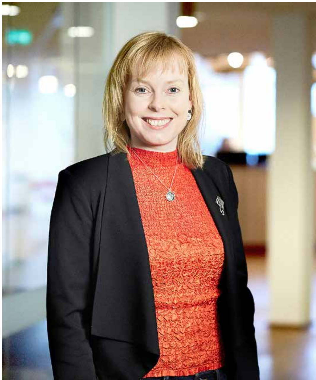
Joy Mogensen, kulturminister &amp; kirkeminister.