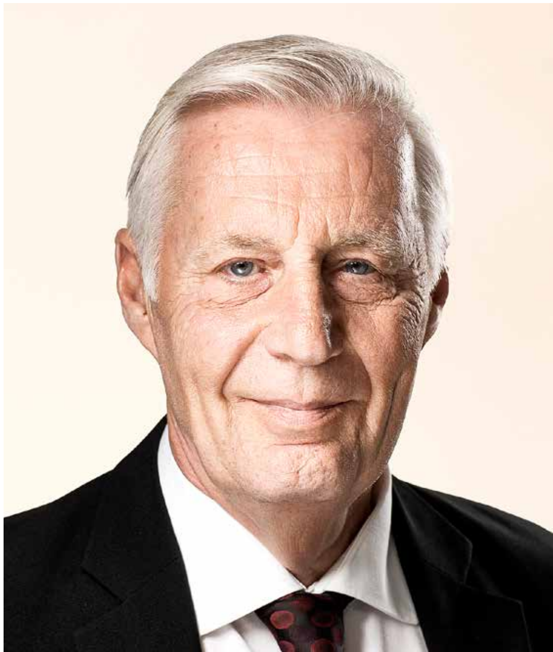
Henrik Dam Kristensen, formand for Folketinget