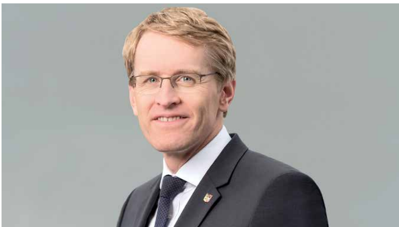
Daniel Günther, Ministerpräsident des Landes Schleswig-Holstein.

Daniel Günther, Ministerpräsident des Landes Schleswig-Holstein