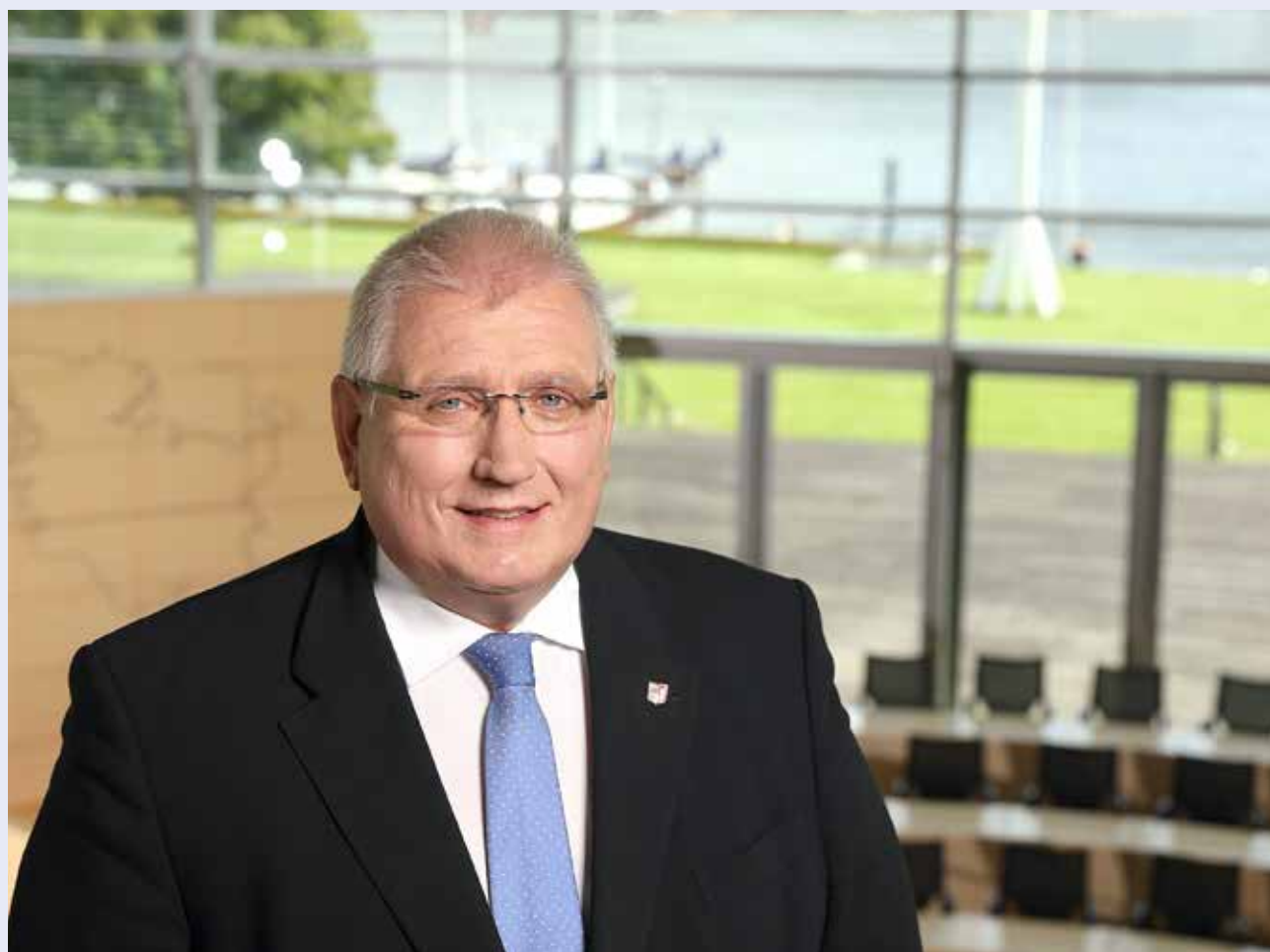
Klaus Schlie, Præsident des Schleswig-Holsteinischen Landtages.