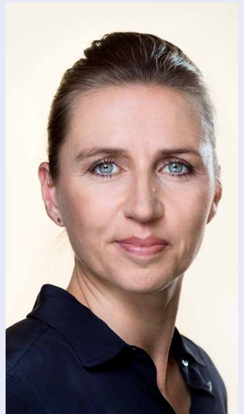
Mette Frederiksen, Statsminister