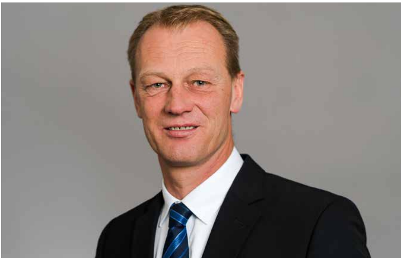
Johannes Callsen Mdl, Beauftragter des schleswig-holsteinischen Ministerpräsidenten in Angelegenheiten nationaler Minderheiten und Volksgruppen, Grenzlandarbeit und Niederdeutsch