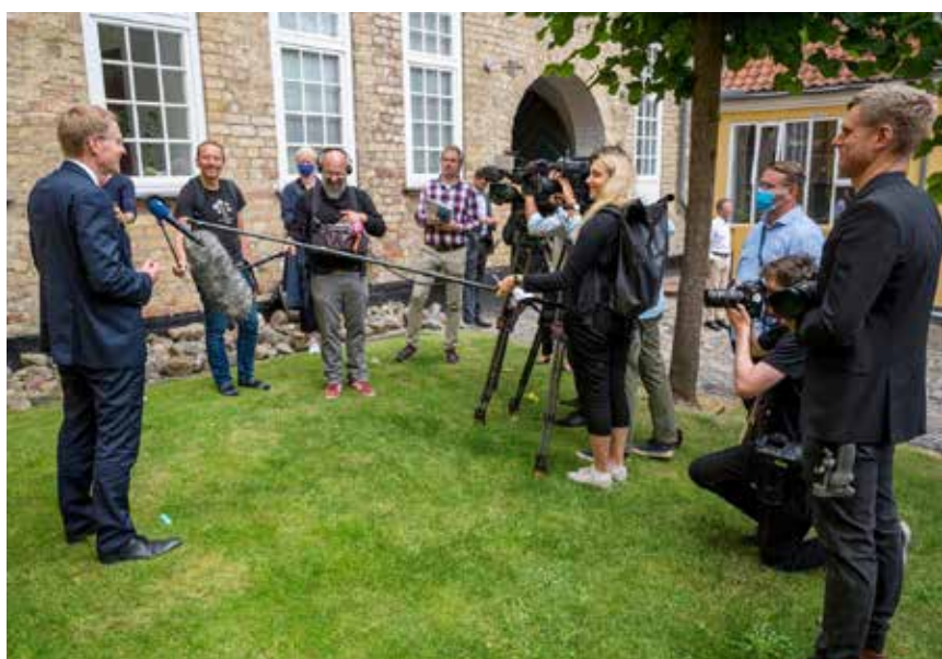
Når politiske VIPs som her ministerpræsidenten gæster Flensborghus, er pressen der også.

Efter besøget på Flensborghus gik turen videre til blandt andet også Duborg Skolen og forskningscentret ECMI.