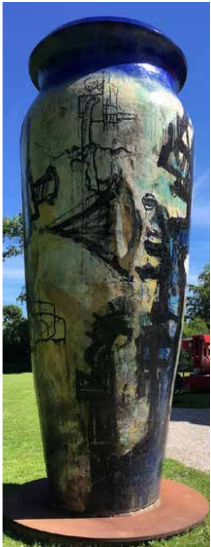
Keramik så det batter: en kæmpevase foran keramikmuseet.

Bemærk: Arrangøren holder sig til de regler, der gælder på rejsens tidspunkt i de pågældende lande. Føler