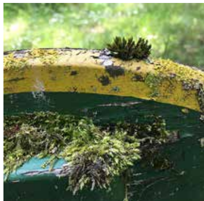
En gyngende — et "spor på Mikkkelberg".

Udstillingsperiode 6.9.-1.11.2020 Kunstnerophold 31.8.-6.9.2020 Åbningstider: Ma-on 9-13, tor 11-16, fre-søn 13-17