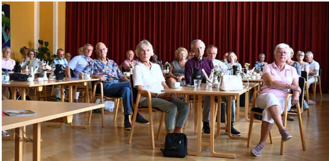
Det er en alvorlig sag at blive orienteret om det danske mindretal i Sydslesvig; her: Medlemmer af Udenrigsministeriets Pensionistforening i salen på Flensborghus.