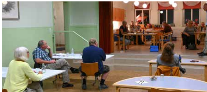
God afstand...