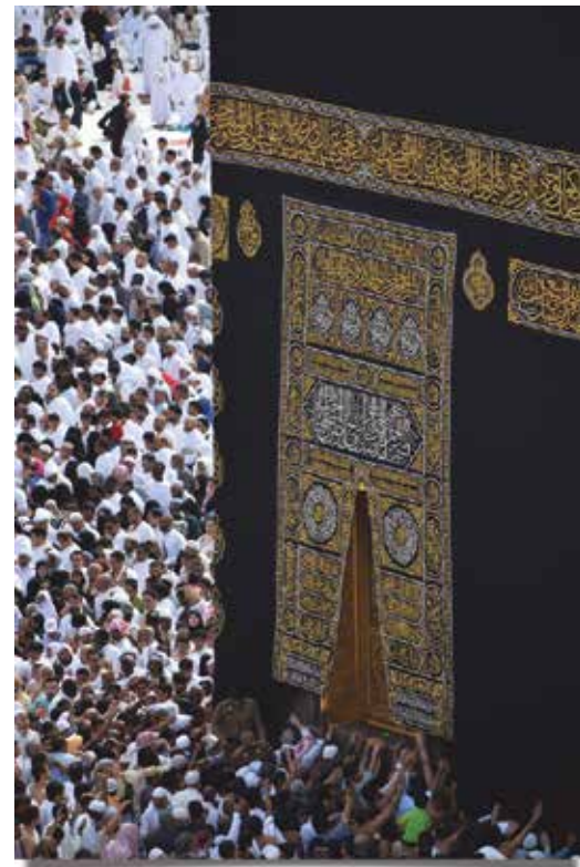
Muslimske pilgrimme i Mekka

fejrer på forskellige måder inden for forskellige retninger i Islam; fx med faste, bøn og besøg i moskeen.