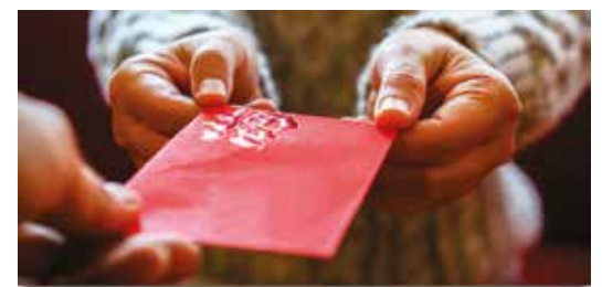
Kinesisk nytårs gave: En rød kuvert med penge

Også i Kina er der forskellige traditioner som varierer fra sted til sted, og man ser flere steder en blanding af nye og gamle traditioner, fx kristne eller muslimske islæt blandet