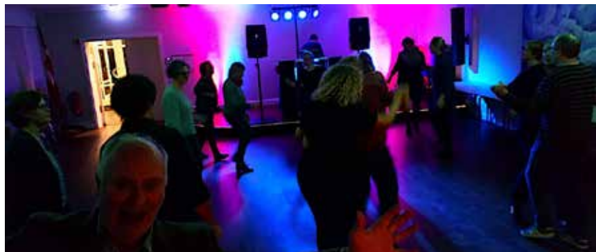
Glade ansigter og et dansevildt publikum.

Glade ansigter og et dansevildt publikum prægede torsdag sidste uge SSF Slesvigs 2. afterwork-aften. Det er et nyt tiltag, som allerede nu ser ud til at blive noget, som folk er glade for. Omkring 35 mennesker var mødt op, klar til at afslutte torsdag aften på dansegulvet i Slesvighus fremfor på sofaen. DJ Pflaumi sørgede for dansemusik til enhver smag og lokkede publikum på dansegulvet. Desuden var der plads til hygge-snak over et glas øl, med kendte og ukendte mennesker: arbejdskolleger, foreningskammerater, håndboldmodere, naboer eller en næsten komplet SSF-distriktsbestyrelse. På kryds og tværs var man enige om,