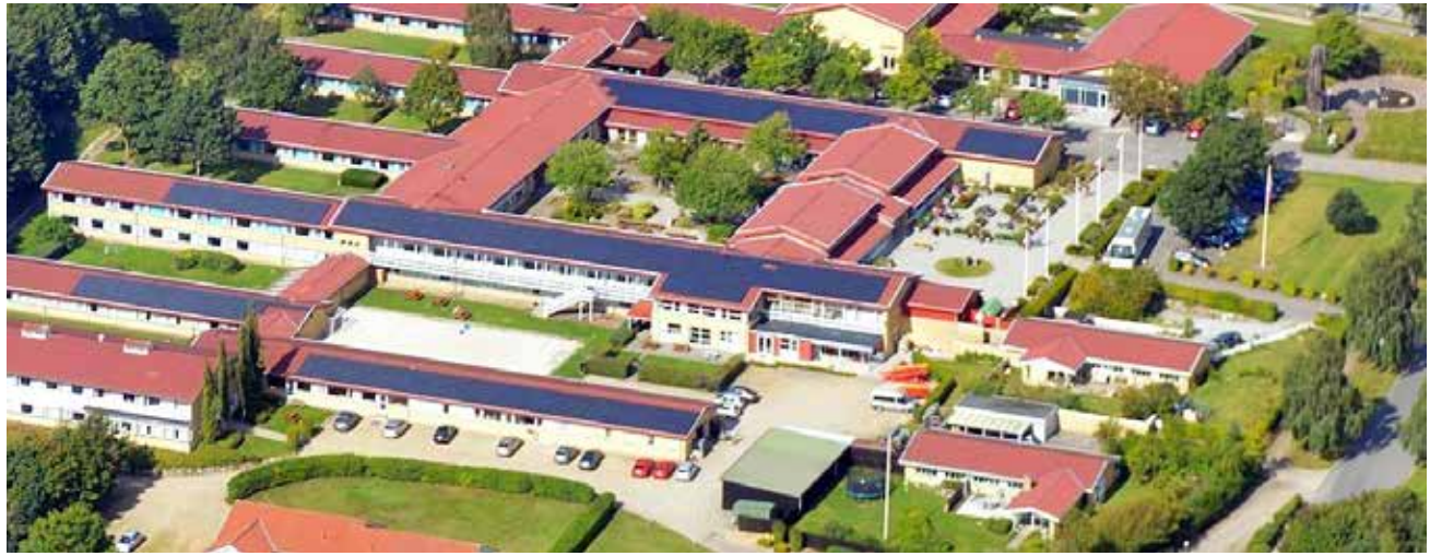
Nørgaards Højskole.