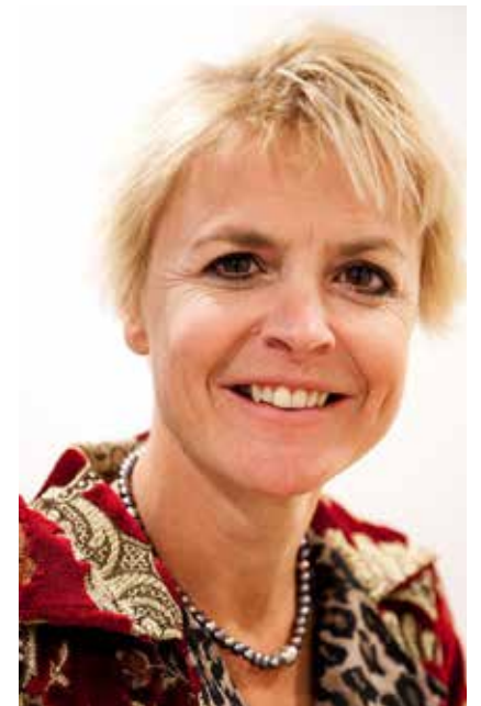
Lykke Friis i Borgerforeningen i aften.

Alle er velkommen, når foreningerne Borgerforeningen og Dansk Erhvervsforening i aften, torsdag, indbyder til foredrag med direktøren i Tænketanken Europa, cand. scient. pol. Lykke Friis kl. 19 i Restaurant Borgerforeningen i Flensborg. Hun taler om "Danmark i Europa". Det sker bl.a. med baggrund i hendes virke som forskningschef ved Dansk Udenrigspolitisk Institut, som prorektor for Københavns Universitet, som klima- og energiminister og som Berlingskes korrespondent i Berlin. Mødet indledes med spisning (rødspættefilet), som man skal være tilmeldt til via værten på 0461 23385. Selve foredraget starter ved 19.45-tiden.