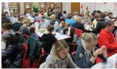
VUI-lotto – et tilløbsstykke; i år med plads til alle i Kejtumhallen 8. februar.