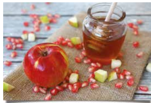
Æbler og honning er en traditionel del af den jødiske nytårsfejring

punktet for nytår, ser det anderledes ud i den jødiske tradition. Her har vi i øjeblikket år 5780 efter verdens skabelse, og man fejrer Rosh Hashana både som nytår og som en påmindelse om Guds skaberværk. Fejringen begynder 163 dage efter den første dag i påsken, og højtiden ligger derfor typisk i slutningen af september eller begyndelsen af oktober. I år begynder det jødiske nytår d. 19. september. Dagen markeres ved at der blæses i vædder-horn, man samles i synagoger hvor liturgien i særlig grad handler om at opfordre til at man angrer sine synder, og mange steder samles man ved vandløb og beder bønner om tilgivelse mens man symbolsk lader synde blive båret væk af det strømmende vand. Herefter samles familier i deres hjem og spiser en række traditionelle delikatesser bl.a. æbler dyppet i honning, fiskehoveder, brød, granatæbler, syltetøj og vin. Fejringerne varer to dage og indleder Tishrei; en periode der varer dele den første måned af året. Undervejs i Tishrei fejres også Forsoningsdagen, den mest betydningsfulde heligdag i jødedommen, og Sukkot, Lovhyttefesten, som minder om Israels ørkenvandring.