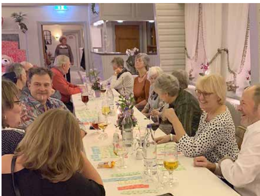
Glade øboere til fest på fastlandet, (Foto: Lars Petersen)