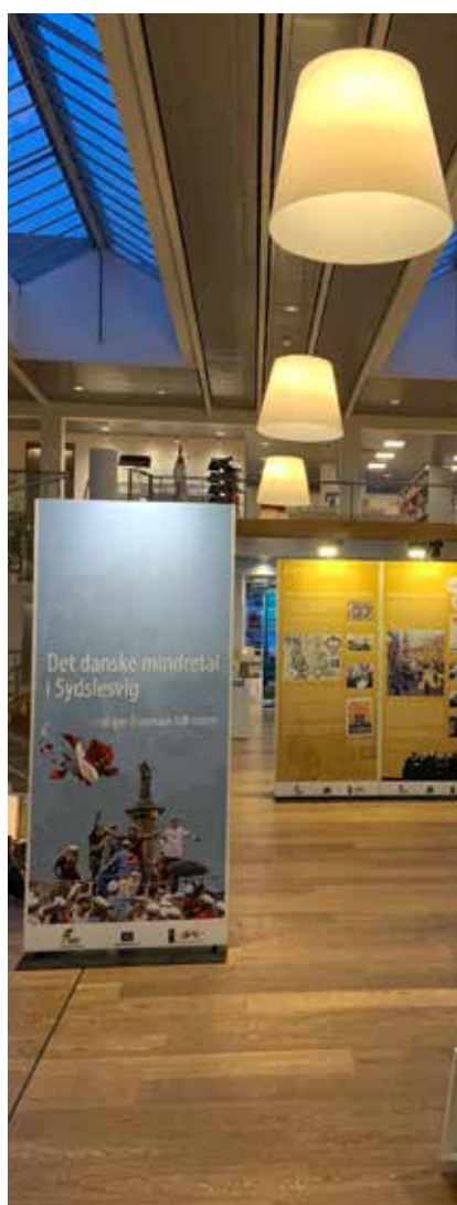
Udstillingen på Kolding bibliotek er en succes, konstaterer bibliotekets medarbejdere.