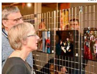
Billederne vakte publikums interesse.