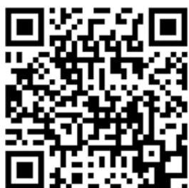
Zap en forsmag her.

Fredag den 20. marts kl. 20 byder SSFs Vestkystkultur på sej nostalgi med Gasolin-coverbandet Gasoline på Bredsted Danske Skole. Gasolin var toppen af toppen i Danmark i 1970'erne og var bandet, der skød Kim Larsens karriere i gang. Han var forsanger og skrev de fleste af bandets numre. Der er flere gode bands i Danmark, som – næsten – udelukkende spiller gamle gasolinnumre, men Gasoline er det eneste med 100 procent kvindelig besætning.