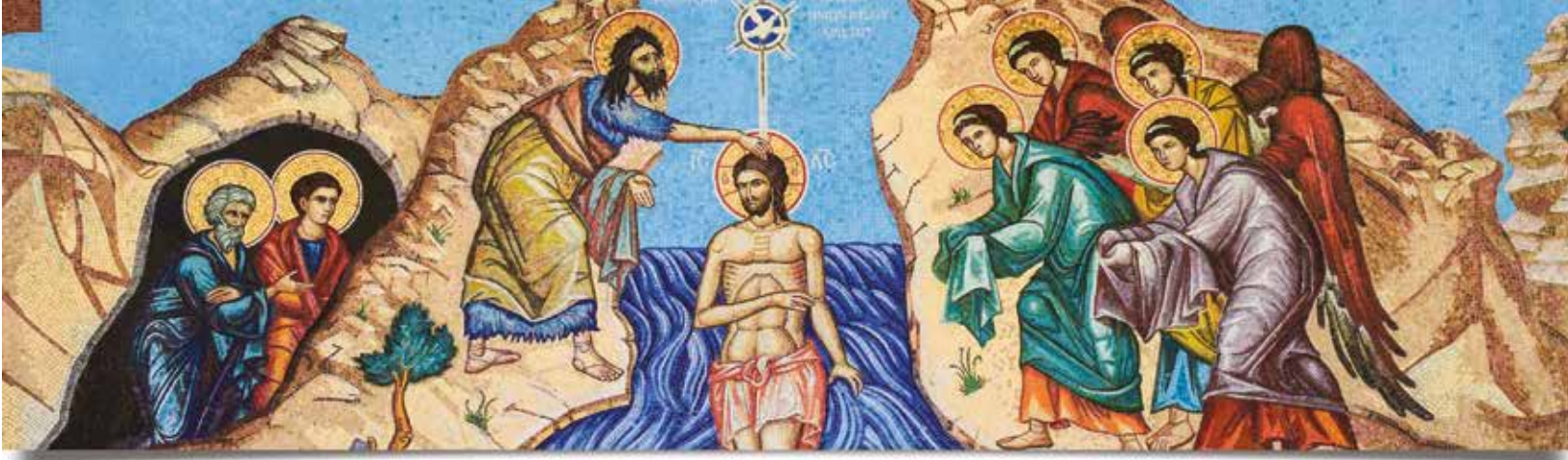
'Kristi dåb'. Russisk kirkemosaik.

Da Jesus tog afsked med sine disciple, sagde han til dem: 'Gå ud i alverden og gør alle folkeslagene til mine disciple, idet I døber dem i Faderens og Sønnens og Helligåndens navn, og idet I lærer dem at holde alt det, som jeg har befaleet jer. Og se jeg er med jer alle dage indtil verdens ende'. Den opgave tog disciplene meget alvorligt, de ville gerne give det videre, som de selv havde fået del i og var grebet af. I begyndelsen var det mest voksne, der blev døbt, men det hændte også at en hel husstand blev døbt. Det må have indbefattet børn i alle aldre. Jesus selv tog også imod børnene og velsignede dem, hører vi hver gang der er dåb. Vi hører endda, at hvis vi ikke tager imod Guds rige som et lille barn, så kommer vi ikke ind i det.