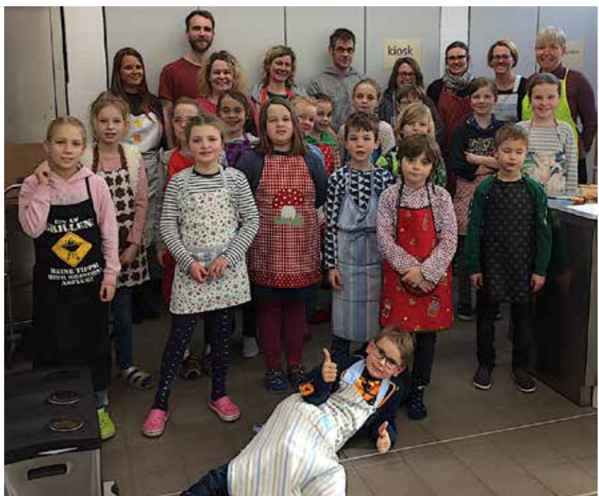
Små og store i skolekøkkenet.