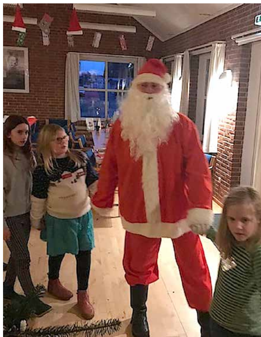
Julemanden danser også med.