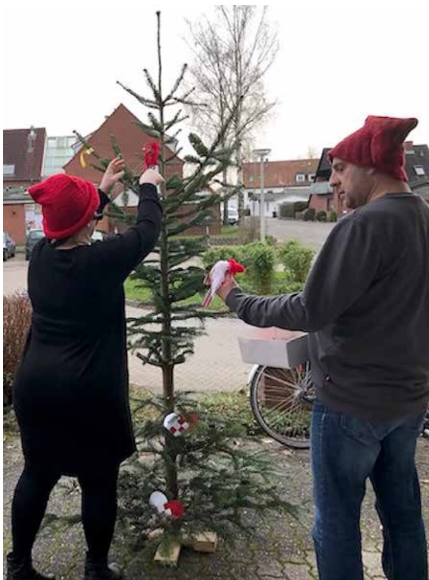
Det slidte juletræ pyntes en sidste gang.