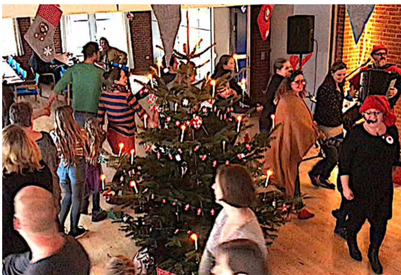
Der danses om juletræet.