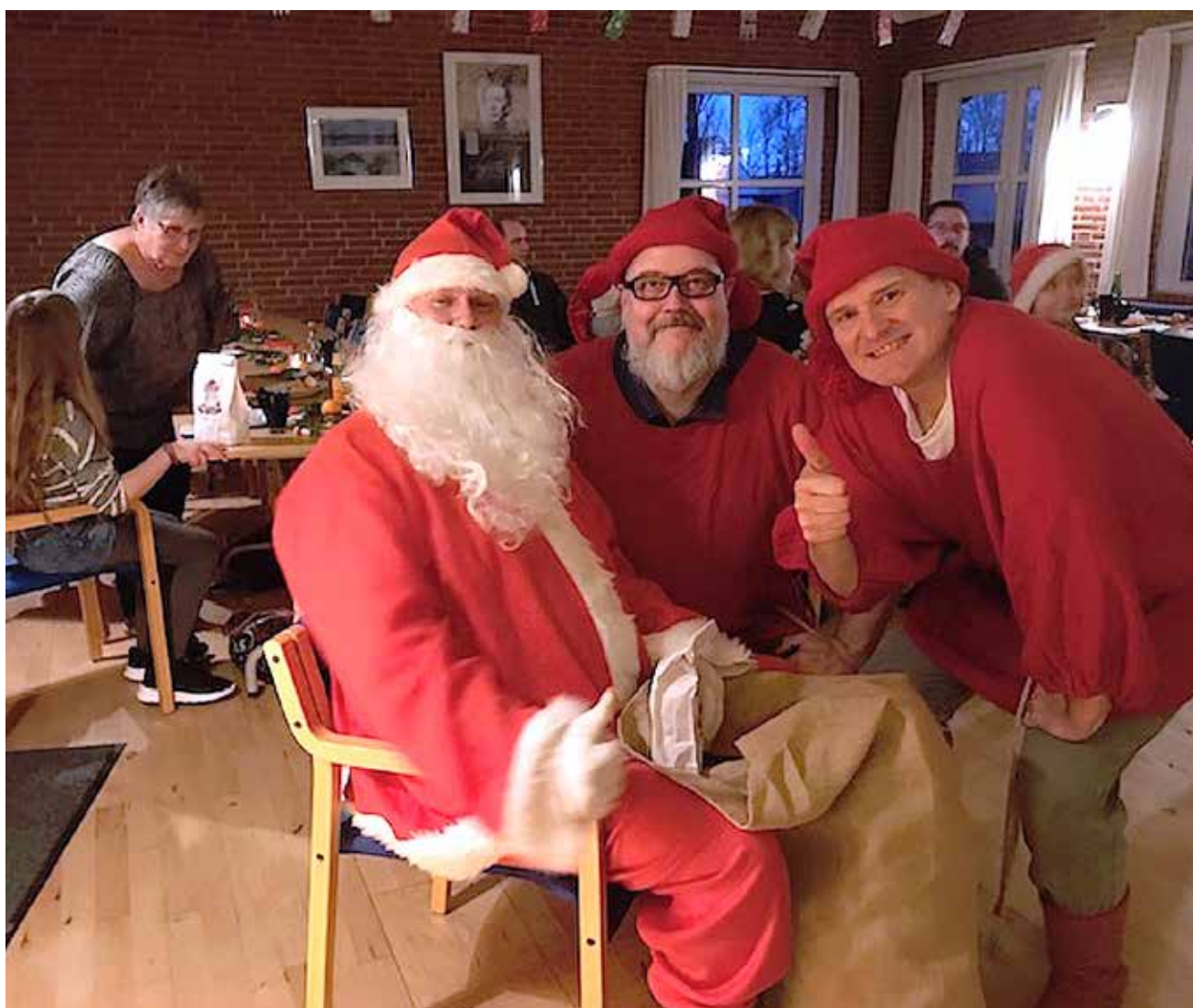
Julemanden med duoen Frehr & Nissen.