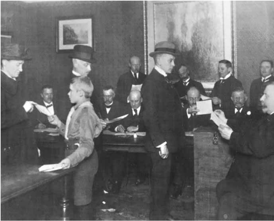
100.000 stemte i Zone 1 og 64.000 i Zone 2. Begge steder var valgdeltagelsen over 90 procent.

i Zone 2, ligesom man ønskede at få fjernet for eksempel den helt sikkert tyske by Tønder fra Zone 1. Omvendt havde den danske regering ikke fulgt de mange ønsker om at tage Flensborg med i Zone 1. Det var der to grunde til: Dels kunne de store tyske stemmetal i Flensborg true det samlede danske flertal i Zone 1, og dels ville man måske få en meget tysk og modvillig by med til Danmark. Men det var noget, som danskerne i den store by aldrig tilgav den danske regering - og for den sags skyld danskerne længere nordpå. De følte sig svigtet.