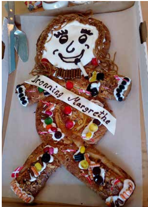
Tilknytningen til Danmark ses blandt andet, når man i Sydslesvig fejrer dronningens fødselsdag.

Det er karakteristisk for de fleste medlemmer af mindretallet, at de på den ene eller anden måde har et bånd til Danmark, hvad enten det er familie, venner, oplevelser som feriebarnd eller fra ferier i Danmark. Det styrker naturligvis båndet til Danmark, og mødet med den danske befolkning kan være bekræftende for