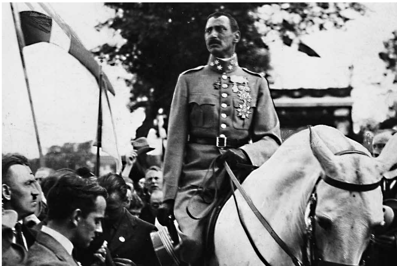
Under Chr. X fik Danmark det land, hans bedstefar kunne have fået.