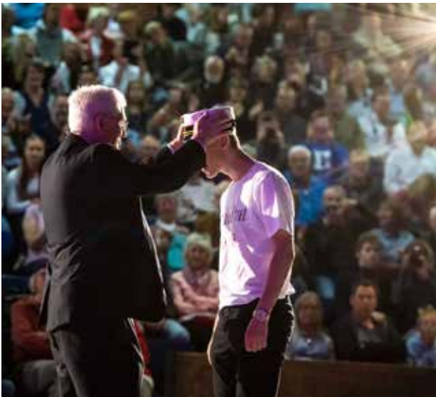
Lars Salomonsen fremhæver dette foto dels fordi det dimission på et dansk gymnasium i Tyskland er en noget særligt, men nok så meget for dets komposition. Lyset i billedet fører os direkte til studentehuen, som omkranses af tilskuerne - de stolte forældre. Vi kan ikke se ansigtet på studenten og han bliver derved symbol på alle studenter.