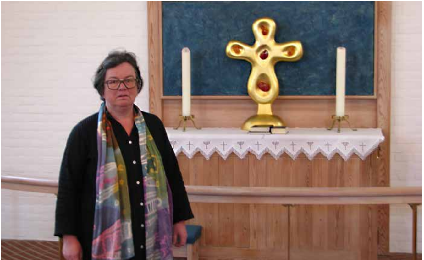
Korsets ravstykker er forarbejdet af Danmarks første miljøaktivist, Rav-Aage. Det har den ejendommelighed, at solen skinner på det, og kun det, dagen efter vinter- og sommersolhverv.