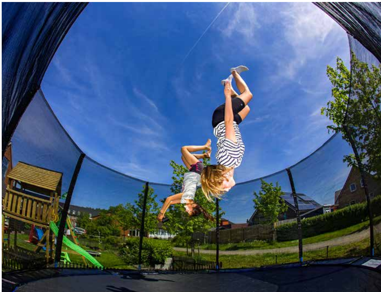
Et billede af solskin og livsglæde. Det har sikkert været sjovt både for pigerne og fotografen, mener Tim Riediger.

Vi har bedt hver af de tre fotografer give deres bud på de to andres billeder, og her kommer de så: