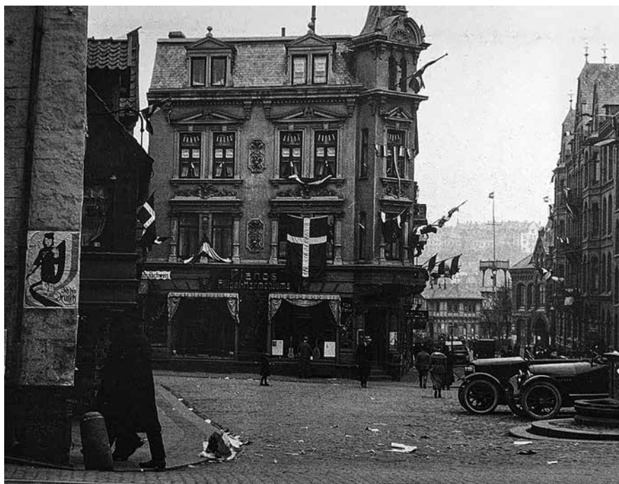
Der var ikke så forfærdeligt mange danske flag at se i Flensborg – med undtagelse af den nordlige bydel og Nørretorv her på billedet, hvor Flensborg Avis dengang holdt til.