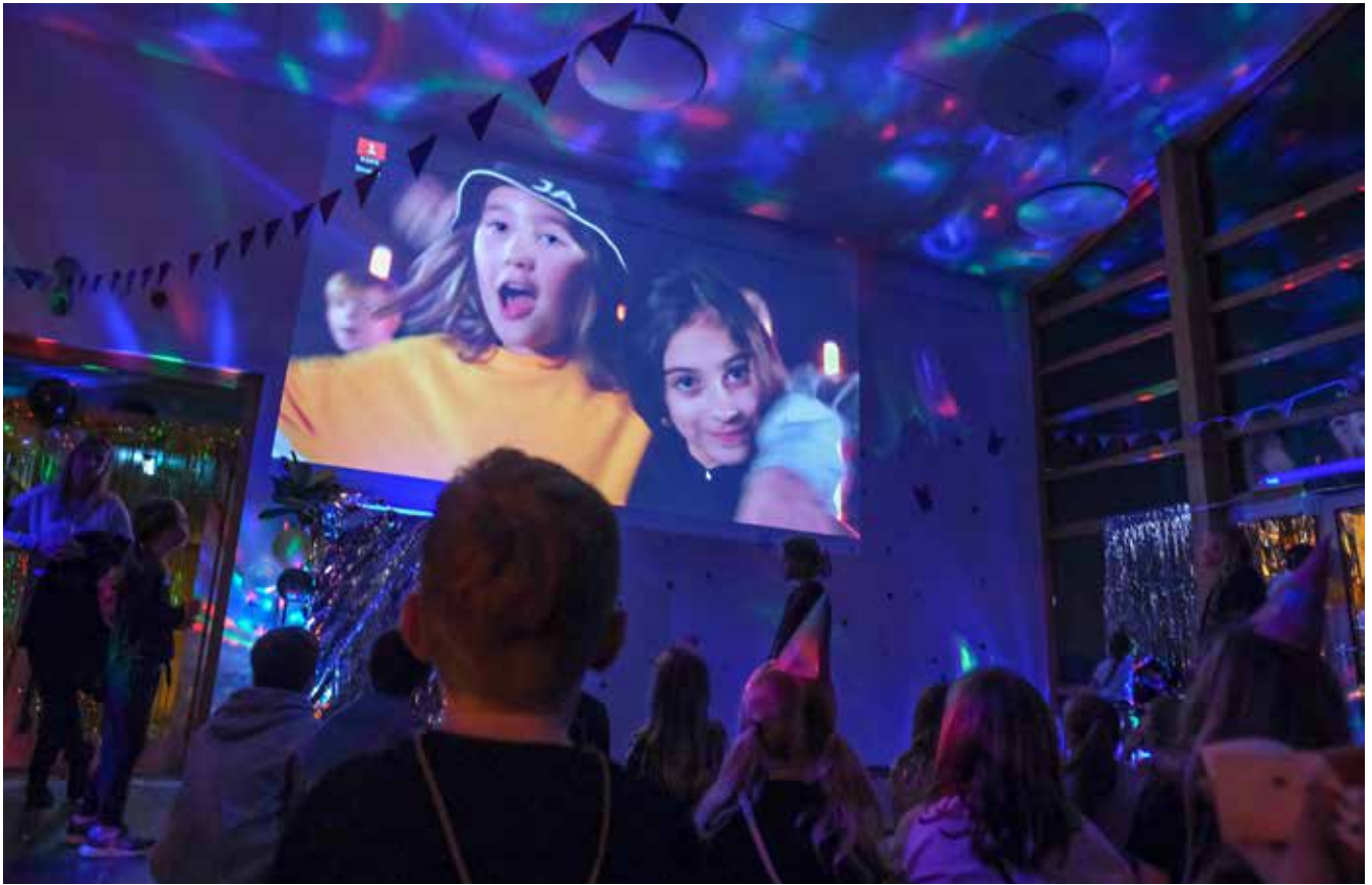
Storskærmen med transmissionen fra MGP showet i Royal Arena Copenhagen. Den blev nøje fulgt af 97 danske ungdomsklubmedlemmer og en del forældre, og de havde alle forberedt sig i et par måneder.