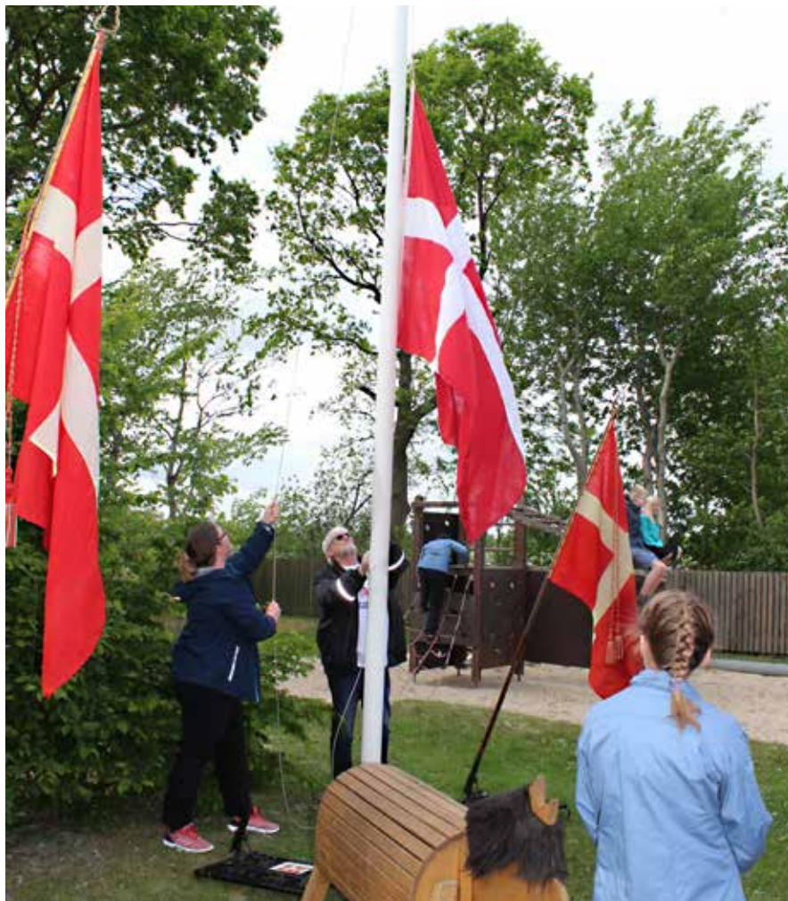
En klar bekendelse til det danske.....

Bonn-København erklæringerne og de venskabelige geopolitiske forhold i det dansk-tyske grænseland gør, at