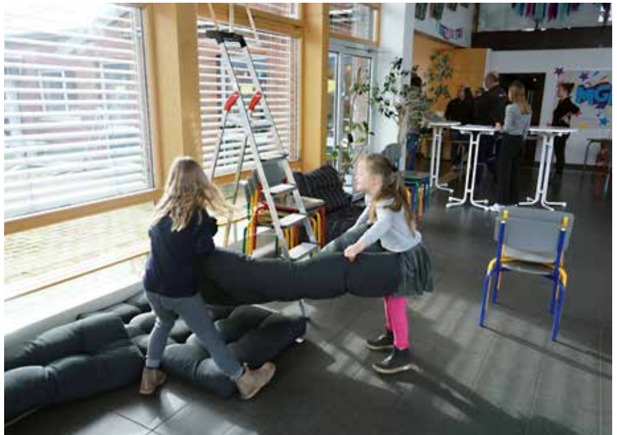
Om eftermiddagen før MGP showet var børn og forældre godt i gang med at forberede den lææænge ventede "Gallaften".

Under det meste af aftenen lå de på madrasser på gulvet, og foran sig havde de hver deres egen stemmesed-