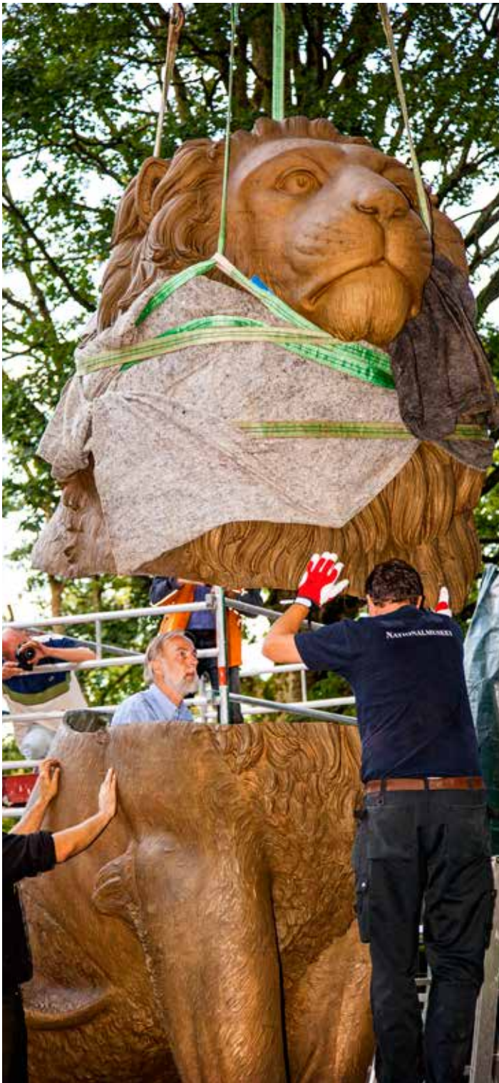
Endnu et billede af den gamle løve fra dens genindsættelse i Flensborg. Den blev kørt fra København til Flensborg i to stykker. Billedet er et skoleeksempel på, hvor vigtig fotografisk dokumentation af historiske begivenheder er, mener Martin Ziemer. Lad os håbe, manden med skægget kom ud, inden den blev lukket helt.