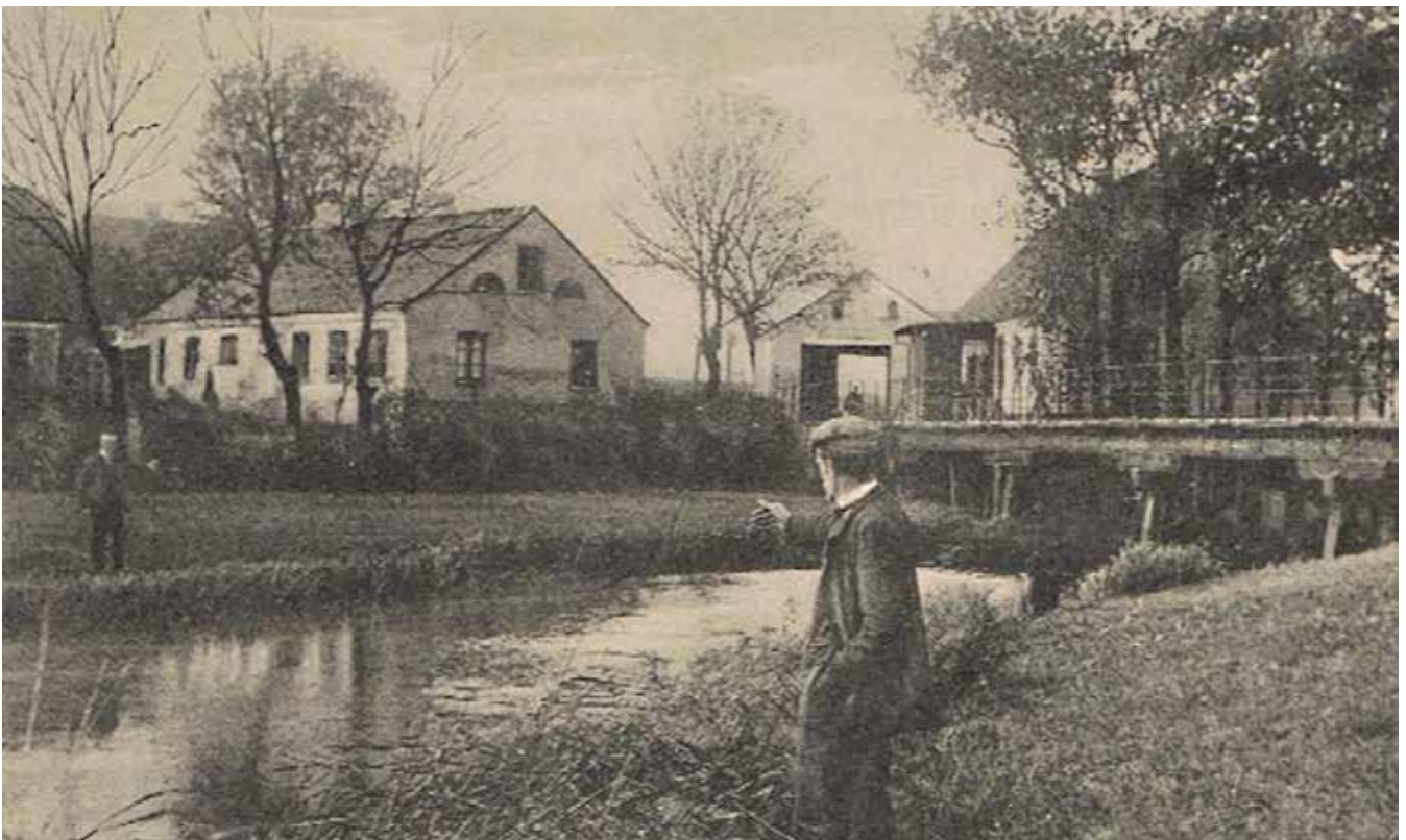
Kongeåen havde siden 1864 dannet grænse mellem Danmark og Tyskland, men i 1920 blev grænsen rykket sydpå.

sidste måneder af 1918 var netop dén situation indtruffet. Tyskland bad om fred under Første Verdenskrig og nævnte selv udtrykkeligt dengang de 14 punkter, som den amerikanske præsident, Woodrow Wilson, havde