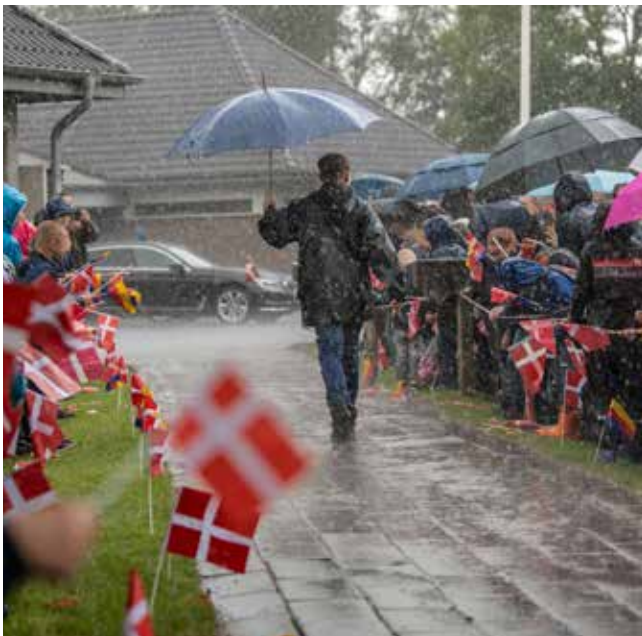
Dronningen er godt nok ikke med på billedet, men er på vej. Det øsregnede næsten konstant under det royale besøg, og papirlagene blev plaskvåde og måtte hele tiden skiftes. Tim Riediger roser det for at vise elevernes udholdenhed.