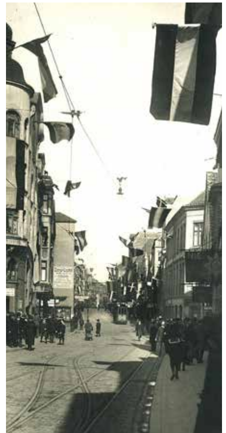
Der blev agiteret ivrigt i Flensborg for 100 år siden - men resultatet i byen blev meget klart.

Der blev ikke lavet specielle regler for det tyske mindretal dengang, men på grund af de ret liberale danske regler kunne hjemmetyskerne hurtigt etablere for eksempel egne skoler. Syd for grænsen var det først i slutningen af 20'erne, at der i nævneværdigt omfang kom danske skoler. Det var også i de første år svært at passere grænsen. Indtil 1926 skulle man både have et pas og et visum - selv om specielt mange danskere gerne ville sydpå for at købe ind med den stærke danske krone. Da der blev lempet på reglerne, var den tyske modydelse en lavere told på danske produkter fra landbruget. Der var dengang en stor grad af mistænksomhed mindretallene imellem. For eksempel blev der berettet stort om støtten fra de to stater til hver deres mindretal. Men realiteten var, at mindretallene ofte blev brugt som løftestang for hinanden: Hvis der blev