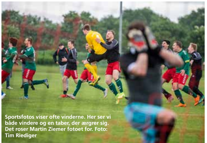
Sportsfotos viser ofte vinderne. Her ser vi både vindere og en taber, der ærgrer sig. Det roser Martin Ziemer fotoet for.