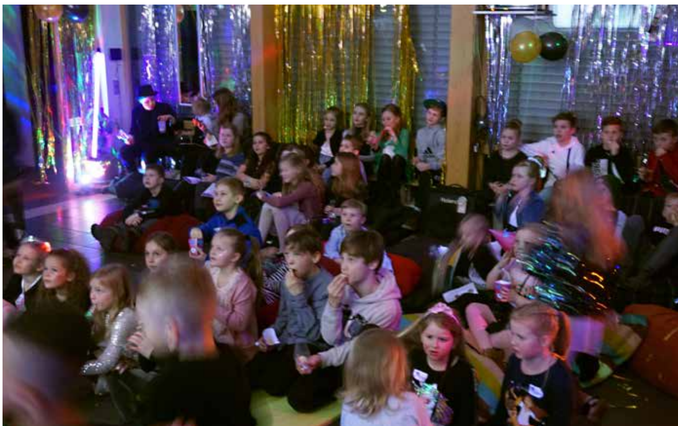
Alle fulgte med på storskærmen. Det var deres idoler, de fulgte. Mange af børnene smuttede dog af og til hen for at købe en is, en hotdog, en pose slik eller en læskedrik mere.

Paraplyorganisationen har en klart formuleret sprogpolitik, og foreningen har fået udarbejdet et undervisningsmateriale, der tager udgangspunkt i de ord og situationer, der er kendetegnede for dansk foreningsliv og møder. Det materiale er beregnet til nye voksne, der har valgt det danske i landsdelen Sydslesvig.