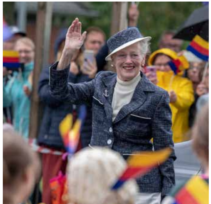
Et lidt anderledes foto, fordi det her er friske flag og ikke danske, der rammer majestæten ind. Derudover roser Lars Salomonsen billedet for kontakt til dronningens ansigtsudtryk.