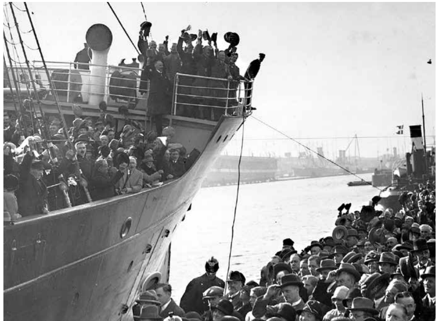
Begge sider mobiliserede folk, der tidligere havde boet i området, til at komme og stemme. Her ankommer danskere til Flensborg.

Det hele er mundet ud i, at samlivet i det dansk-tyske grænseland nu er tæt på at skulle optages i Unescos liste over steder med en immateriel verdenskultur.