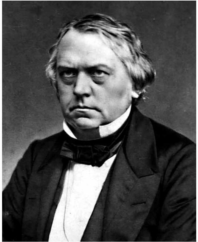
De to hovedansvarlige for, at Sønderjylland blev tysk i 56 år: kong Chr. IX. og Regeringsleder D.G. Monrad.