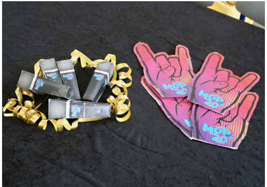
Lidt af det børnene har lavet. De har også samlet bægere til popcorn og stemmesedler, som de skal afgive deres stemmer på. Og bordene fik mørke duge lagt på.

I Sydslesvig er der 43 danske skoler, 57 dagtilbud i form af vuggestuer, børnehave og skolefritidsordninger, og så er der 41 danske forsamlingshuse. Sammen med sportspladser og to idrætshaller danner de rammerne om det danske forenings- idræts- og kulturliv i Sydslesvig. Hanved Ungdomsforening er gennem