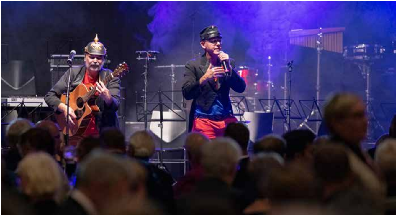
..... er en forudsætning for mangfoldigheden.

spørgsmålet om genforening i statsretlig forstand ikke er aktuelt.