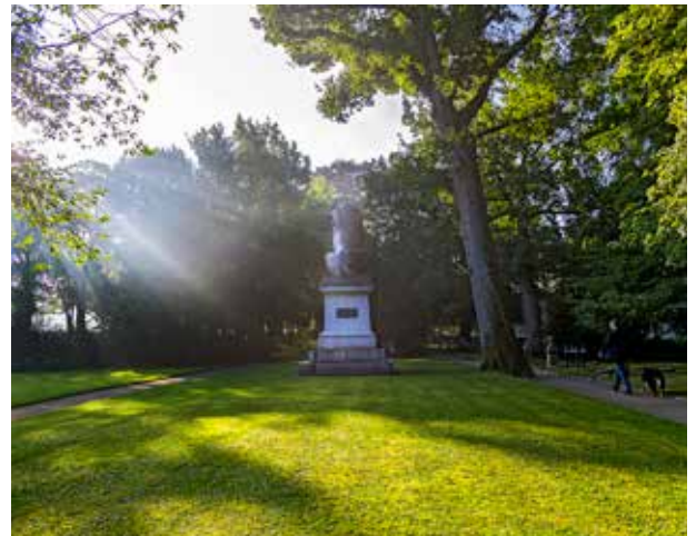
Istedløven er efter flere rundrejser i Nordeuropa kommet tilbage til kirkegården i Flensborg. Den blev slæbt først til Berlin siden til København for at markere, hvem der havde tabt og vundet. Den var sejrherrenes trofæ i to krige. Her mener Tim Riediger, den viser, at den ikke har lyst til at være symbol på nationers hang til selvhævdelse.