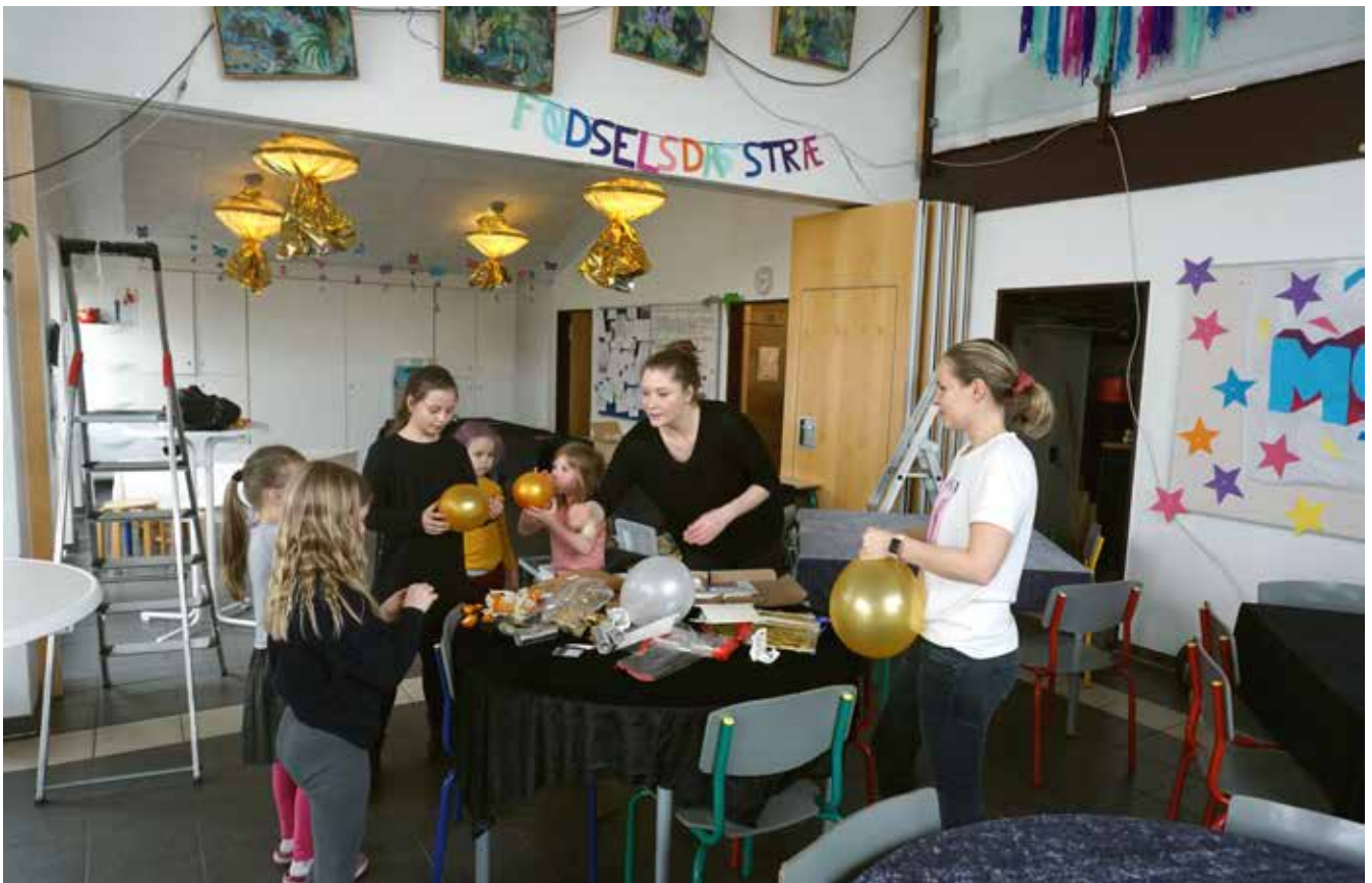
Lamperne blev pakket ind i farvet cellofan. Der blev pustet balloner op i lange baner i den hall med borde og stole, der til daglig danner rammen om Skolefritidsordningen.