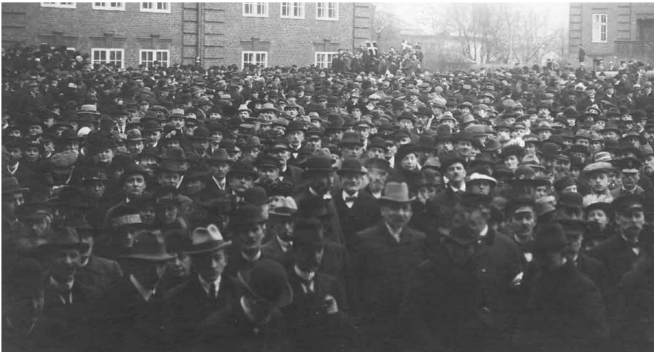
Fra et stort dansk valgmode ved Altes Gymnasium i Flensburg. Problemet var, at de tyske møder var langt større.