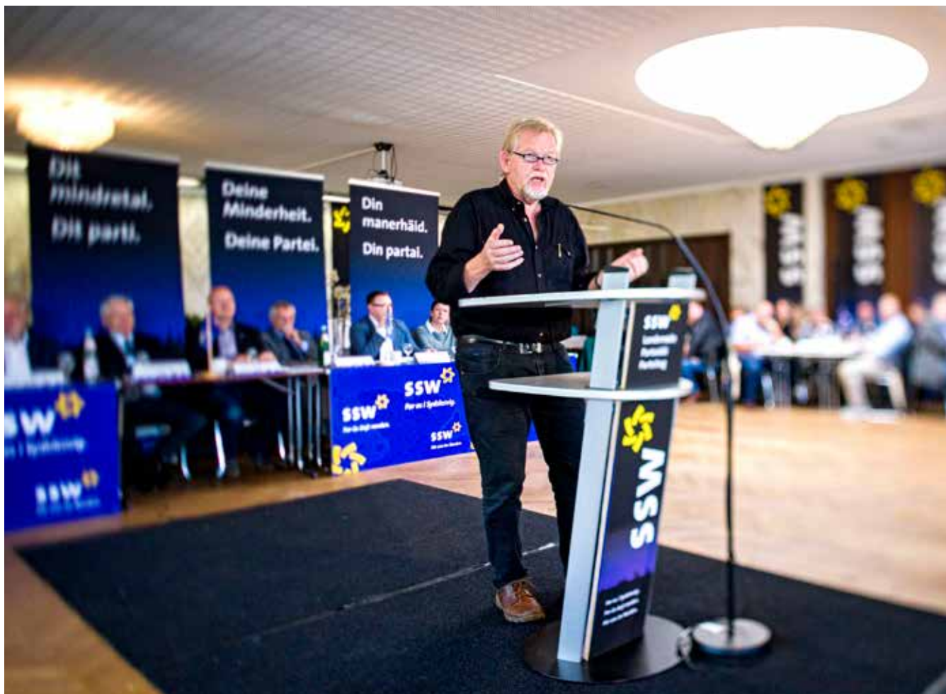
En af Christian Juhls første opgaver som formand var at overbringe SSWs landsmøde en hilsen.