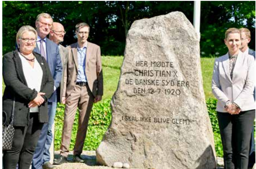
Statsminister Mette Frederiksen mødtes med de danske sydfra 100 år efter grænsedragningen.

Rejsen havde mottoet "100 år efter folkeafstemningen - sammen over grænser", og ministerpræsidenten understregede, at han på begge sider af grænsen ville besøge institutioner, der arbejder for at fremme det gode