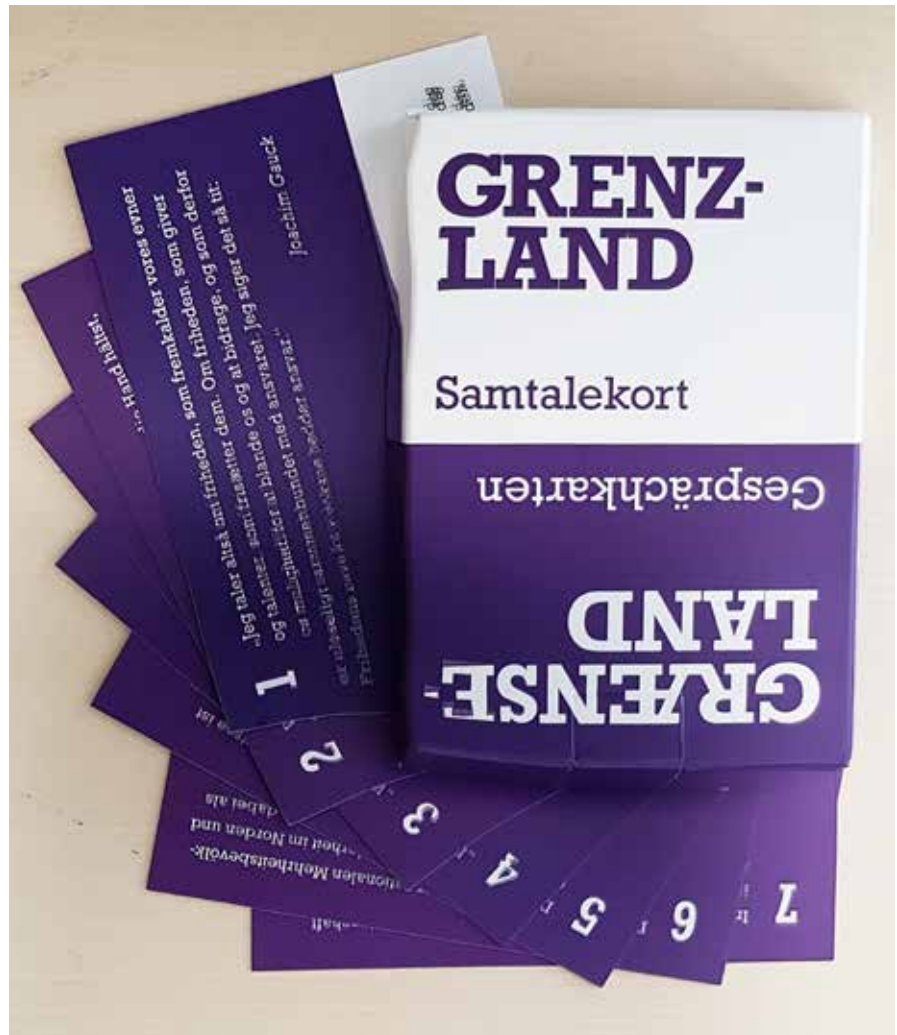
Den violette farve skal lede tanken hen på liturgien.