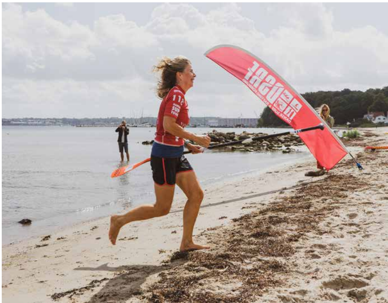
En af kombattanterne i den korte etape går i land.