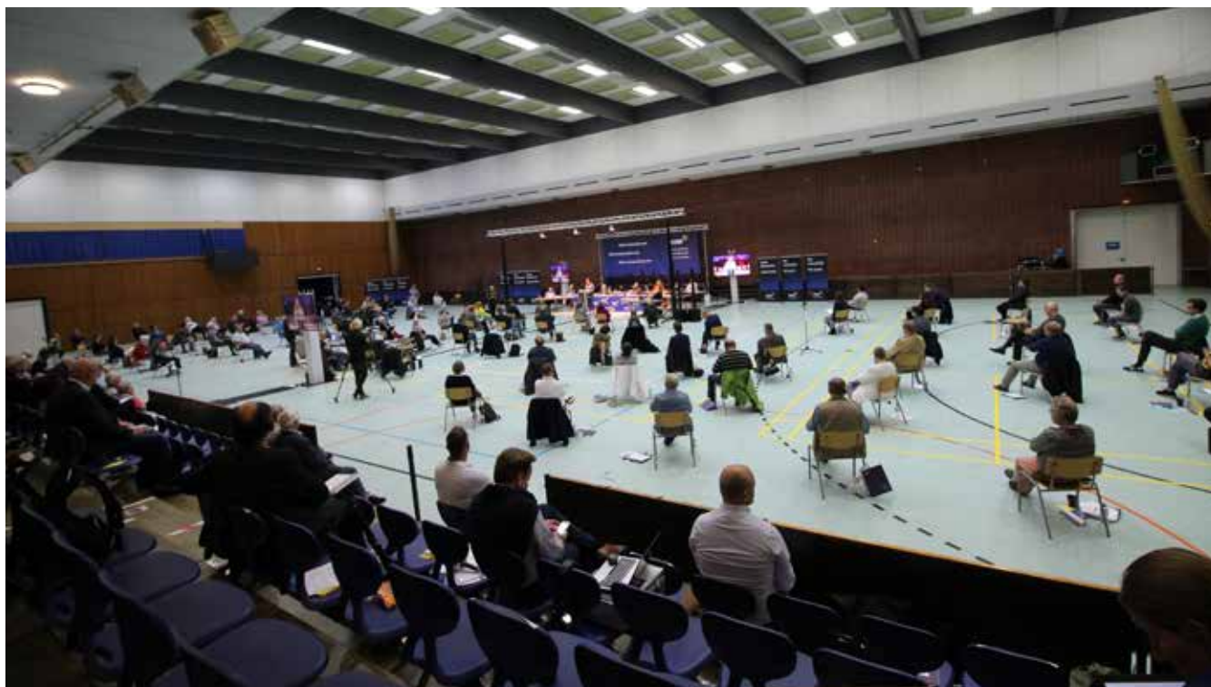
De delegerede sad af sikkerhedshensyn spredt. Men de var også delt i forhold til opstilling til forbundsdagen.