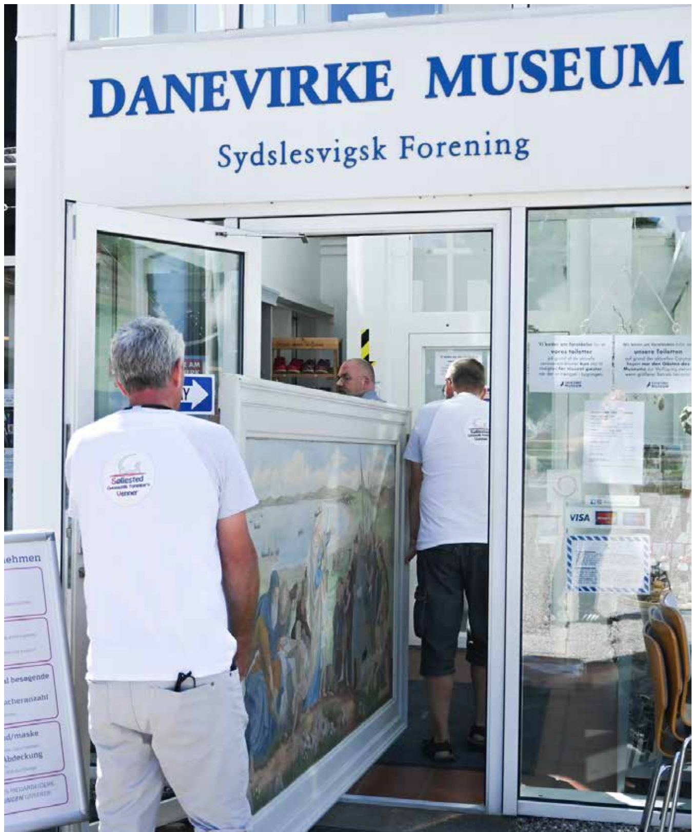
Maleriet på vej ind på museet. Det fylder en del.