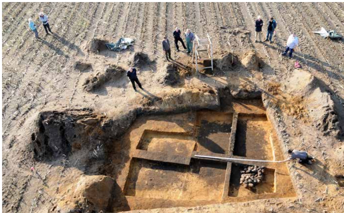
Den formodede handelsplads ved Ellingsted var ret omfattende for sin tid.

Ellingsted kan have været Hedeby's Nordsøforbindelse.