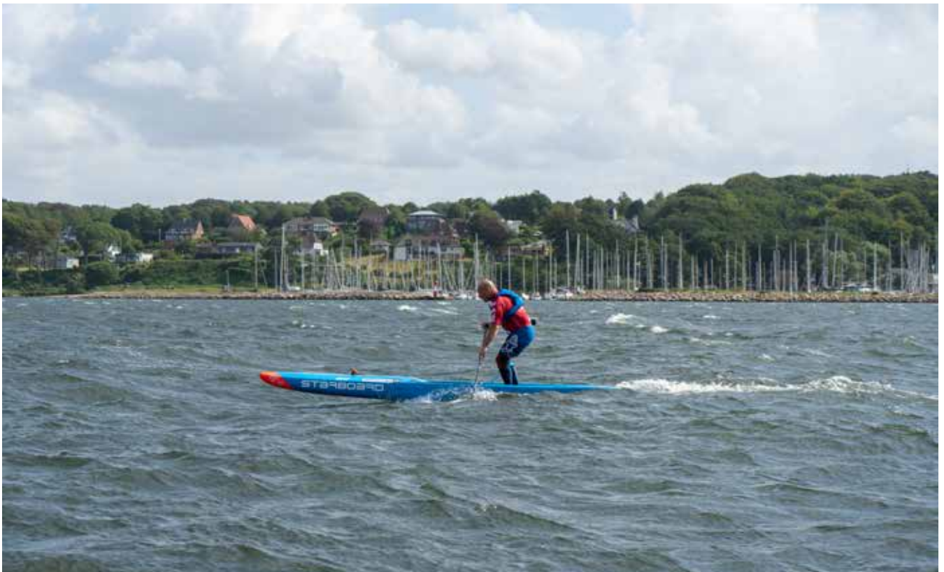
En af de danske deltagere.