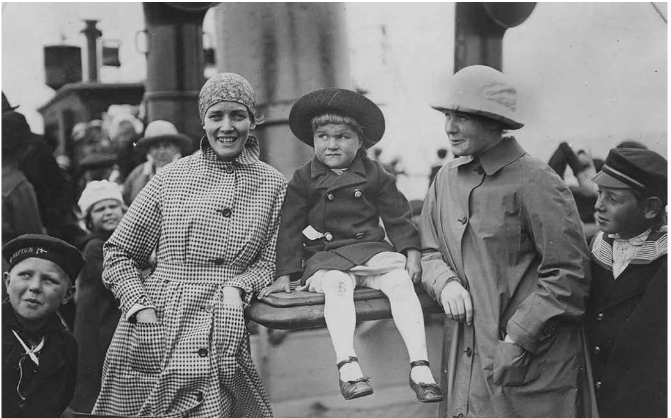
Sydslesvigske danske ferieborns sommerophold i Danmark var allerede startet i 1919. Der blev blandt andet brugt skib til transporten.

andet ikke de fleste politikere, der mere baserede sig på sindelaget end på afstamningen.