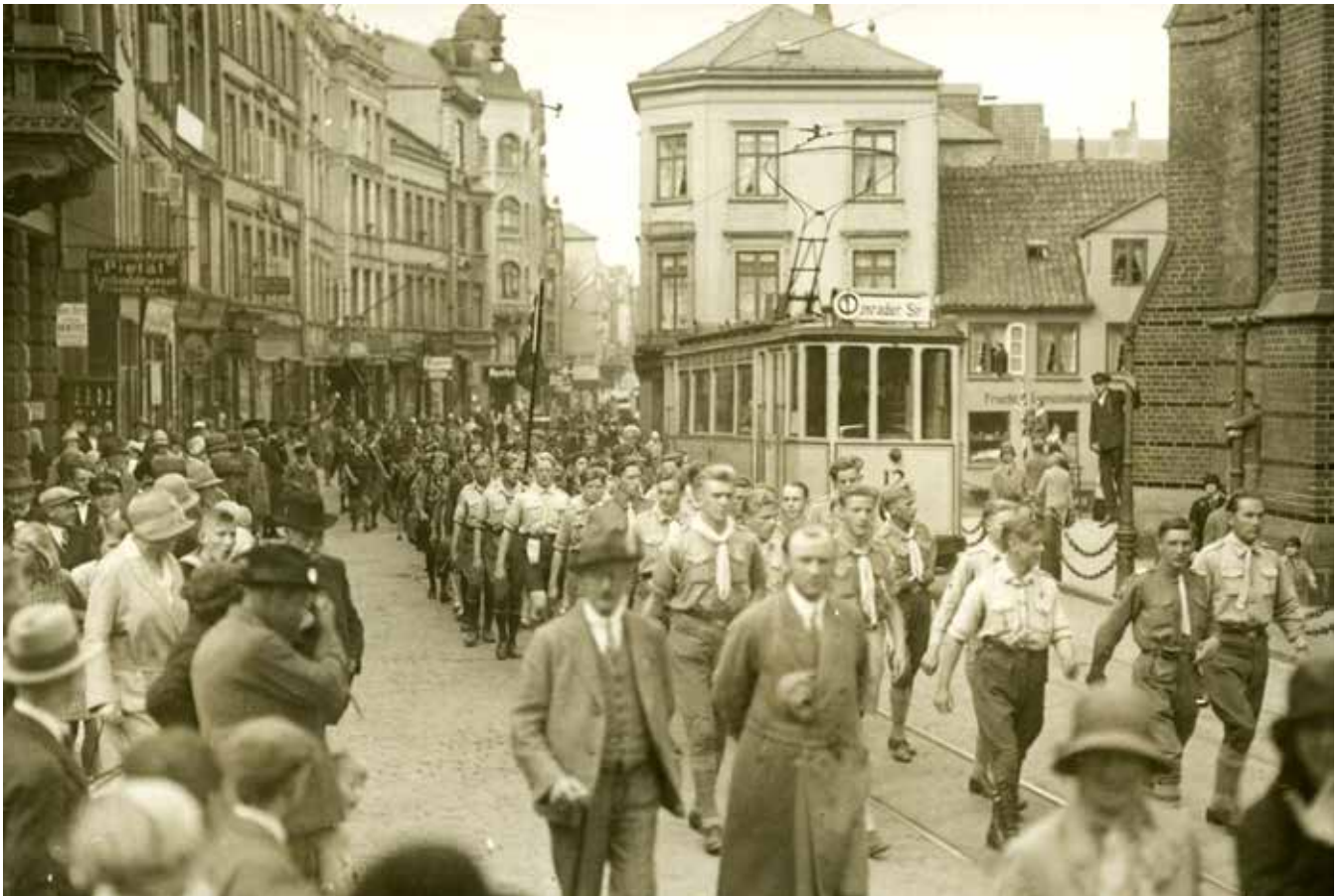
Det danske spejdervæsen kom hurtigt op at stå i Sydslesvig i 1920'erne. Her ses en parade i Storegade.

lemkrigstiden blev præget af, at det først og fremmest var Flensborg, det drejede sig om for danskerne.