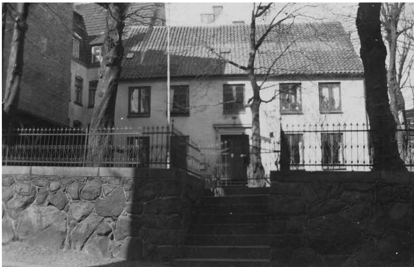
Den første danske privatskole blev indrettet i Hjemmet i Mariegade. Midt i 1920erne kom Duborg-Skolen til.

mente, at det oprindeligt danske var blevet dækket af et lag tysk fernis, som kunne fjernes igen. Men det var en holdning, der ikke blev delt af mange nord for grænsen – blandt