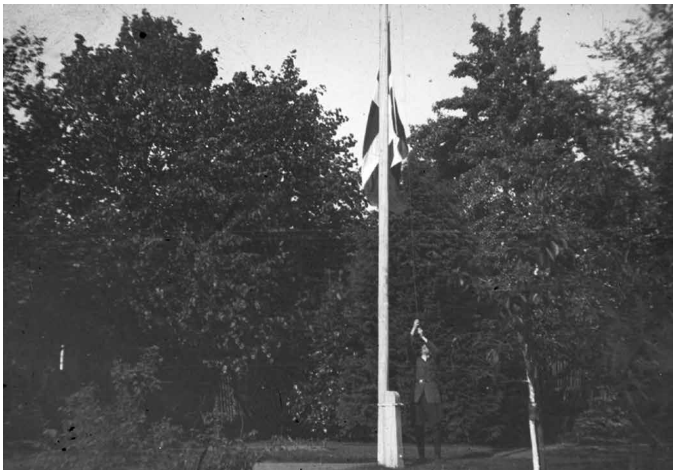
Det danske mindretal var i 1920 i høj grad et Flensborg-fænomen. Ude på landet var der kun ganske få dansksindede, der hejste flaget.