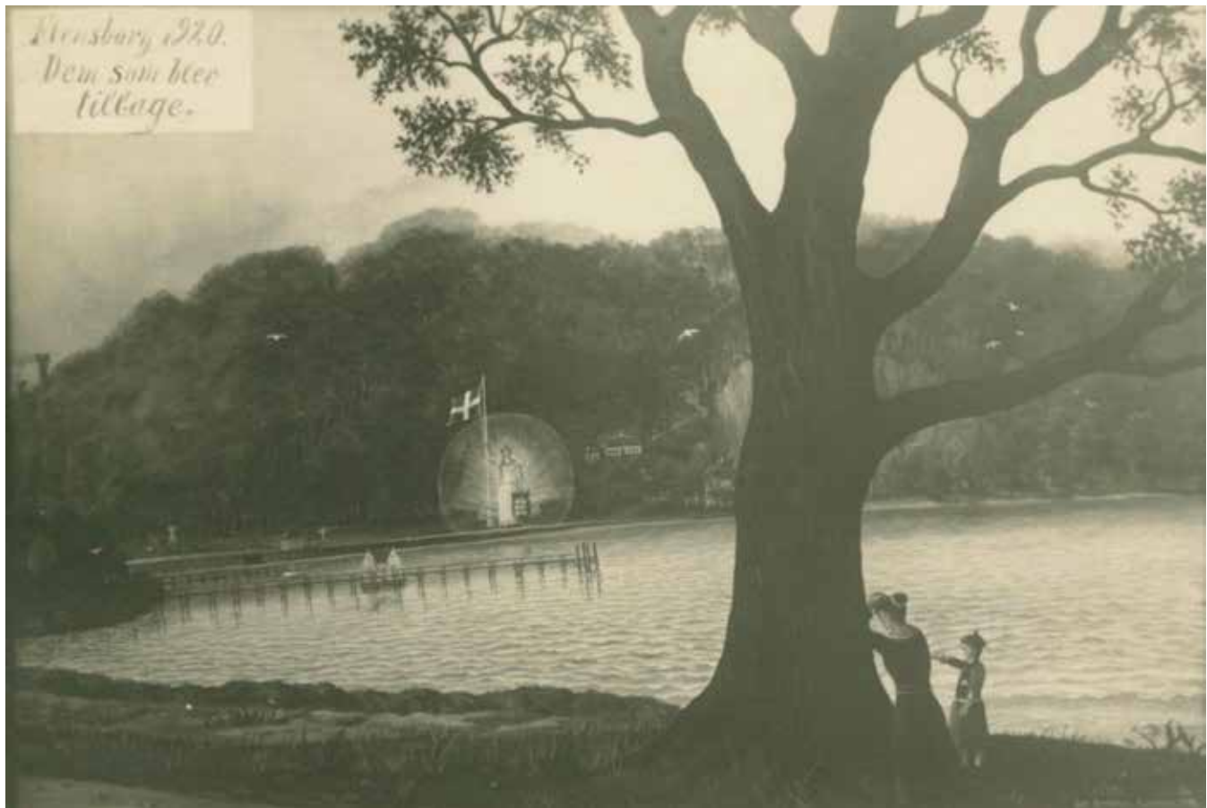
Mange danskere i Sydslesvig følte sig forladt og til dels forrådt – her kunstnerisk udtrykt ved den lille grænseovergang Skomagerhus.

Som der syd for den nye grænse ofte ikke var blide følelser overfor. Holdningen var, at man godt kunne have taget større dele af Sydslesvig og specielt Flensborg med i den Zone 1, hvor der blev stemt en bloc, og som senere endte med at gå til Danmark.