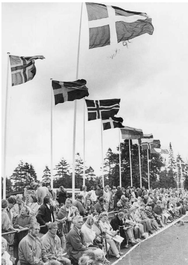
Siden 1921 holdes nærmest uafbrudt danske årsmøder i Sydslesvig.

[ÅRSMØDEKONTAKT] For 100 år siden startede traditionen med at holde danske årsmøder i Sydslesvig. Dengang, et år efter folkeafstemningen og grænsedragningen, var årsmøderne en fortsættelse af den tradition, der havde udviklet sig i Nordslesvig siden århundredskiftet, og som på sin vis var en videreførelse af de berømte store folkefester på Skamlingsban-ken i 1840'erne.