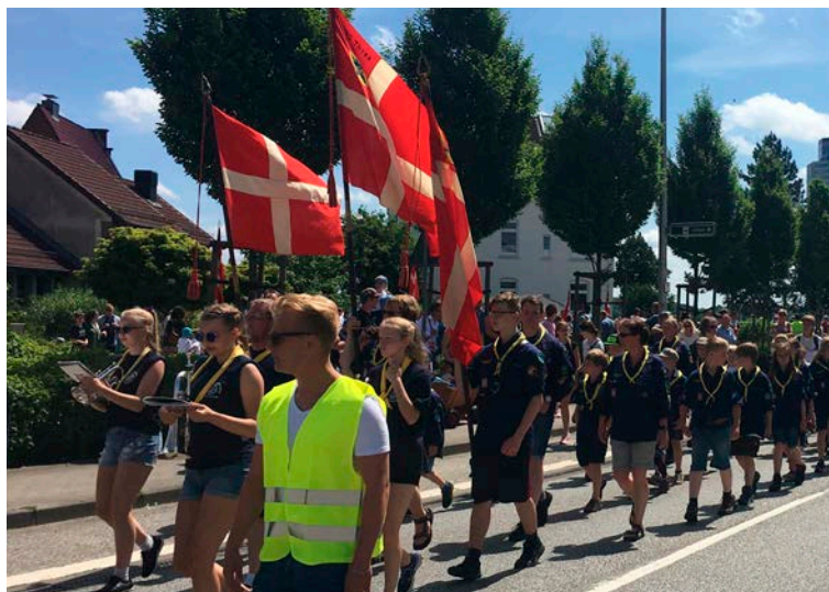
Friluftsmødet i Slesvig med optog gennem byen er et tilløbsstykke. I år må mindretallet i Gottorp Amt nøjes med en slank udgave af årsmøderne.

Deltagernes personlige data registreres, der er pligt til mund- og næsebeskyttelse samt skærpede hygiejneregler.