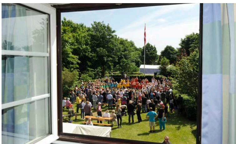
Årsmøderne kommer til at foregå på en lidt anden måde i år. Der bliver begrænset antal deltagere.

Efter talerne er der tid til lidt hyggesnak over en kop kaffe. Vi slutter mødet med flagnedtagning, siger farvel og håber på et mere normalt møde i 2022.