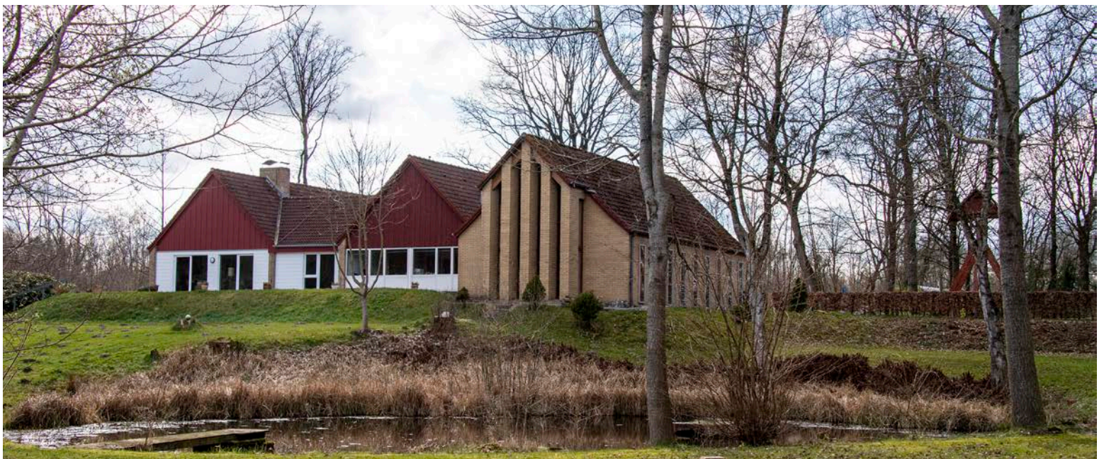
Præstegården i Tarp med blik over Tredalen.