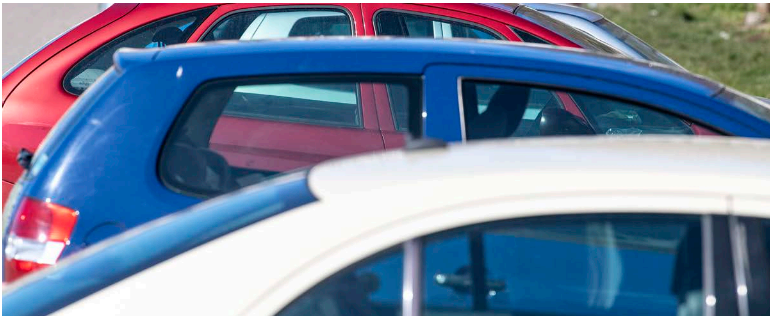
I stedet for et friluftsmøde holder SSF Flensborg By i samarbejde med Danmark-Samfundet i Sydslesvig en "rally" gennem landsdelen.

Sydslesvigsk Forening e. V. Dansk Sekretariat for Flensborg By, Schiffbrücke 42, 24939 Flensborg tlf. +49 461 144 08 127 mail: flby@syfo.de