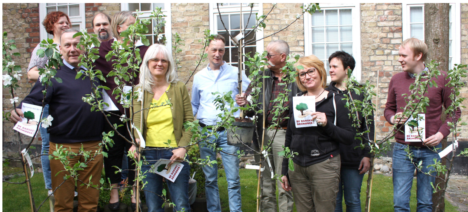
I 2017 overrakte årsmødeudvalget æbletræerne til SSFs amtskonsulenter.