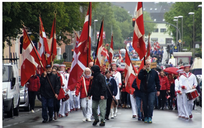
Der bliver ingen optog ved Årsmøderne i år.

SSFs hovedstyrelse understregede dog årsmødernes betydning for de danske i Sydslesvig og for kontakten til Danmark. Af den grund blev amter og distrikter opfordret til at se på, hvor og i hvilket omfang lokale møder kunne gennemføres. Altid under hensyntagen til de gældende Corona-regler. Det betyder blandt andet, at man skal tilmeldes til møder, at der foreligger hygiejne-koncepter, og at antallet af deltagere er meget begrænset. Optog, underholdning, fællesspisning og fællessang hører også til de