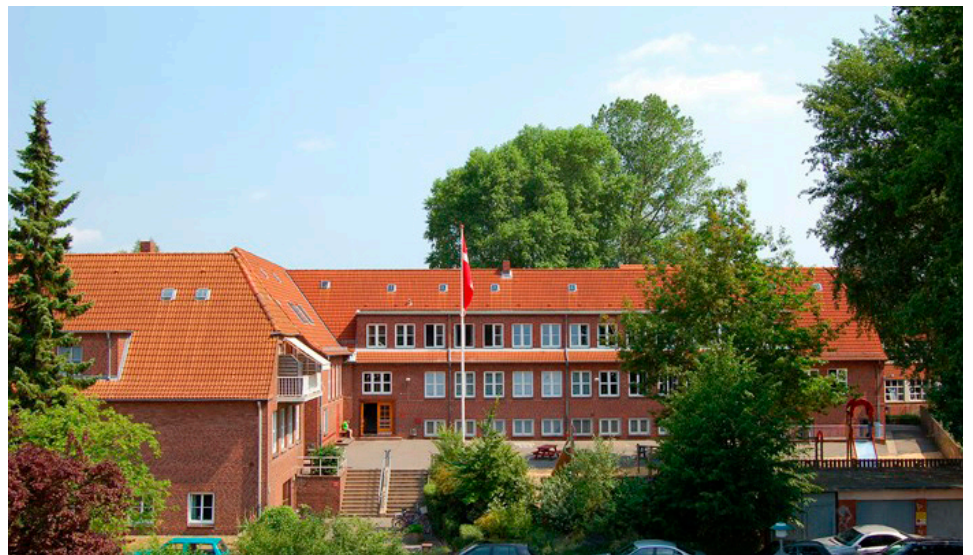
På Ejderskolen holdes en Dannebrogdag.