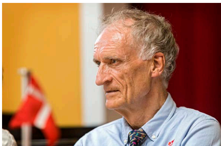
Bertel Haarder, præsident for Nordisk Råd og tidligere minister, er en af talerne i Husum.

Bertel Haarder er vokset op på Rønshoved Højskole og har således et livslangt forhold til Grænselandet. Han er den dansker, der har været minister i sammenlagt flest år. Mødet holdes på Husumhus. Tilmelding til 04841 2612 eller husum@syfo.de senest tirsdag den 26. maj.