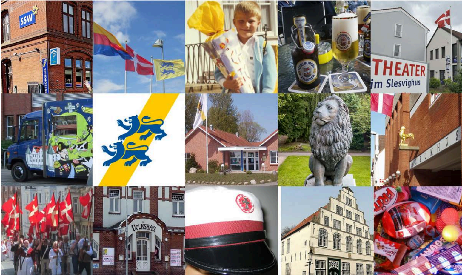
I Facebook-gruppen "Sydslesvigere Worldwide" mindes sydslesvigere, hvordan de oplevede årsmøderne derhjemme.