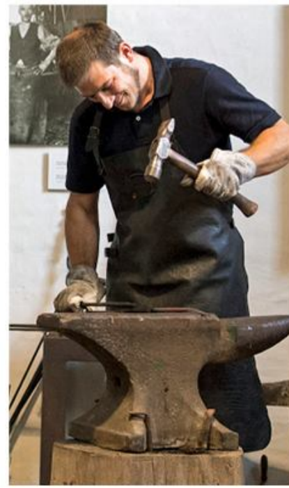
Smeden i aktion.