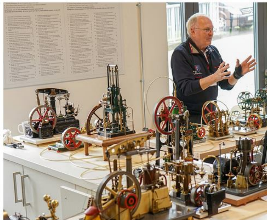
Modeldampmaskine-samlingen er et trækplaster.

De besøgende bedes overholde de aktuelle restriktioner mht. maskepligt, afstand og håndhygiejne. På grund af restriktionerne vil der i år ikke være salg af kaffe og kage, drikkevarer og pølser. Der tages denne dag ikke fast entré - men der bedes som sædvanligt om en "Spende" til indkøb af udstillingsgenstande og udstillingsmateriel.