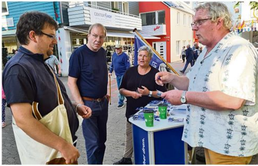
SSW-Politiker im Gespräch mit Wählern.