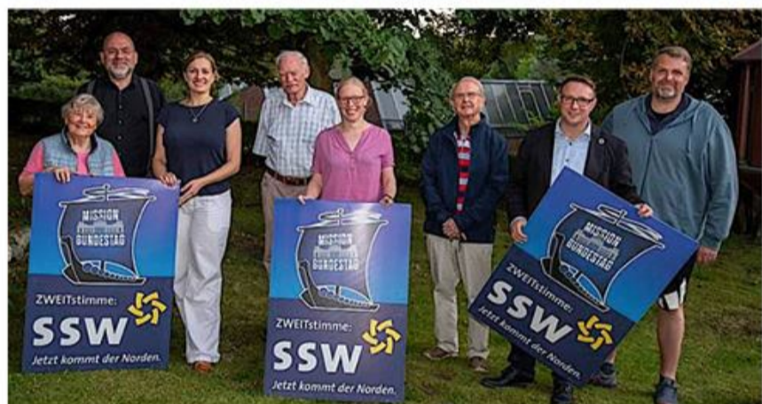
SSW Flensborg Østs nye bestyrelse med den nye formand i midten.