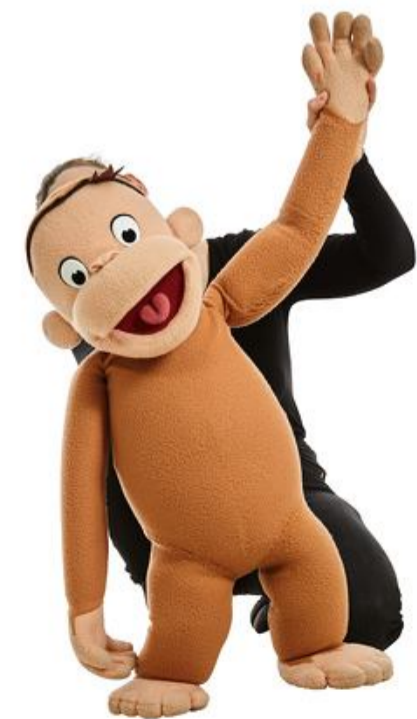
Mød den lille nysgerrige abe Peter Pedal i Husum.

Søndag den 26. september kl. 15:00 indbyder SSF til familieforestilling med Peter Pedal på Husumhus. Og for første gang i Europa, Peter Pedal Live! Et show udviklet i samarbejde mellem Universal og Showagent. Året 1941 er første gang, verden møder den lille nysgerrige abe, som bliver flyttet fra sit hjem i Afrika af "Manden med den gule hat" til storbyen New York. Siden er karakteren filmatiseret og illustreret i utallige versioner verden over, fra spillefilm til godnat læsning i natlampens skær. Peter Pedal er kendt for sin altid optimistiske tilgang til livet og lidt uheldige ulykker – men det lykkes altid Peter Pedal at gøre det godt igen. Vær med, når Peter Pedal og hans trofaste ven, manden med den gule hat, gør os alle sammen klogere på affaldssortering i et show med sang, musik og en lille smule af Peter Pedals ulykker. I dette show lærer børnene og Peter Pedal, hvordan vi skal være mere miljøbevidste i form af affaldssortering. Showet varer 25 minutter, og der er efterfølgende 30 minutter meet and greet med Peter Pedal og manden med den gule hat. Billetter: ssf-billetten.de , +49 461 14408 125, SSFs sekretariat, Aktivi-