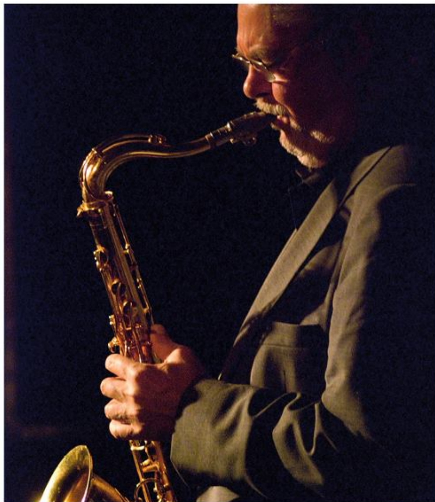
Jesper Thilo – 24. September i Flensborg.

Billetter: ssf-billetten.de , +49 461 14408 125, SSFs sekretariat, Aktivitetshuset, sh:z Ticketcenter FL, Reisebüro Peelwatt FL og ved indgangen. Arrangør: Sydslesvigsk Forening og Sydslesvigs danske Ungdomsforeninger.