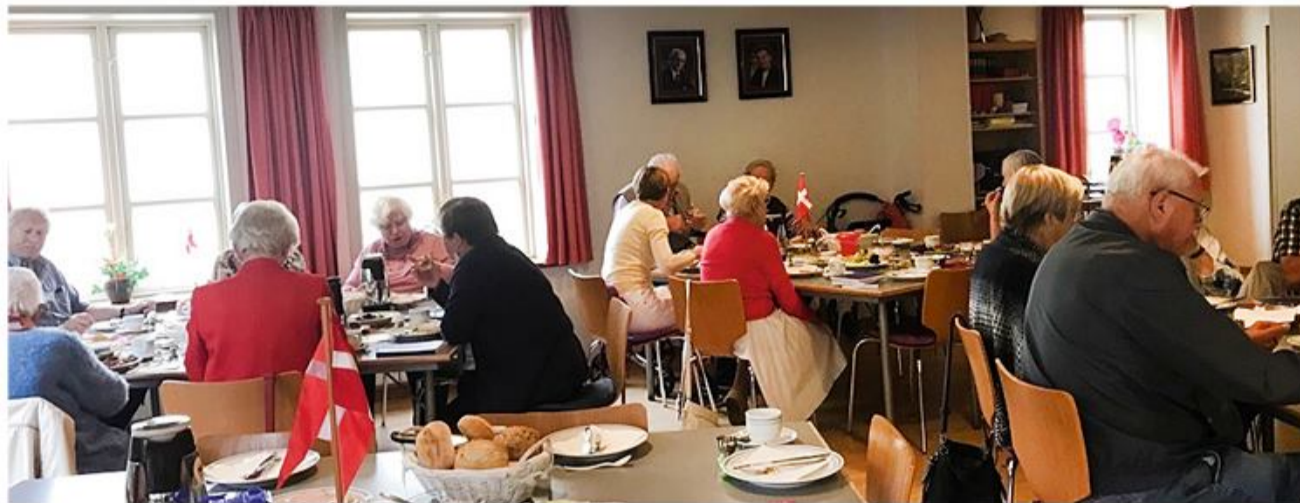
Deltagerne i morgenmads-arrangementet nød samværet, hyggen og maden.

I SSF-distrikt Nord i Flensborg har man været nødt til at indstille arbejdet i de to ældreklubber Sejlklubben og Spætteklubben. Damerne, der havde ledet klubarbejdet i mange år, ønskede at stoppe, og det har ikke været muligt at finde afløsere for dem.