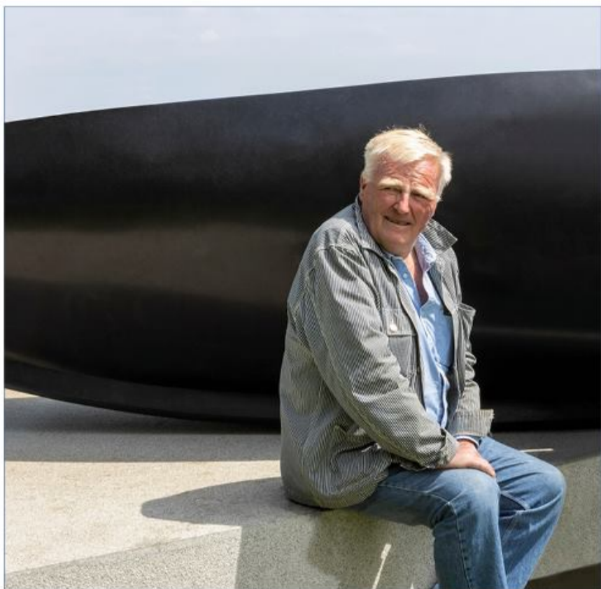
Kunstneren Per Arnoldi kommer til Flensborg.