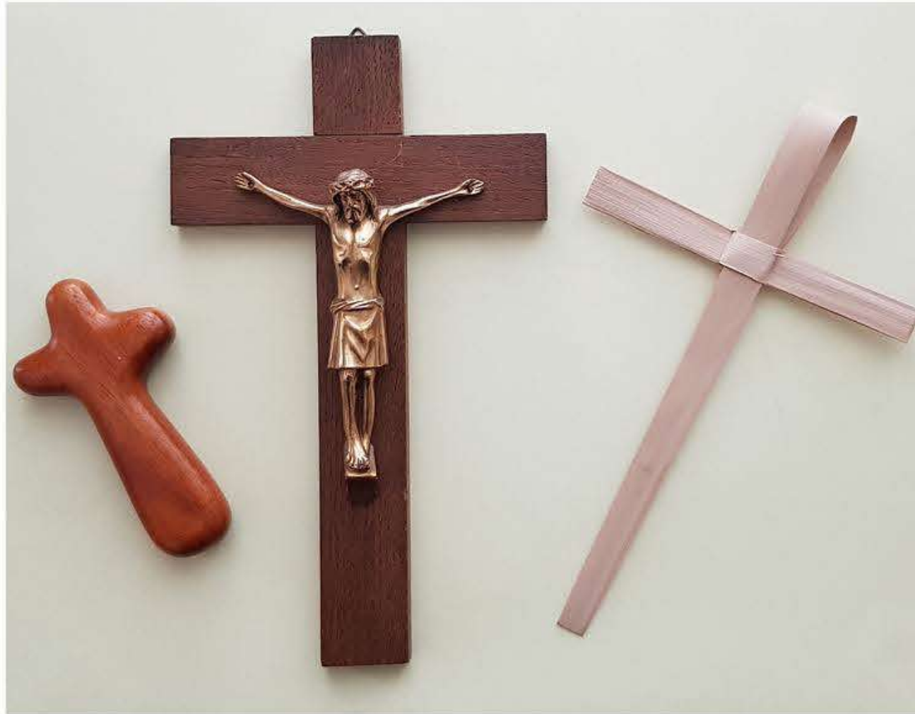
De tre kors.

I midten ses et nydeligt krucifiks, som de er fremstillet i titusindvis. Dette er af egetræ og Kristus-figuren er støbt i bronze og derefter blankpoleret. Man kalder det et gotisk krucifiks. Altså et latinsk kors med en figur; den lidende Kristus med tornekrone og sidesår. Jeg har kendt det hele mit liv! For det er et arvestykke. Mine forældre har købt det midt i 1950'erne. I Borgens Kunst- og Boghandel på Houmeden i Randers. Og altid havde det en plcering i hjemmet, der ikke var til at