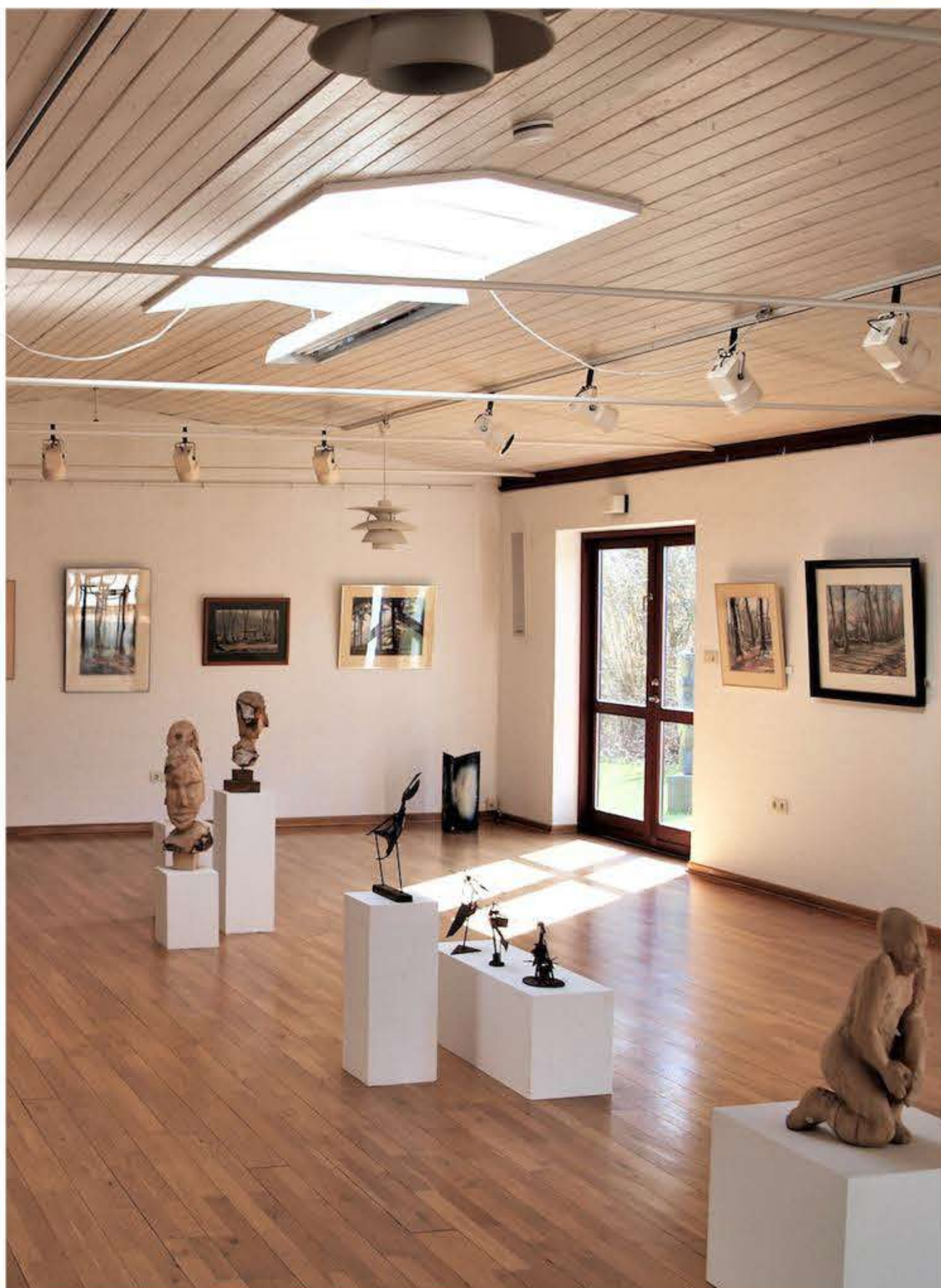
På Mikkelberg er der masser af frirum inde...