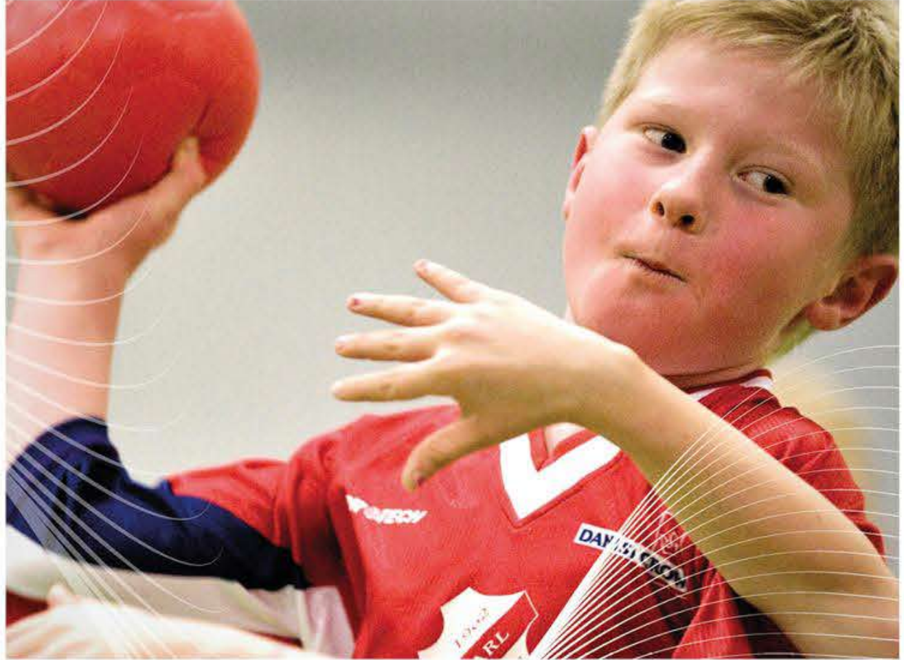
SdU tilbyder håndboldskoler for tre aldersgrupper.