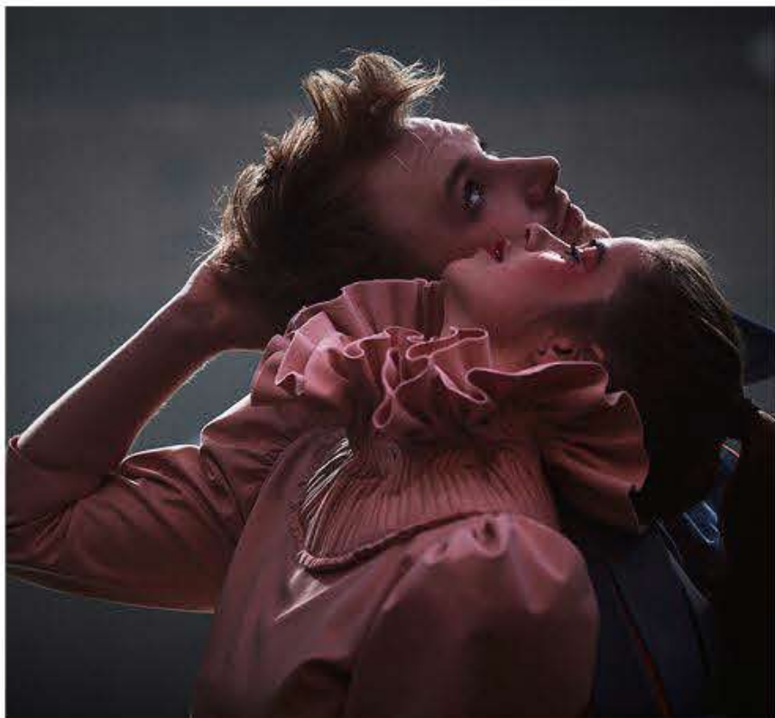
Romeo + Julie.

Usikkerheden har været stor omkring Teatret Møllens forestilling "Romeo + Julie". I første omgang var premieren sat til den 8. juni 2020, men teatret blev som mange andre nødt til at aflyse, da Danmark lukkede ned på grund af COVID-19. Det lykkedes dog teatret at rykke forestillingen til sommeren i år med støtte fra forestillingens tilskudsgivere.