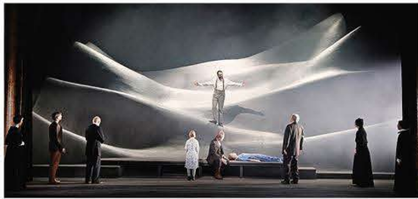
Scenefoto fra "Ordet".