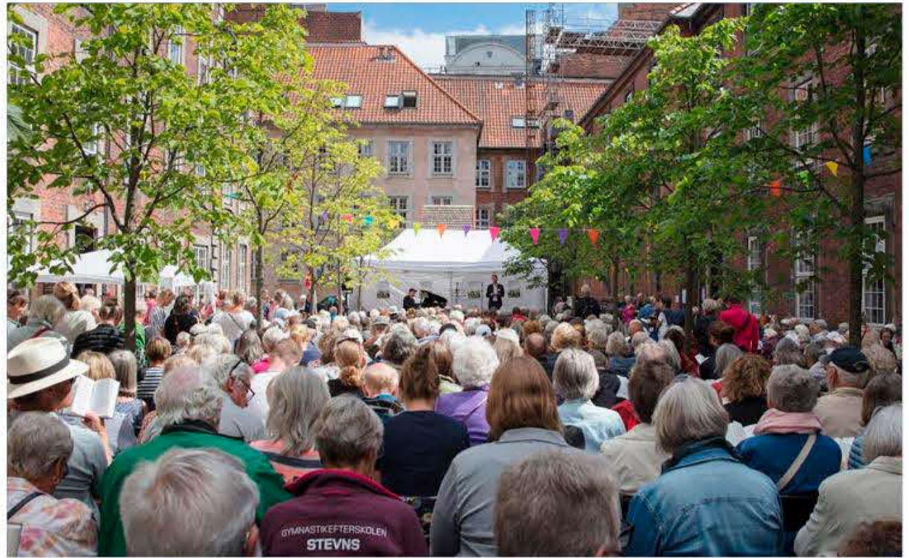
Gården i Vartov bliver centrum for Folkemødet Bornholm i Vartov, som Grænseforeningen arrangerer sammen med Dansk Folkeoplysnings Samråd (DFS), Folk & Sikkerhed og Grundtvigsk Forum. Billedet er fra en sangaften i Vartov før corona-pandemien.