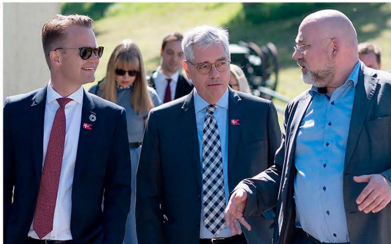
Der lyttes med interesse til museumsinspektøren.

præsentere den spændende historie for ham og sige tak for den danske støtte til et kommende nyt Danevirke Museum.