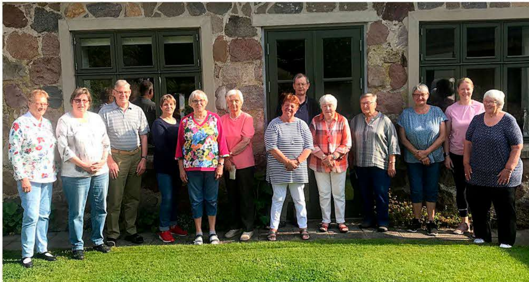
Førsteholdet 2021.