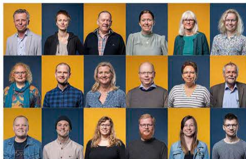
Her nogle af de 90 fotograferede.