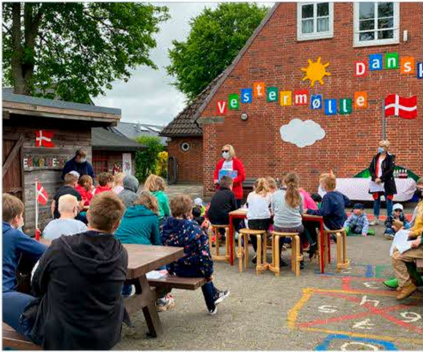
Børnene i Vestermølle nød årsmødet i kombination med 100+1 års fødselsdagsfesten for grænsemærkingen.