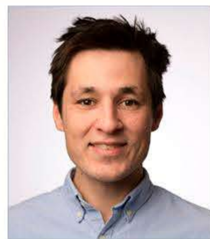
Freelancefotograf Martin Ziemer.