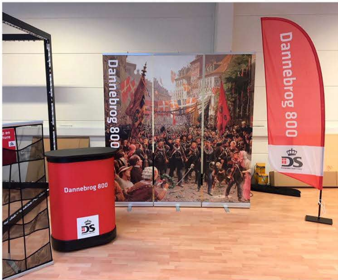
Ikke-afleveret udstillingsmateriale efterlyses.