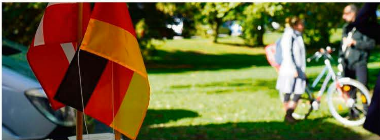
Dansk-tysk samarbejde støttes.

Skoler, foreninger og uddannelsessteder, der gerne vil samarbejde med kolleger syd for grænsen, har nu mulighed for at søge kultKIT om penge i hele 2021.