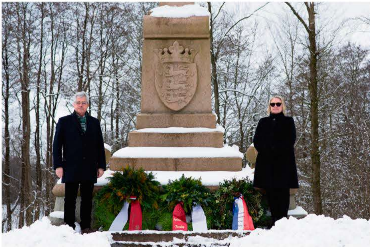
SSFs formand og generalsekretær ved den danske mindestøtte i Sankelmark.