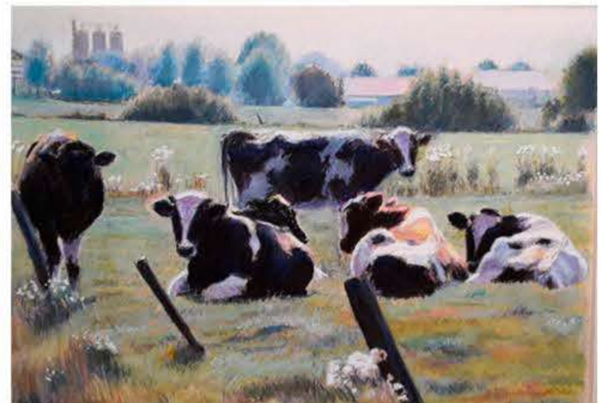
Leif Dahl: Køer.