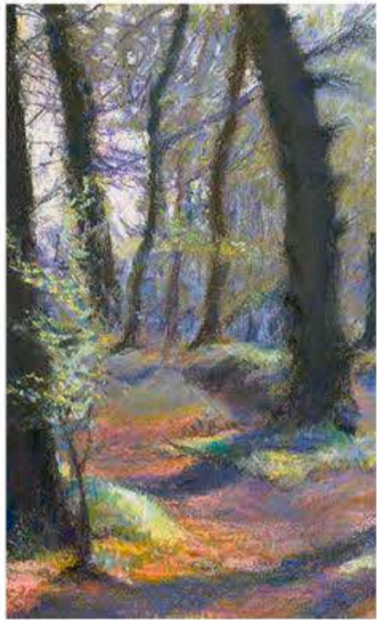
Leif Dahl: Skov i sommerfarver / Ud-snit.