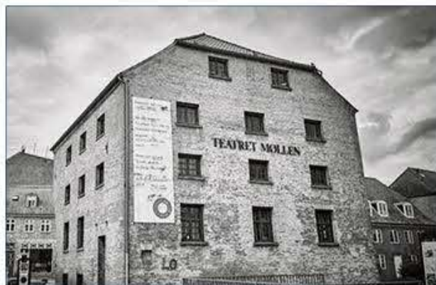
Teatret Møllen i Haderslev.