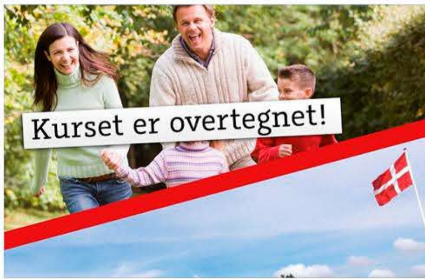
Overtegnet? Ikke når det gælder SSF Flensburg Amts og Voksenundervisningens online danskurser. Her er der plads til flere. (Ill. Skoleforeningen)