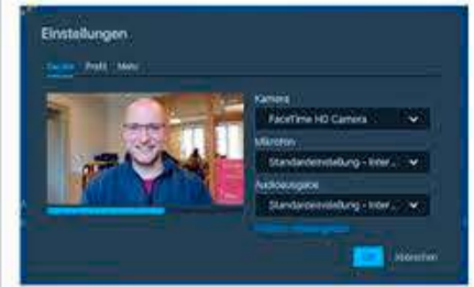
Ill. fra SSWs egen videokanal https://meet.ssw.de

På grund af forlængelsen og skærpsen af corona-restriktionerne skubber SSW sit ekstraordinære landsmøde om forbundsdagsvalget til lørdag 6. marts på A.P. Møller Skolen. Også partiets kandidat-check med de tre spidskandidater og de planlagte valgkredsmoder bliver skubbet til februar eller - alt efter situationen - helt aflyst. Det besluttede SSWs landsstyrelse på et videomøde forleden. SSWs landsstyrelse anbefaler derudover, at distrikternes generalforsamlinger bliver skubbet til marts eller endda til efter påske. Vedtægtsmæssigt er der ingen problemer i det, dog skal regnskaberne for 2020 revideres allerede nu. Til gennemførelse af møder i bestyrelser eller fraktioner anbefales det at benytte sig af SSWs egen videokanal: https://meet.ssw.de Beskrivelse (pdf) af, hvordan man gør, kan rekvireres på landssekretariatet.