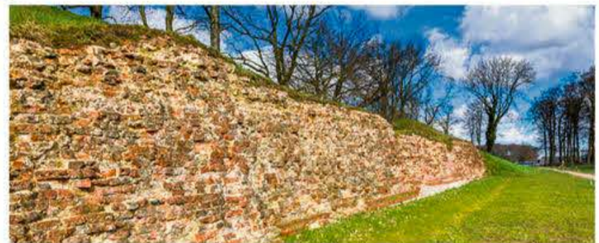
Valdemarsmuren er Danmarkshistoriens største fortidsminde.

Han er særdeles glad for, at SSF med et nyt Danevirke Museum kan leve op til de forpligtelser, den ret nye UNESCO-status medfører. »Selvfølgelig er der forberedelse og tidssvarende formidling med et sted, som er UNESCO-verdensarv. Med et nyt museum kan vi i højere grad leve op til forventningerne i øjenhøjde med Danevirkes partnermuseer i Hedeby og på Gottorp Slot.»