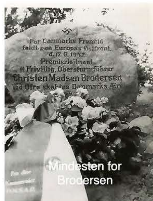
Mindesten for Brodersen