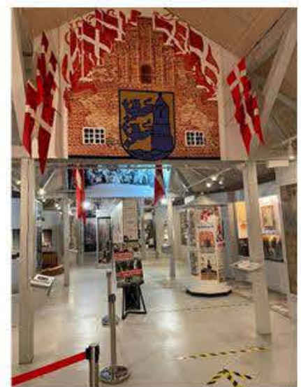
Blick in die Ausstellungs-Räumlichkeiten des Museums.