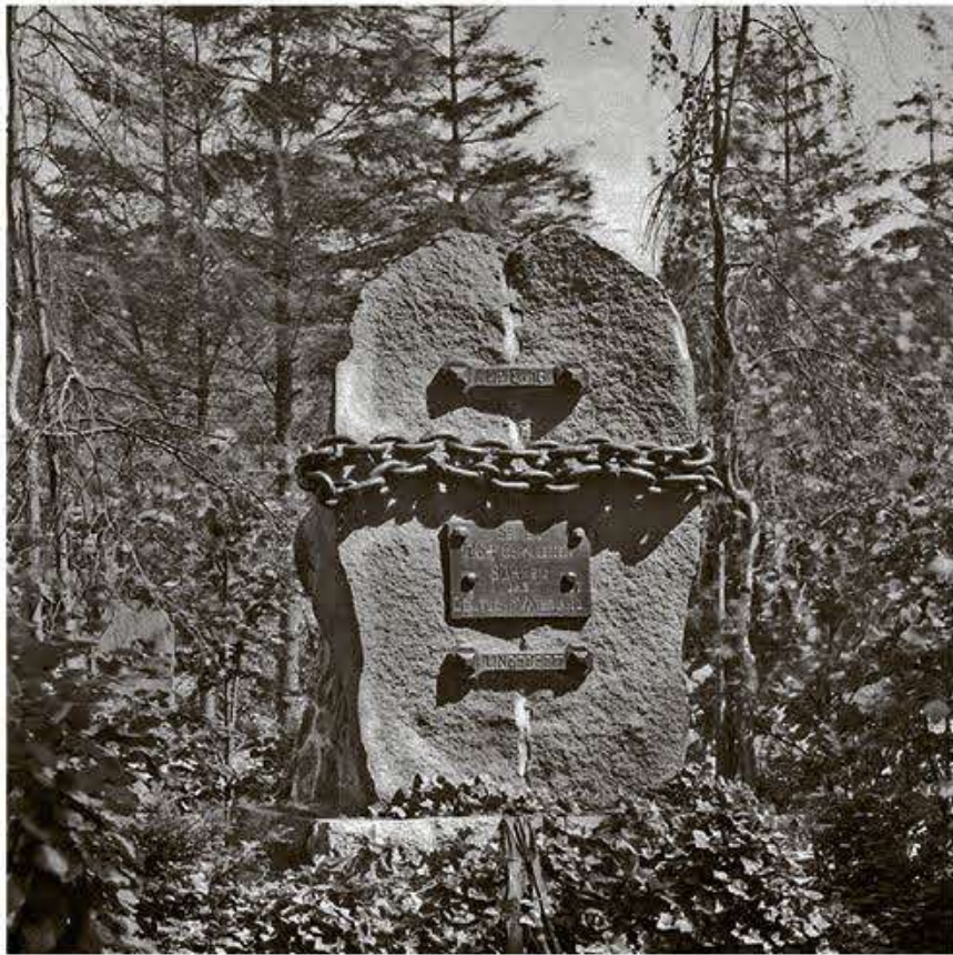
Det symboltunge slesvig-holstenske mindesmærke på Broager kirkegård.