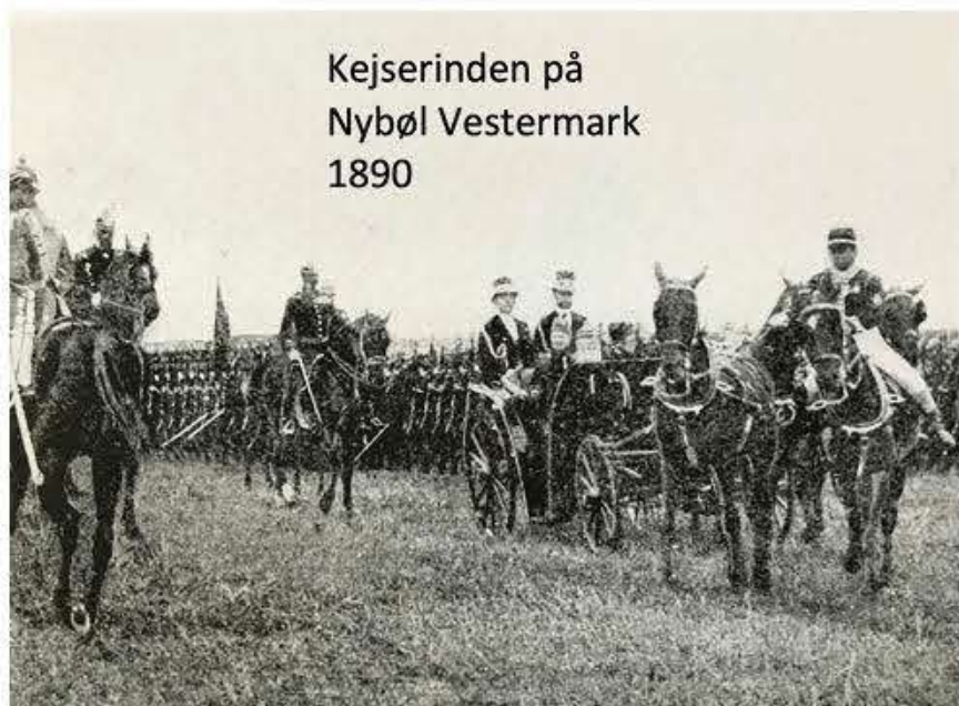
Kejserinden på Nybøl Vestermark 1890

Sønderjysk Månedsskrift udgives af Historisk Samfund for Sønderjylland og udkommer otte gange om året. Det udsendes til medlemmer af foreningen og kan købes af andre. Send en mail på hssdj@hssdj.dk Mere på hjemmesiden https://www.hssdj.dk