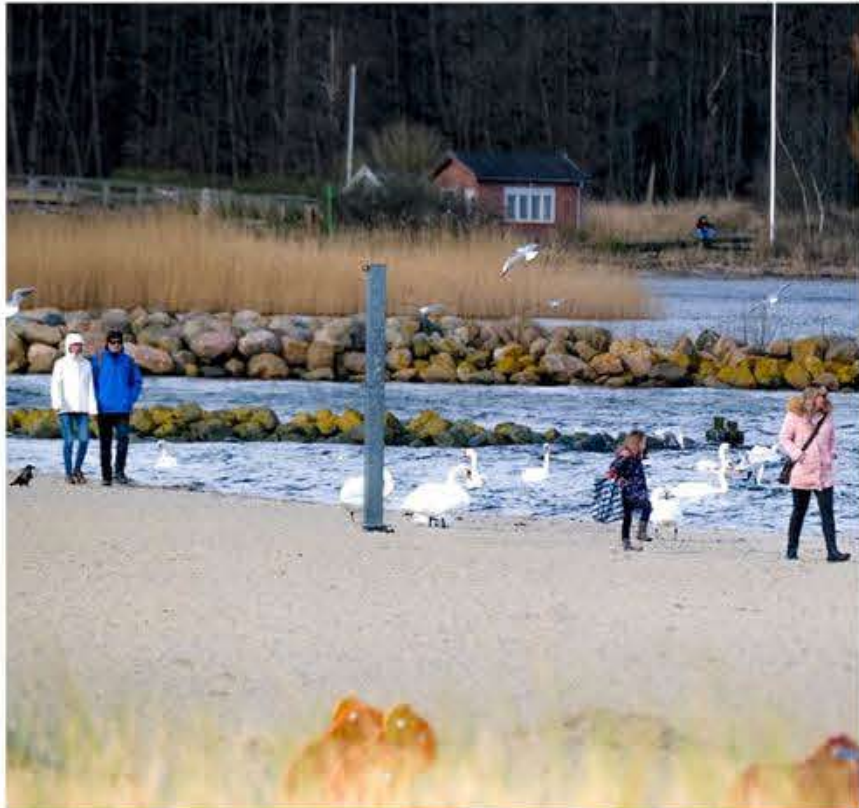
Stranden i Wassersleben (på dansk: Sosti) byder på flotte solopgange, når man er der på det rette tidspunkt.