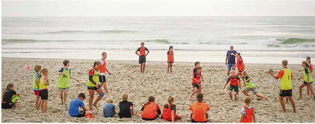
Fra en tidligere håndbold-sommercamp på stranden ved den jyske vestkyst.