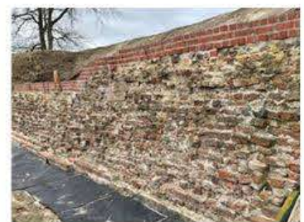
Teile der Waldemarsmauer werden renoviert.