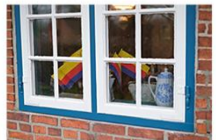
På tur i Nordfrisland ser man flere steder de frisiske farver og mange andre ting, der er kendetegnende for den frisiske kultur.