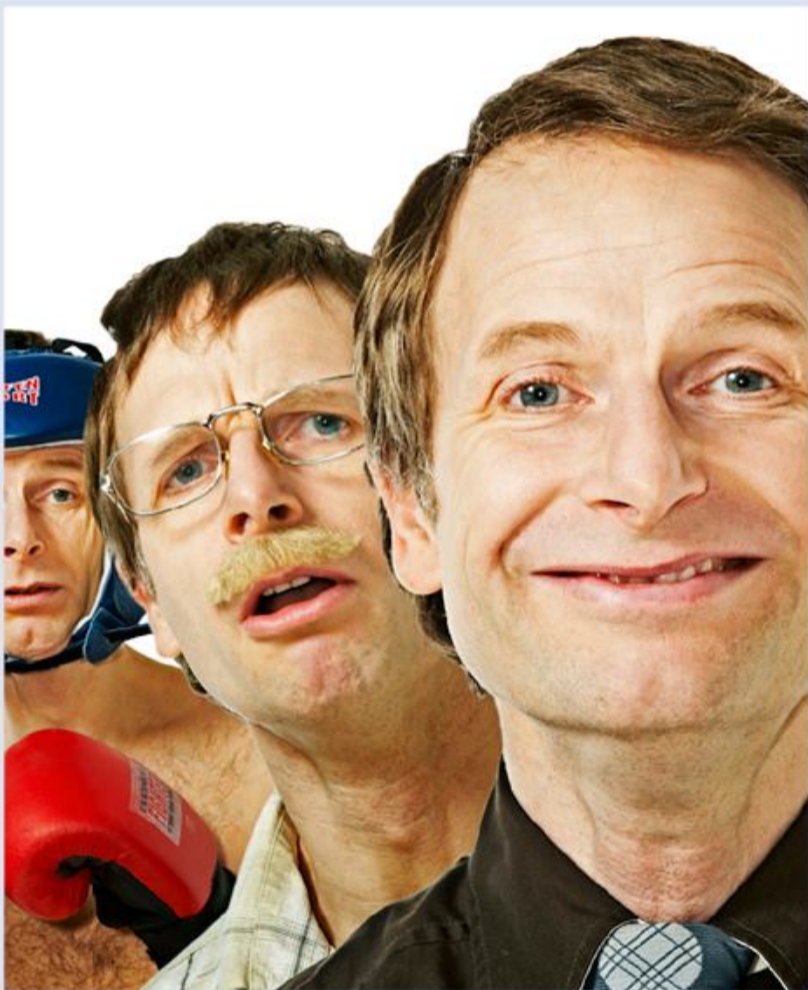
Skæve figurer med store hjerter 11. januar i Flensborg.