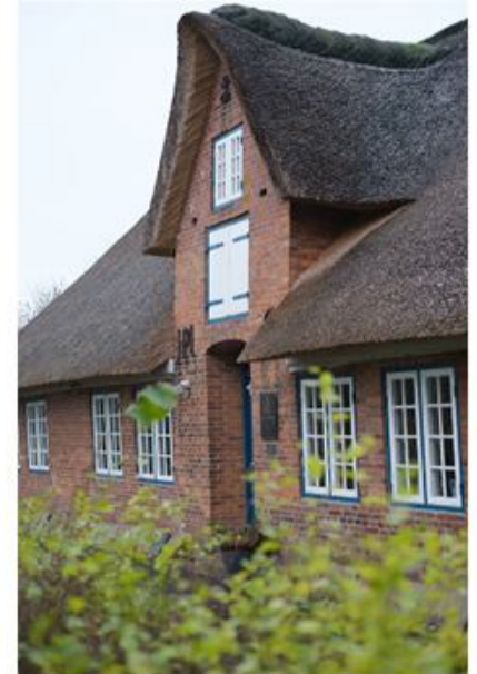
Et typisk hallighus. Især arkitekturen i Nordfrisland er et tydeligt kendetegn på den frisiske kultur.

- Danskerne har det jo tit svært ved at have en kultur ved siden af deres