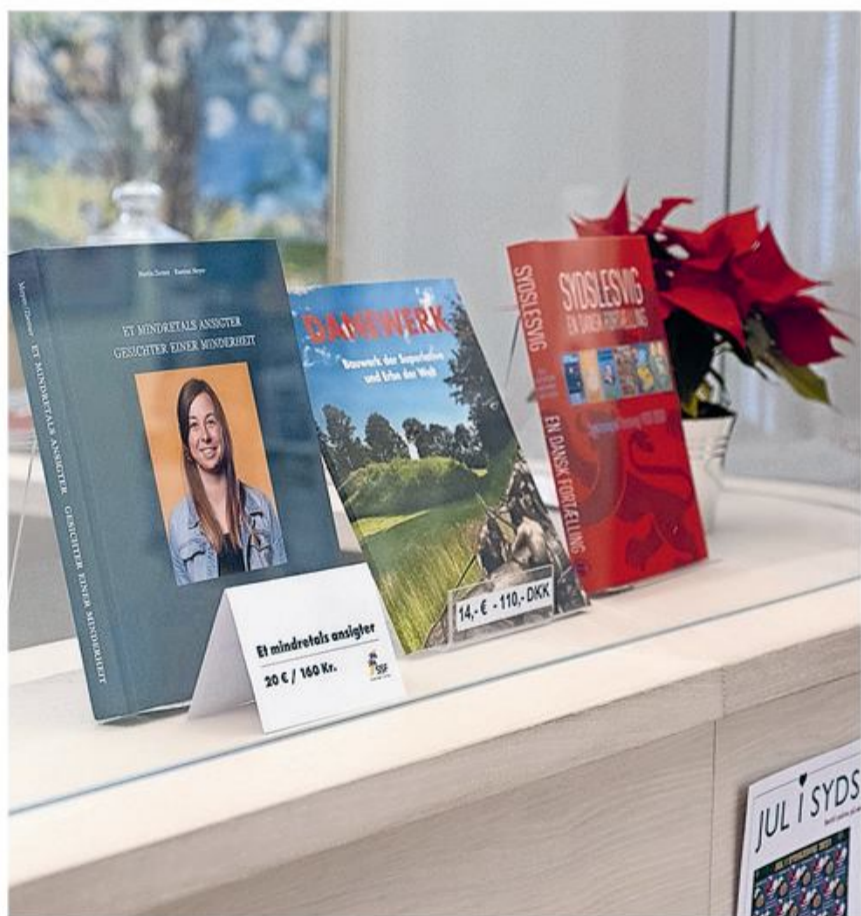
... og bøger som julegave-ideer.