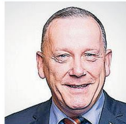
og Kay ønsker en god jul.