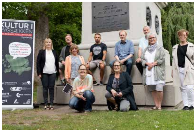
Repræsentanter for samarbejdspartnerne deltog ved lanceringen tirsdag formiddag.