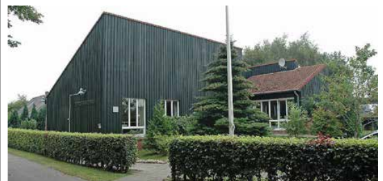
SSFs forsamlingshuse - her Hærvejskøhuset i Skovby - åbnes op igen under hensyntagen til de aktuelle coronare forholdsregler.