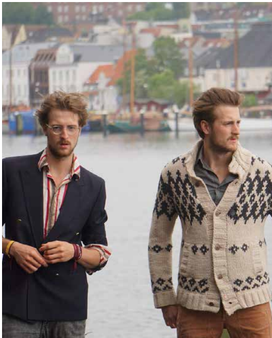
Pameto giver koncert på Flensborghus nu på søndag kl. 16.