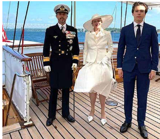
HM Dronningen og DKH'er Kronprisen og Prins Christian ombord på Dannebrog, inden kongeskibet lagde til kaj i Sønderborg.