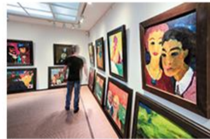
Fra udstillingen på Nolde-museet.

Hvordan og hvorfor tegnede tyske kunsthistorikere, politikere, forfattere og journalister i flere årtier et billede af Emil Nolde, som ikke var sandt? Hvorfor tog forbundskansler Angela Merkel Emil Noldes billeder ned fra kanslerkontoret, mens Slesvig-Holstens kulturminister Karin Prien kort efter hængte Nolde op på sit kontor i Kiel?