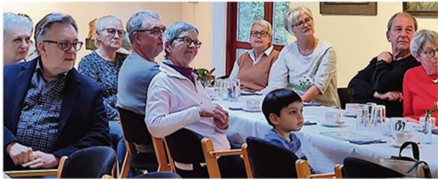
Der blev lyttet med opmærksomhed.