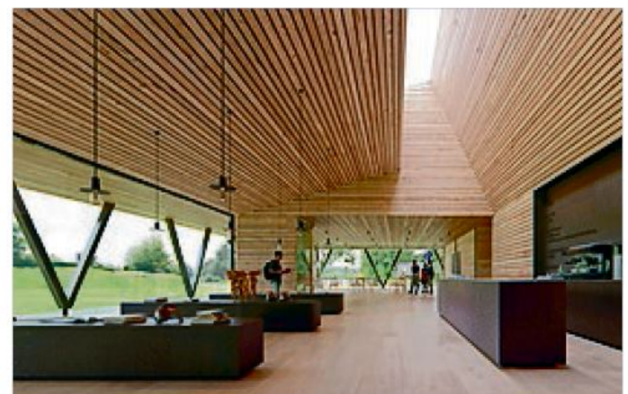
Sådan vil det nye Danevirke Museum tage sig ud, når byggeriet er færdigt engang sidst i 2024. (Ill.: Lundgaard & Tranberg/ Kvant-1)