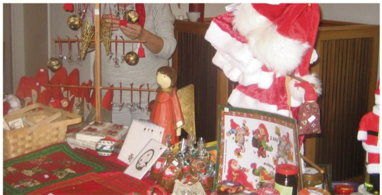
Julerigtige tilbud på julemarkedet i Sdr. Brarup nu på lørdag.