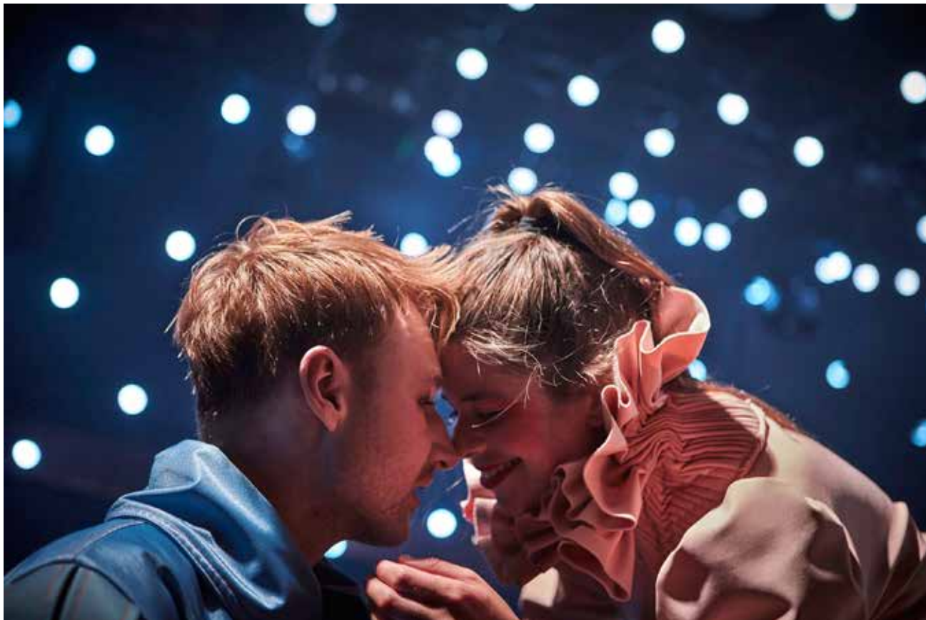
Fra Teatret Møllens forestilling "Romeo + Julie".