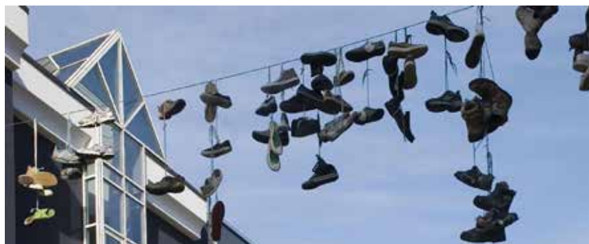
Anbefalingerne fra Nørregade i Flensborg fås nu online.