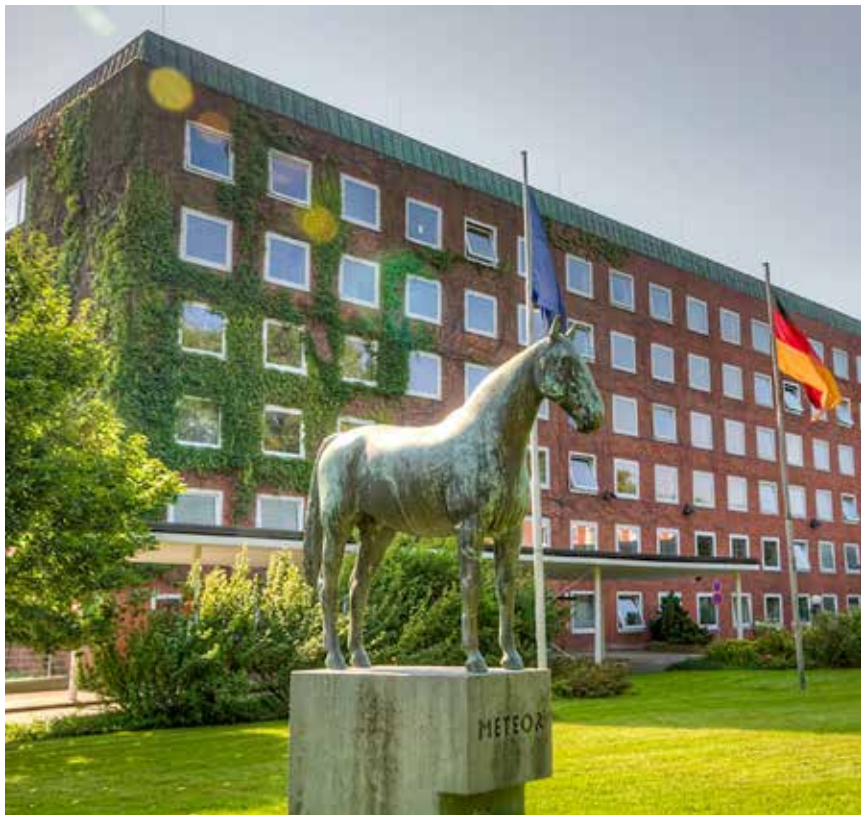
Choice, Kiel, Landtag, Schleswig-Holstein, Staatskanzlei.