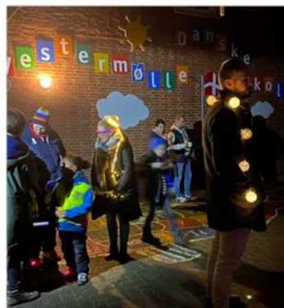
Startklar - godt belyst.