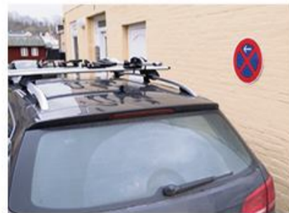
Er "parkering forbudt" – gælder det også på Flensborghus' p-plads.

Stemningen på parkeringspladsen på Flensborghus har gennem de seneste måneder udviklet sig på beklagelig vis. Viceværtten er blevet mødt med flere aggressive tilbagemeldinger, hvilket nu får Dansk Generalsekretariat til at reagere. Reglerne på parkeringspladsen skal overholdes, og når voksne menneskers sunde fornuft fejler, skal der på et tidspunkt tages andre midler i brug. Det burde for enhver være klart, at der kun må parkeres i parkeringsbugtene. Man må altså ikke holde de steder, hvor der er "parkering forbudt". Ej heller på parkeringspladser for mennesker med handicap, når man ikke har ret til at holde der. Det burde også være klart, at parkeringspladsen på Flensborghus kun er for folk, der har aktuelle gøremål på stedet. Den er ikke tænkt som holdested for udflugter ind til byen. Og selvsagt må man ikke blokere for andre biler. Lige som man ikke skal blokere for ind- og udgange. Disse skal til enhver tid kunne bruges af brandbiler og ambulancer, for når skaden skulle ske, tæller hvert et sekund. Derfor skal Dansk Generalsekretariat - henholdsvis viceværtten - sikre, at reglerne på parkeringspladsen overholdes. Pladsen er begrænset. Der er på grund af et byggeforetagende p.t. kun 35 parkeringsbugter på Flensborghus. Disse bruges af medarbejdere samt