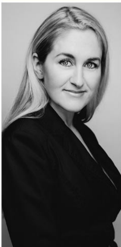
Sopran Iben Silberg.