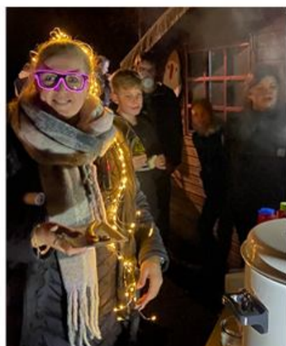
Alle kunne styrke sig efter løbet med pølser og kakao hos SSF-distriktets bestyrelse.