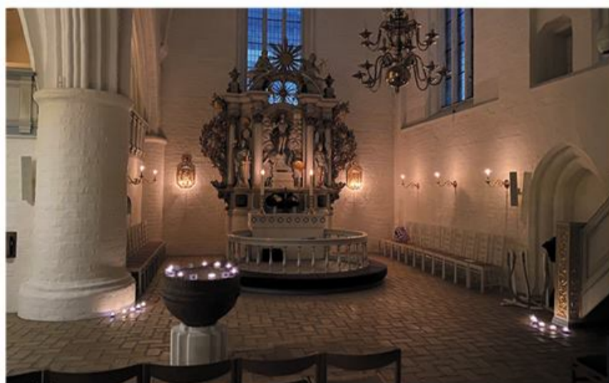
Helligåndskirken danner rammen om mandags-meditationen den 6. december.