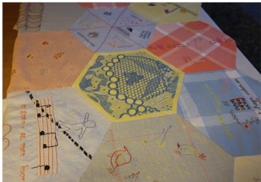
Del af den sammensyede dug.