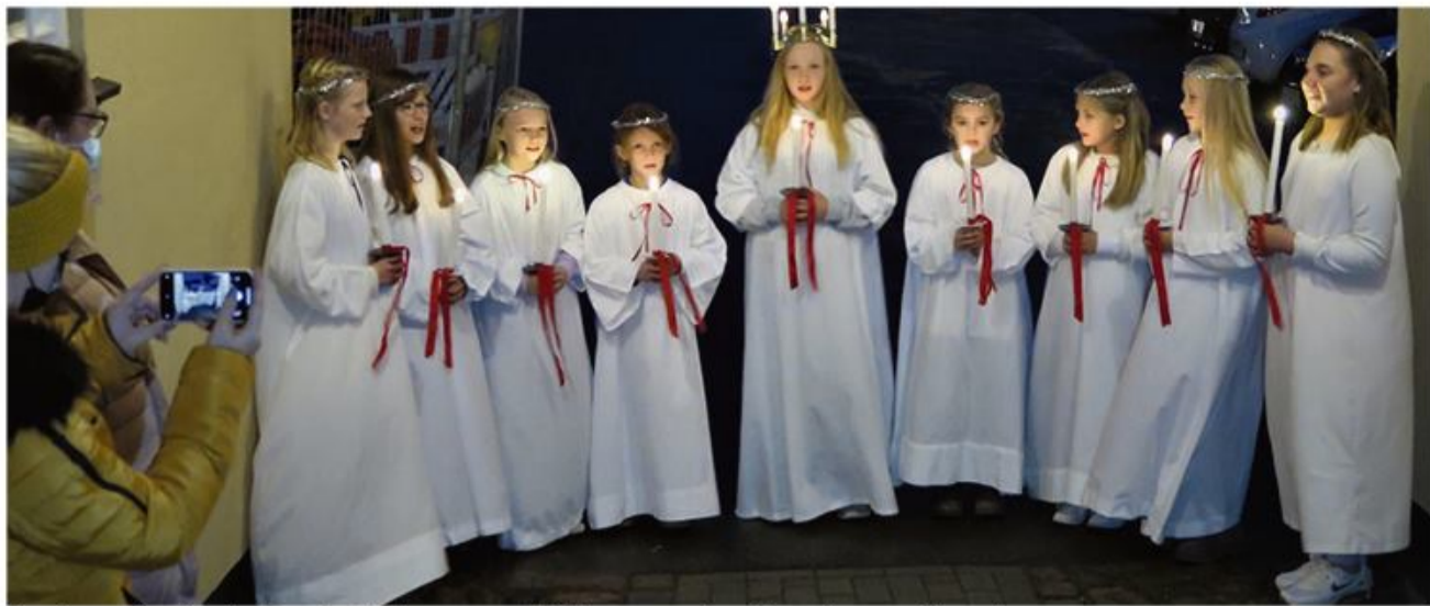
Lyspigerne fra Husby Danske Skole sang yndefuldt - men ude.