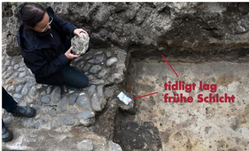
Fundet af et lag, som formentlig stammer fra middelalderen, lover godt for den kommende store udgravning i foråret 2022.