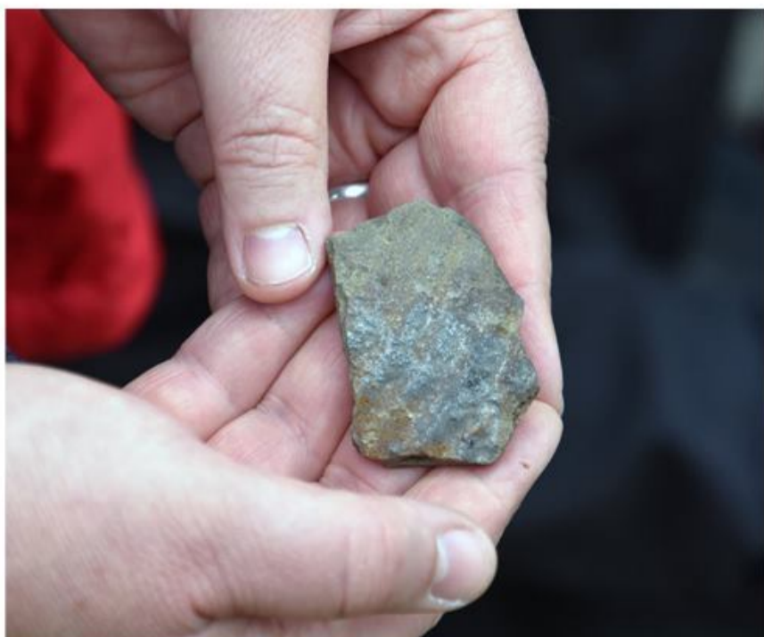
Dette keramikskår har gjort det muligt at datere et af de udgravede lag til 1200-1300-tallet.