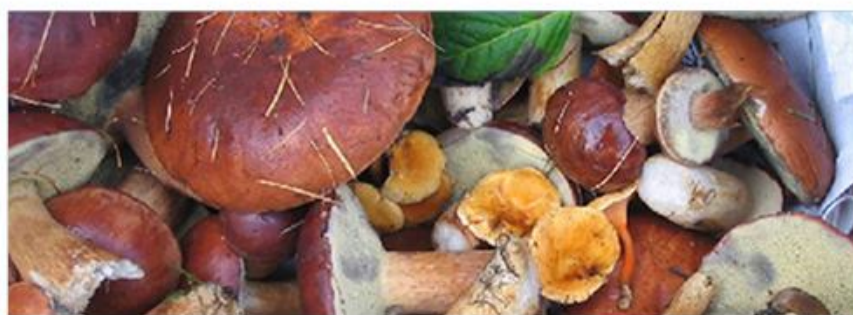
.. eller også en svampetur.