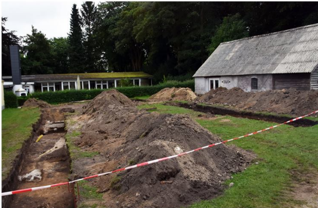
Mellem Danevirke Museum og kanonremisen blev der trukket to søgegrøfter for at få et indblik i, hvordan undergrunden i museets omgivelse ser ud.