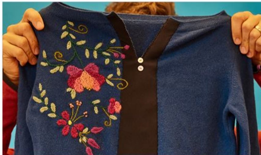
Broderi er en mulighed...

• Eksperimentel billedvævning (2.11. kl. 17-20) • Broderi (20.11. kl. 9-17/ 21.11. kl. 9-15) Man kan altså fomy sit gamle tøj til noget spændende nyt, tage i skoven, hvor der er masser af svampe i år, og man kan endda øve sig i at tale engelsk i en hyggelig runde, plus så meget andet... Mere på www.aktivitetshuset.de sk