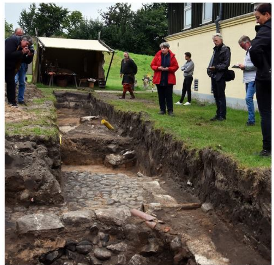
Udgravningen blev præsenteret for offentligheden den 25. august, inden grøfterne lukkes igen.