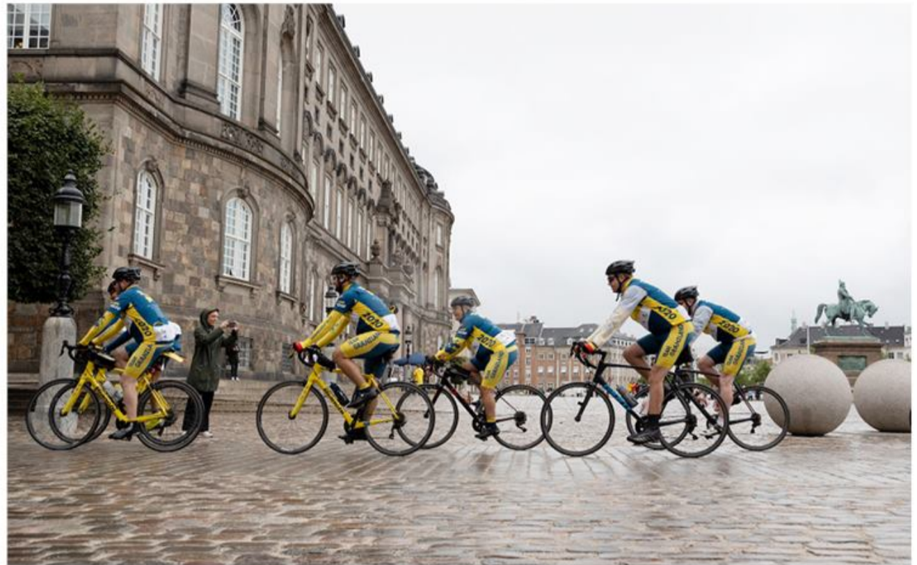
Cykelrytterne fra Team Grænmland ankommer på Christiansborg.