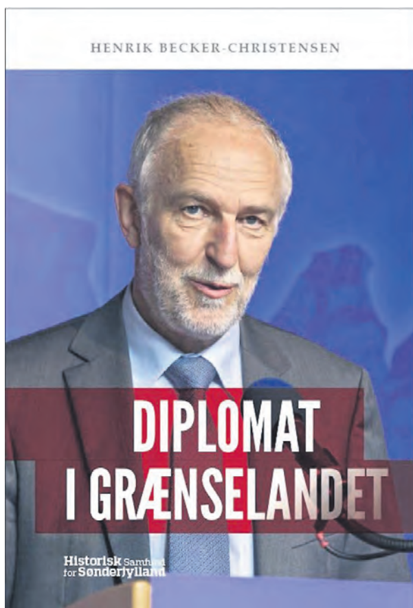
Den tidligere generalkonsuls erindringer er blandt præmierne i quizen.