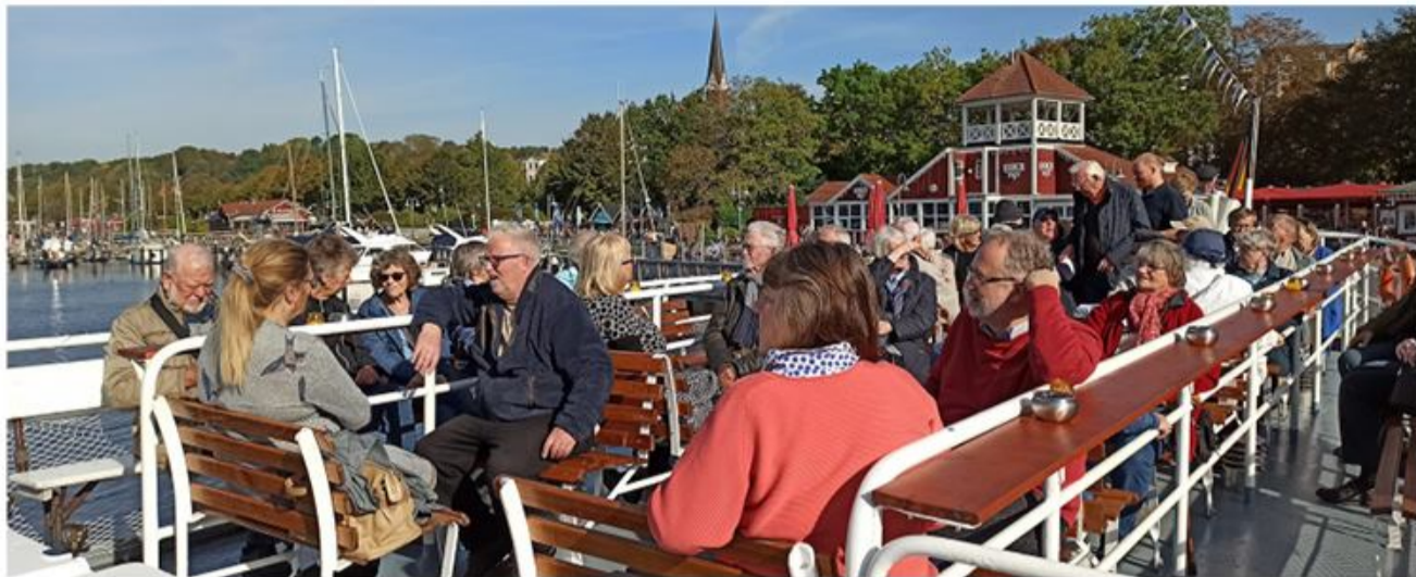
Forventningsfulde deltagere ombord på det gode skib "Sønderborg".