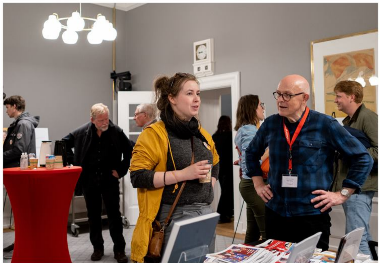
Samtaler prægede mindretallets deltagelse i kulturnatten.

siden 1993. Arrangementet er byens mest afholdte og velbesøgte kulturbegivenhed, hvor hele byens kulturliv åbner sig for et bredt publikum. Mere end 250 museer, teatre, biblioteker, kirker, ministerier, parker og pladser slår dørene på til endagsbegivenheden. Eneste betingelse til deltagelsen er et kulturpas. Ved første arrangement i 1993 deltog 45 institutioner, og der blev solgt omkring 4.000 pas. Det antal er stegt til omkring 250 deltagende institutioner og omkring 90.000 solgte Kulturpas. Bogen "Et Mindretals Ansigter" kan nu købes på SSFs sekretariat til en pris af 20 euro. Den 2. november præsenteres udstillingen samt bogen for projektets deltagere. De modtager en personlig invitation inden længe.