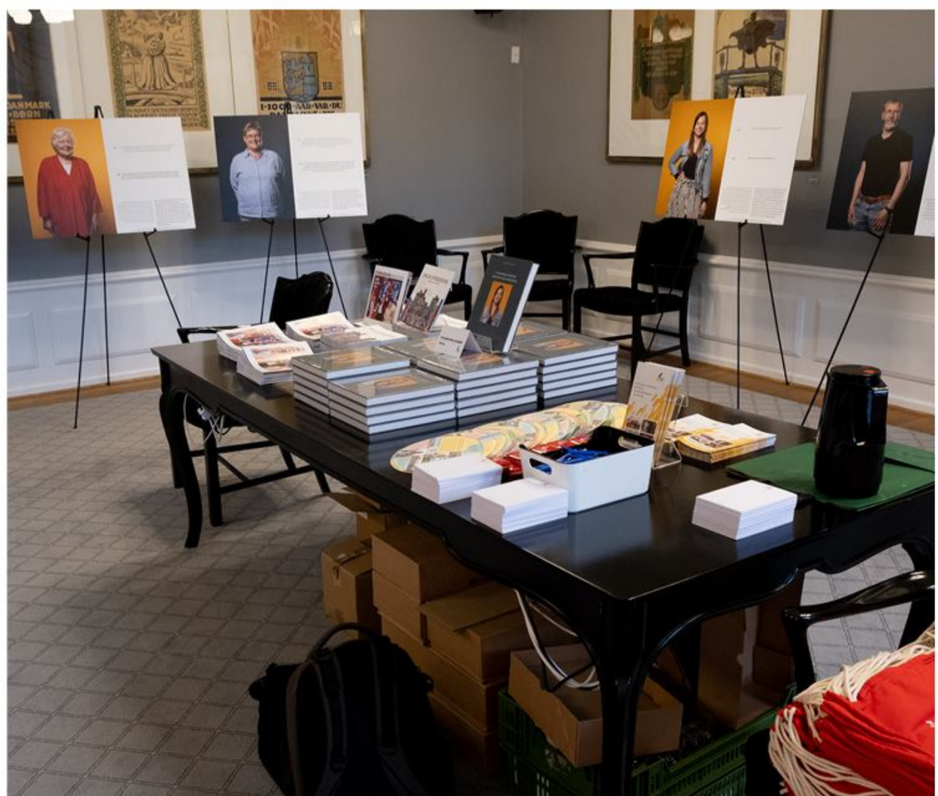
Information var der en del af.