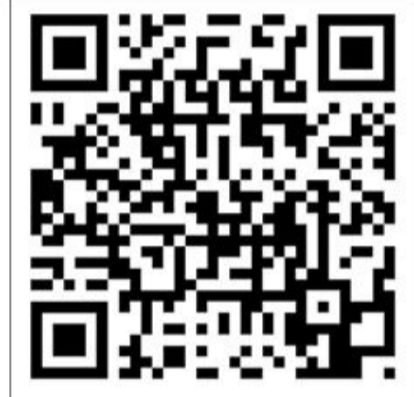
Check selv lyden på qr-koden.