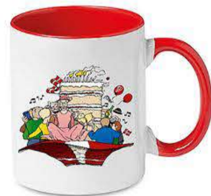
Man kan vinde seks årsmødekrus, hvis man svarer rigtigt.