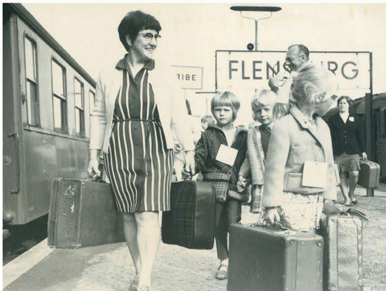
Minderne har man da lov at have.