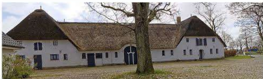
Møllen i Skovlund – måske også genstand for en opgave-løsning...