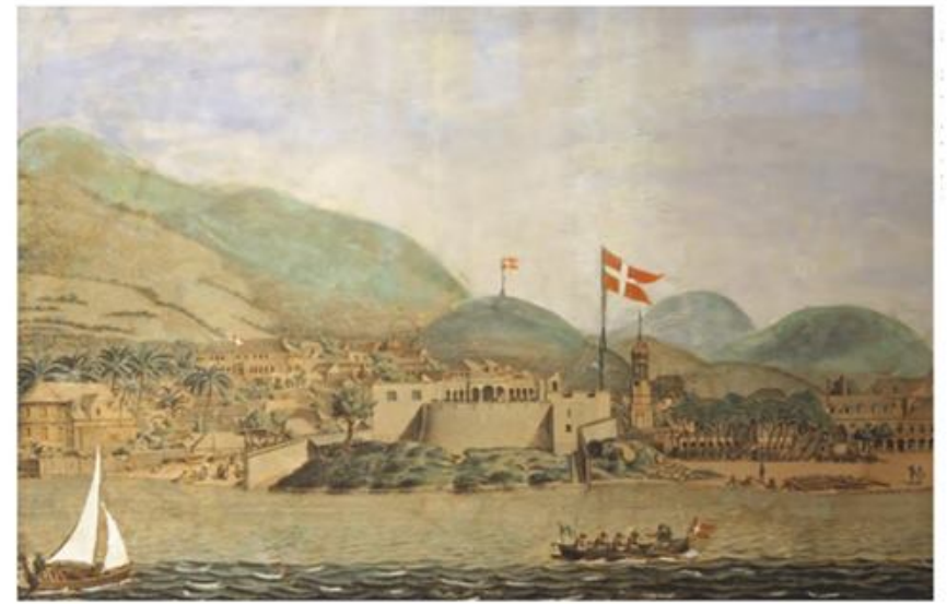
St. Croix var den største og sydligste af de tre Dansk Vestindiske øer. Hovedbyen Christiansted med fortet Christiansværn havde omkring 1780 ca. 4.800 indbyggere.