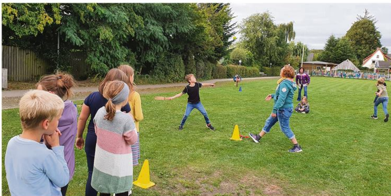
Efter kubb'en blev der spillet rundbold.