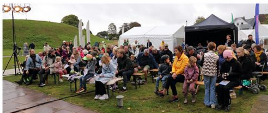
Før Sigurd Barretts koncert.