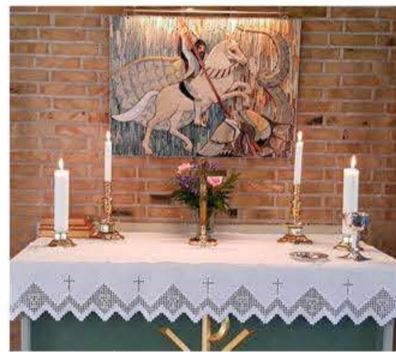
Den nye altervæg.