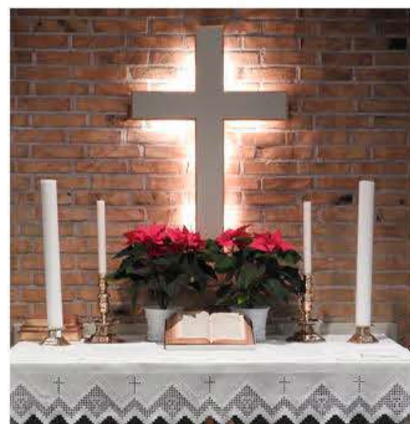
Den gamle altervæg.