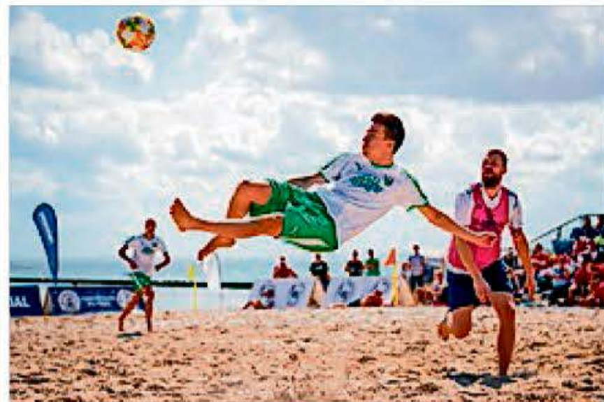
Langs de nordtyske og sydslesvigske strande er strandfodbold en udbredt sport. Nu kommer der en dansk-tysk turnering, Beach Soccer Cup 2021, hvor alle kan stille op. Øvede som nybegyndere, unge og voksne etc. Billedet her er fra en tidligere kamp.