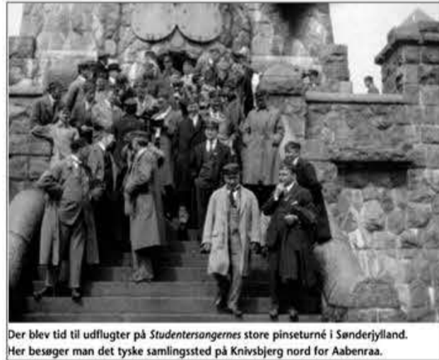
Der blev tid til udflugter på Studentersangerne 's store pinseturné i Sønderjylland. Her besøgte man det tyske samlingssted på Knivsbjerg nord for Aabenraa.

Anløbsbroen i Kollund var smykket med hilsener til både Studentersangerne , der ankom med skib fra Sønderborg, og dansk-sindede fra Sydslesvig, hvoraf mange tog rutebåden fra Flensborg.