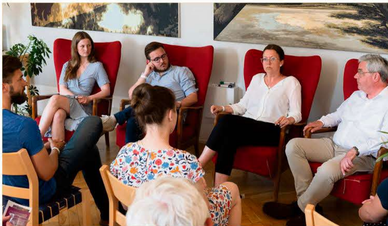
Grænseforeningen Ungdom havde budt til debat om »Bindestregsidetitet«.