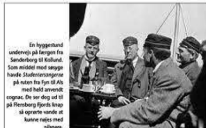
En hyggelig undervej på tægen fra Sønderborg til Kollund. Som middel mod søge havde Studentersangerne på rejsen fra Fyn til Als med lidt anvendt cognac. De var dog ud til på Flensborg Fjords klap så oprette varde at kunne rejse med pinser.

Anløbsbroen i Kollund var smykket med hilsener til både Studentersangerne , der ankom med skib fra Sønderborg, og dansk-sindede fra Sydslesvig, hvoraf mange tog rutebåden fra Flensborg.