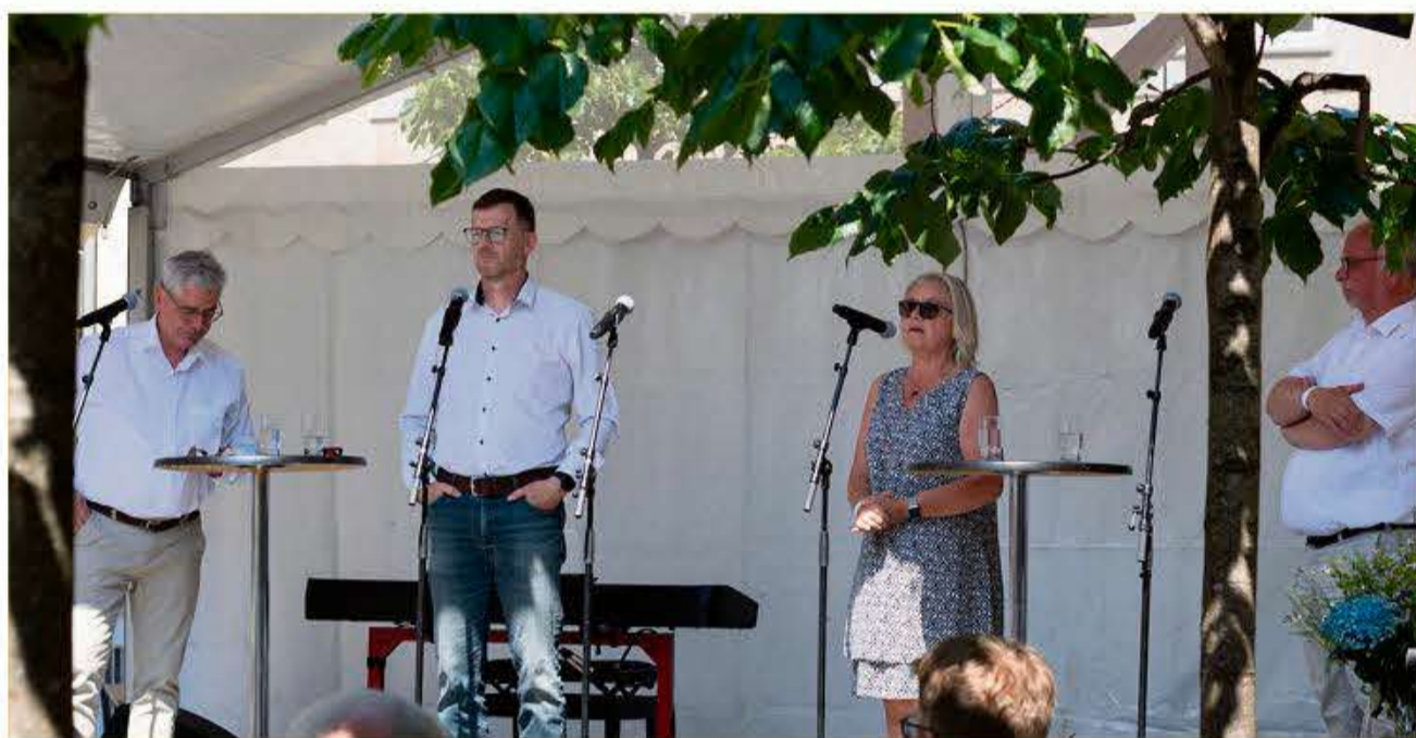
"Dansk arbejde i Sydslesvig er afhængigt af en åben grænse" var overskriften på et debatarrangement på den store scene.