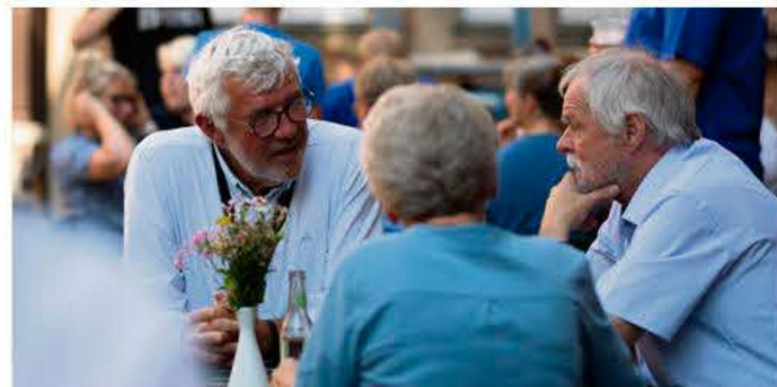
Det var også tid til at få en snak med hinanden.