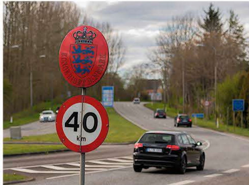
Unge fraflyttere kan nu som noget nyt færdiggøre deres skoleforløb på de danske skoler i Sydsløvigg.