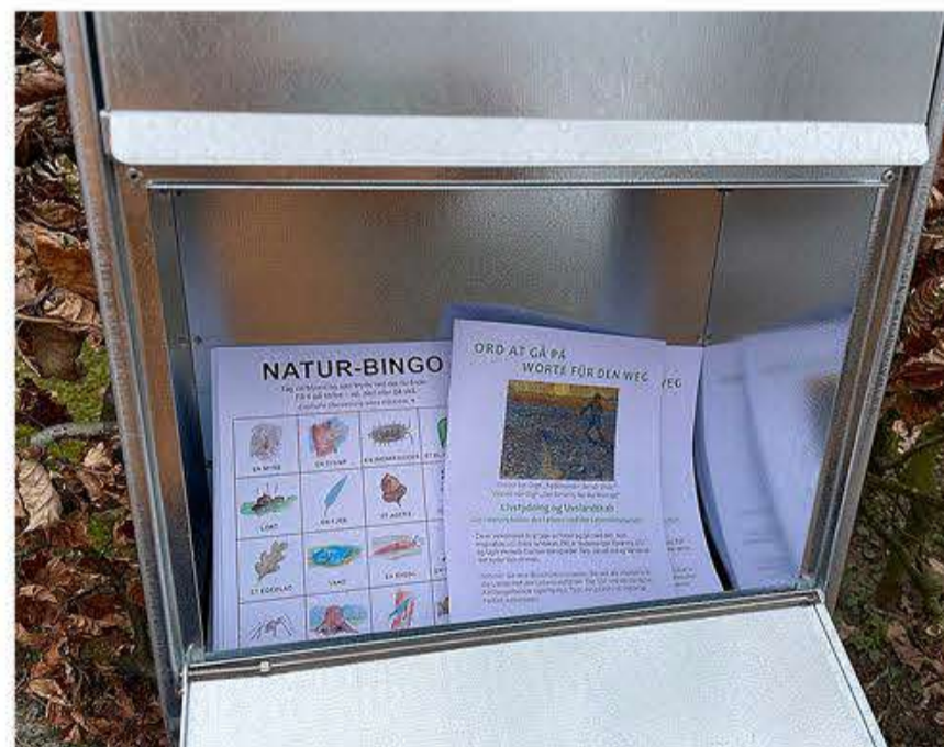
Kassen med de dansk-tyske inspirationsfoldere.