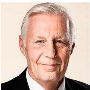
I Idrætshallen lørdag kl.19.30 taler bl.a. Folketingets formand Henrik Dam Kri- stensen og landdagspræsident Klaus Schlie.