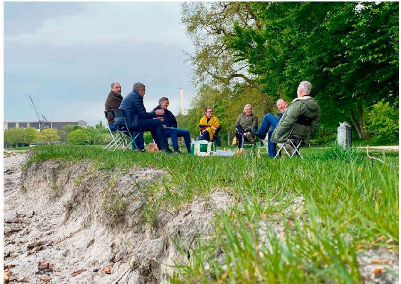
En anderledes - men ikke ringere - mødeform for bestyrelsen for SSF i Flensborg, i det mindste i tørvejr.