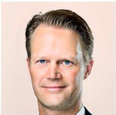
Hovedtalerne på Flensborghus lørdag kl.10: Udenrigsminister Jeppe Kofod og ministerpræsident Daniel Günther.

Og husk: Ingen adgang uden aktuel Corona-test (maks. 24 timer gammel) eller afsluttet vaccinations- henholds- vis smitteforløb. Se årsmødeprogrammet på KON- TAKTside 3.