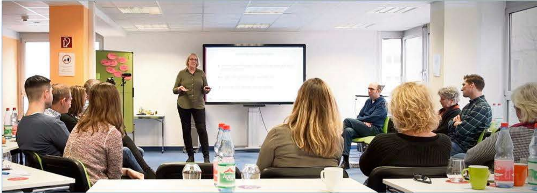
Kurset inkluderer gruppedrøftelser, direkte hhv. online.