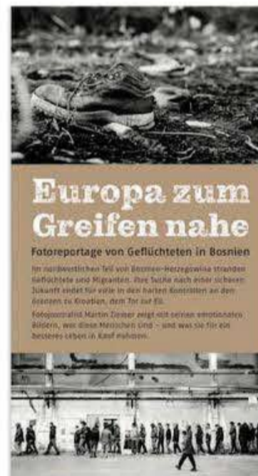
Fotoausstellung von Martin Ziemer in der Istedt-Halle 1. Mai bis 1. August 2021