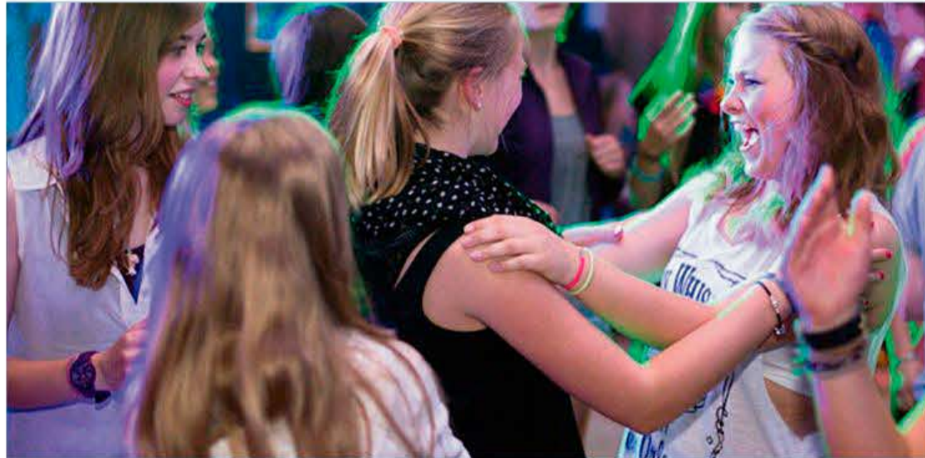
Fra en tidligere sommerlejr.