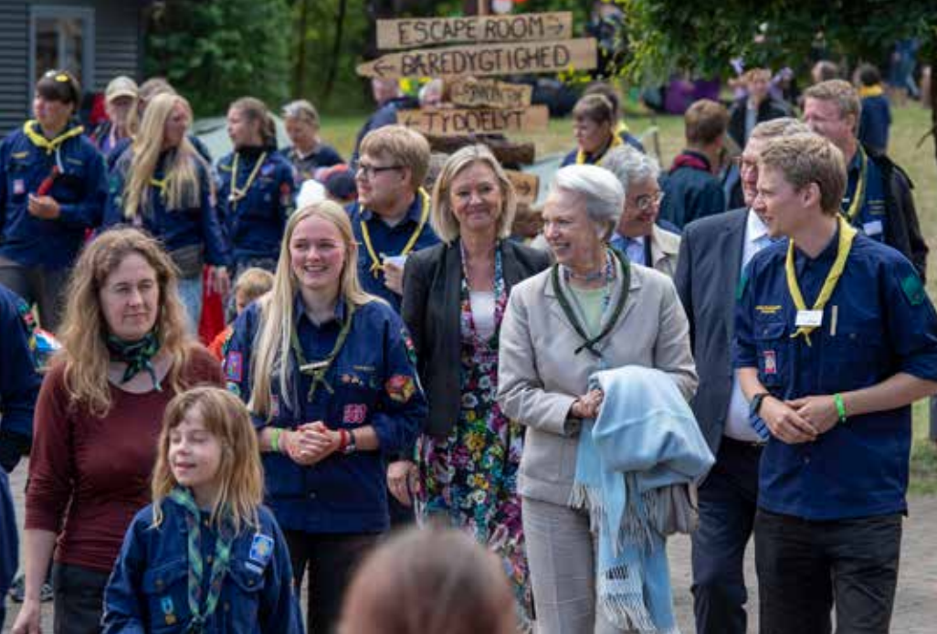
H.K.H. Prinsesse Benedikte besøger DSS' 100-jubilæum på Tydal.

Spejderkorpsset leverede også fanevagter, da dronningen i 2019 gæstede Sydslesvig.