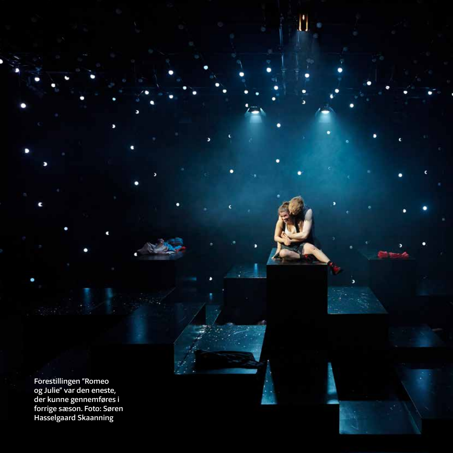
Forestillingen "Romeo og Julie" var den eneste, der kunne gennemføres i forrige sæson.