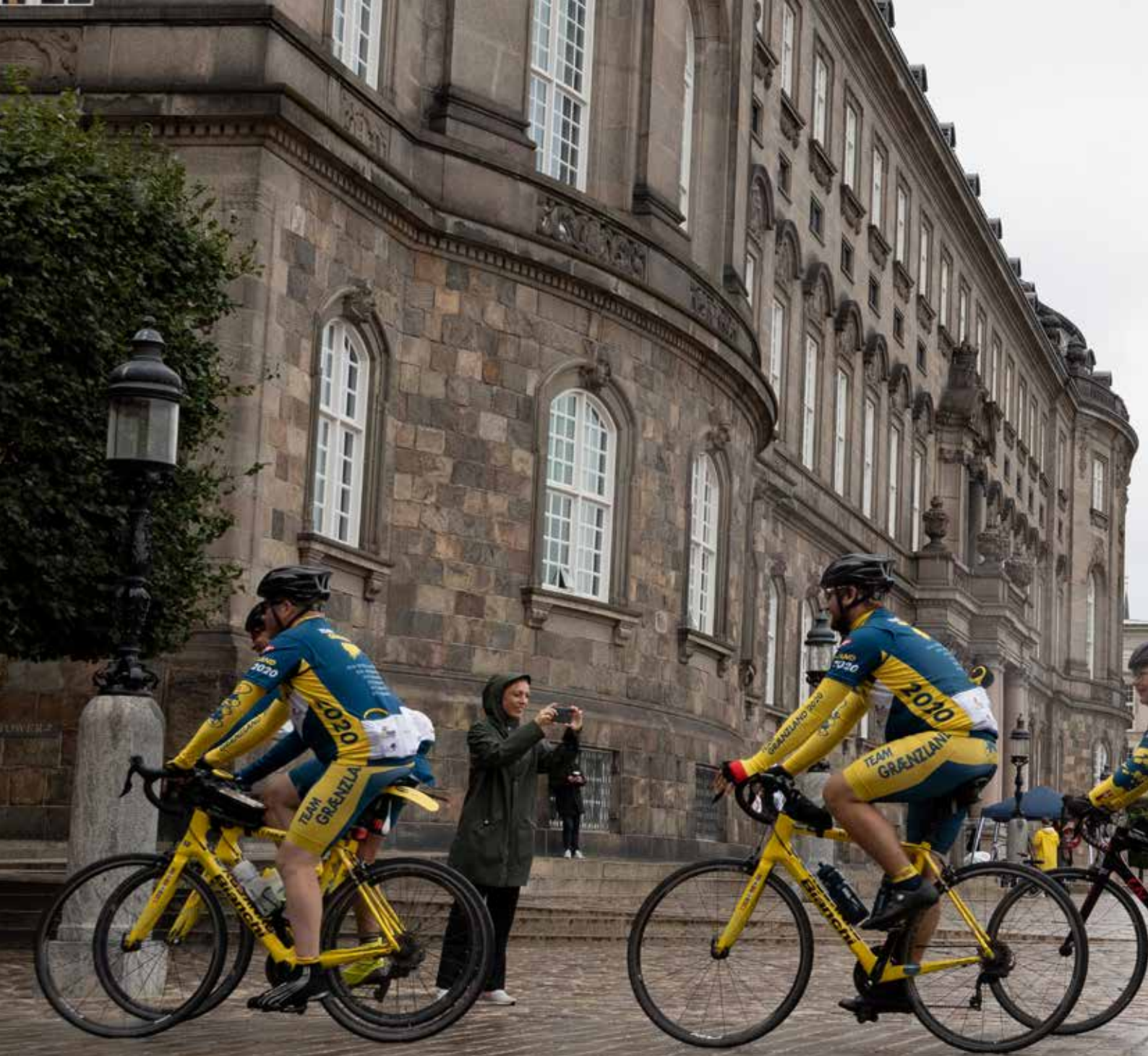
Team Grænmland i København - på vej ind til Rigsdagsgården.