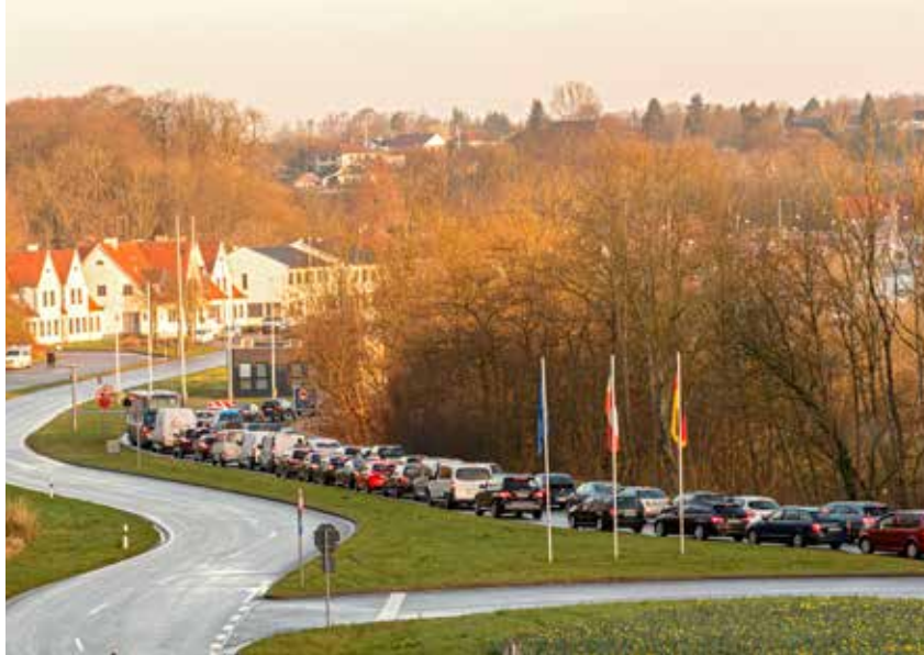
Coronakontrollen gav lange køer for at komme ind i Danmark. Her ved grænseovergang Kruså.

- I ferisesæsonen havde et pendlerspor sparet meget tid. Hvis altså alle andre kunne finde ud af, at de ikke måtte bruge det, siger Andreas Carstens.