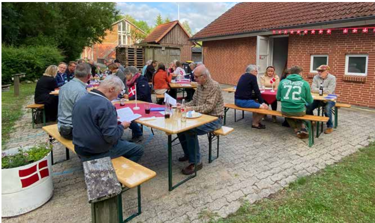
Mens mange andre valgte at ligge stille, gennemførte SSF-Egernførde blandt andet en dansk sankthansfest.

Corona har indskrænket os meget, fortæller Britta Jöns.