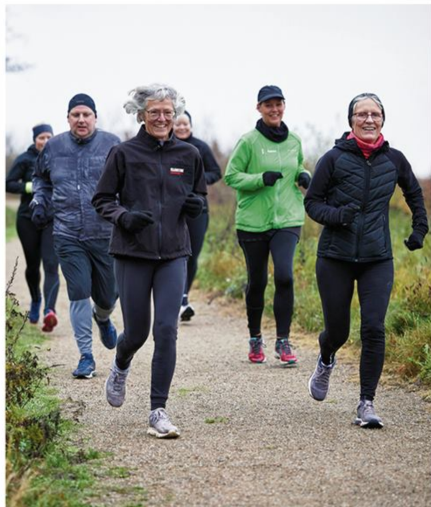
Husk at tilmelde jer til Løveløbet 2022. Man kan også godt deltage med en hyggelig gåtur.

der er noget både for løbere og for dem, der hellere vil nyde en gåtur sammen med andre. Løveløbet er altså noget for alle, og så kombineres løbet med kulturelle tilbud på stederne samt muligheden for hyggeligt samvær inden og efter løbet. Der er altså rigtig mange gode grunde til at deltage. Tilmeldingen foregår via hjemmesiden www.loveloebet.de . Skulle der være udfordringer med det tekniske, hjælper René fra SdU gerne ( rene@sdu.de ).