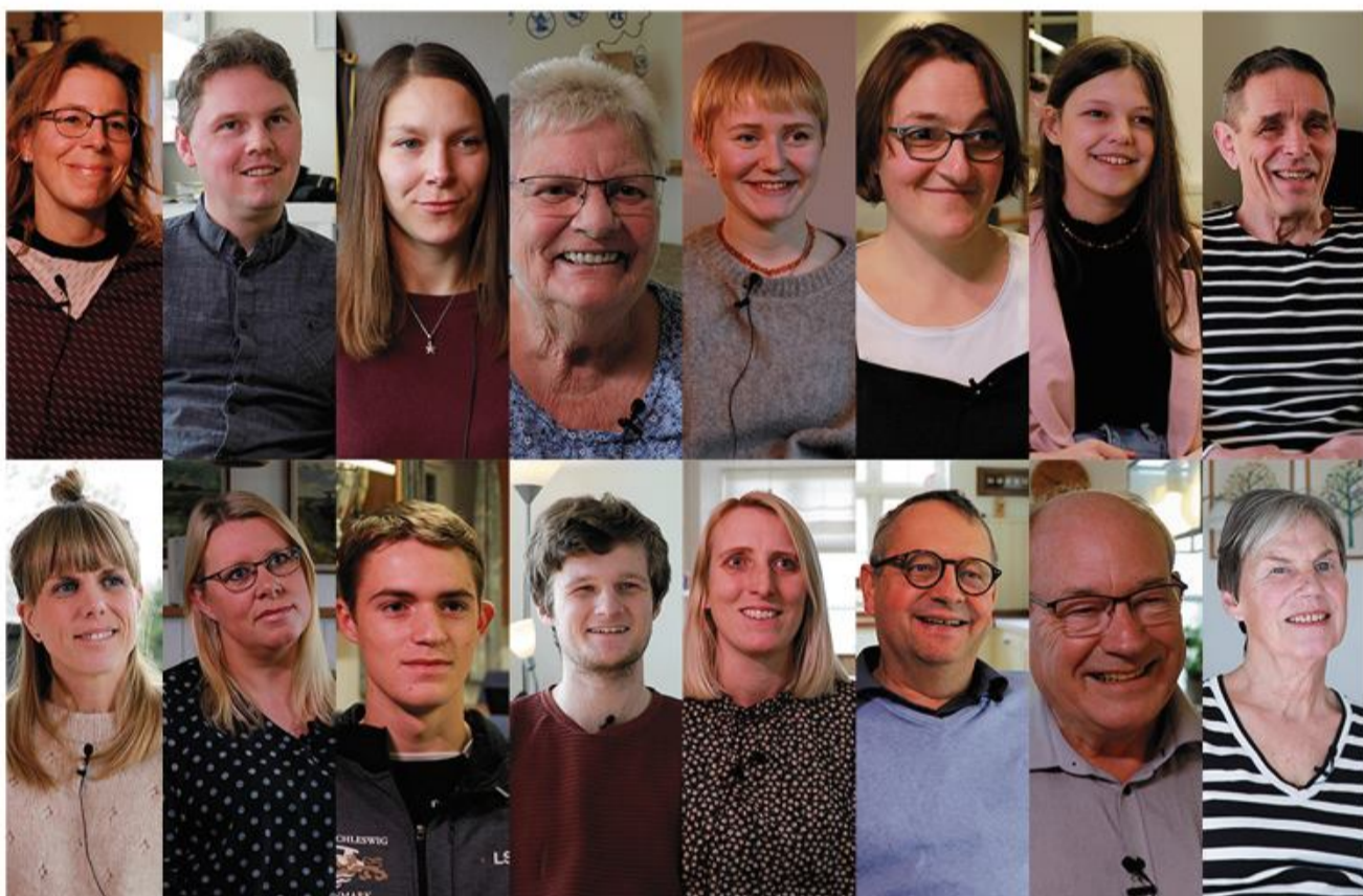
Personer fra det danske mindretal i Sydslesvig og fra det tyske mindretal i Nordslesvig giver indblik i deres hverdag og arbejde i grænselandet.