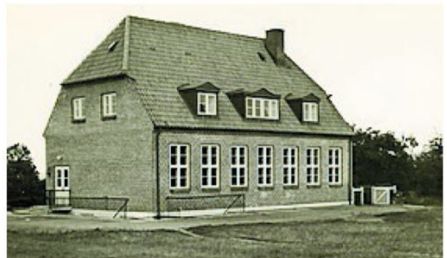
Den gang stod skolen nærmest midt på den bare mark.