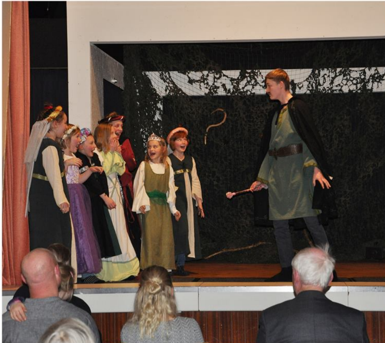
Flere fluer med et smæk. Vinterfesten bliver indhentet her til sommer. Samtidig holdes en medlemsforsamling, der laves en quiz og serveres lækker grillmad.

Entlik häi e Foriining arks iir tu en wunterfäst lååsid. Dåt wus da leeste tou iir ai möölik. Önjstää deerfor jeeft et jarling en fäst önj e samer, tuhuupe ma e lasmootefersoomling awt "Frashlönj" önj Risem (Toorpstroote 95).