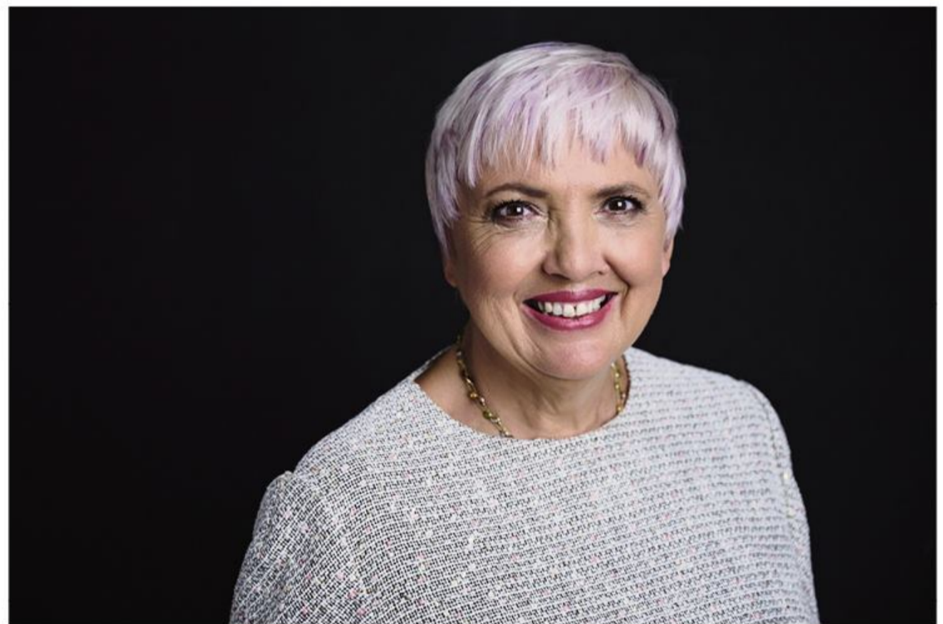
Claudia Roth, Tysklands viceminister for kultur og medier