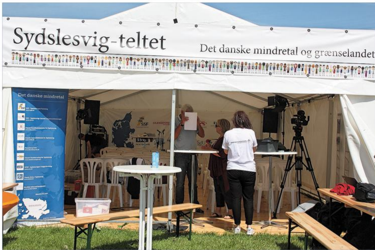
Sammen med Grænseforeningen bruger Sydslesvig Folkemødet til at fortælle om det danske mindretal og grænselandet.