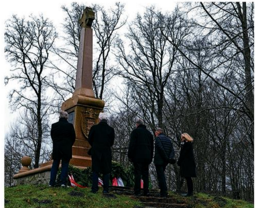
Der blev nedlagt krans ved alle tre mindesmærker. Her ved det danske.

Mindehøjtideligheden "Oversø-Marchen" holdes hvert år den 6. februar. Bag arrangementet står Stammkomitee von 1864 og Sydslesvigsk Forening.