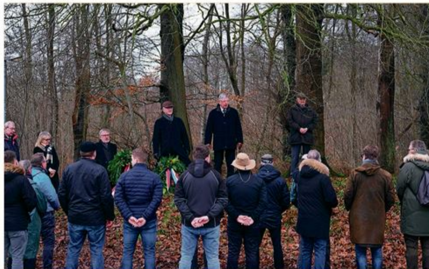
Oversø-Marchen fandt sted i nedskaleret form. Kun få gæster deltog.