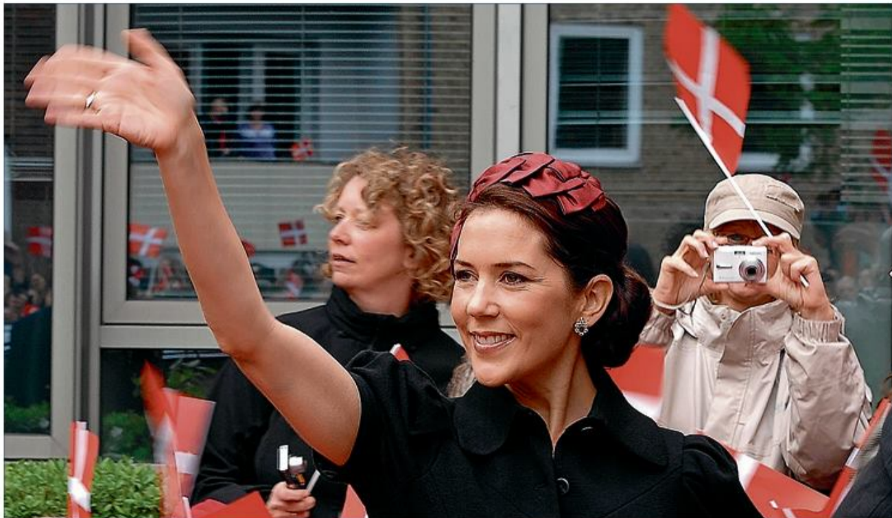
I 2009 var Kronprinsepæret på besøg i Sydslesvig.