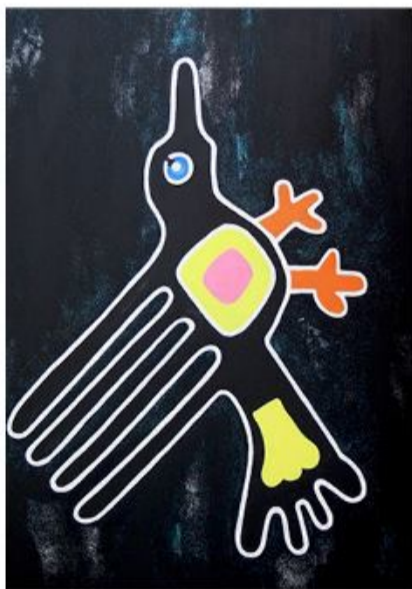
Phönix af Ulla Schmitt