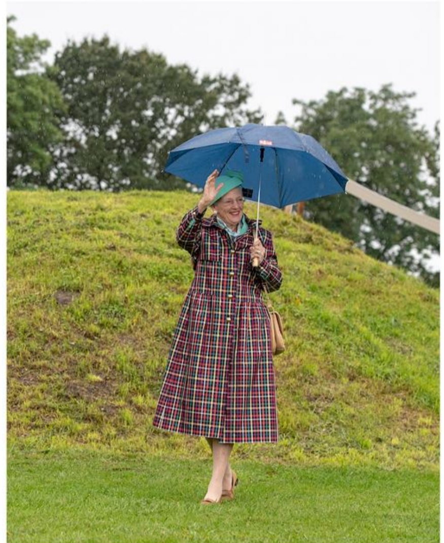
Dronningen på Danevirke i 2019.

Tilmelding til biblioteket: dcb@dcbib.dk Begrænset antal pladser. Husk 2G-regler.