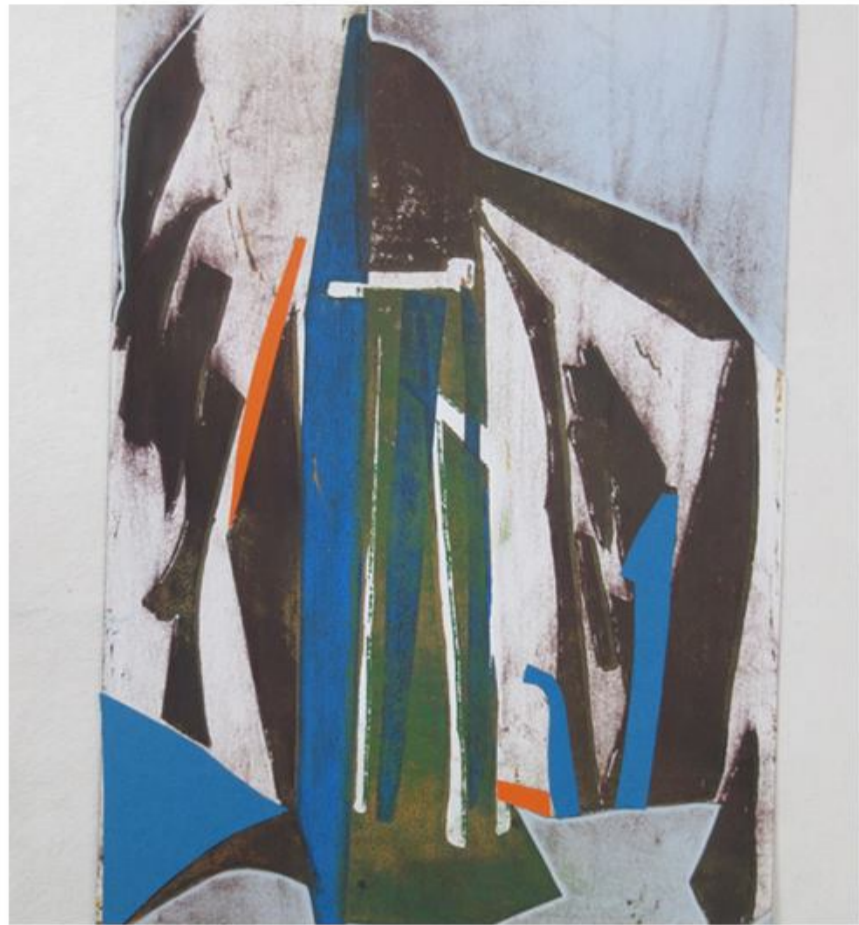
Heike Dittrich - fra serien Tore..